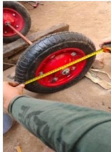
Gambar 2.3 Roda

kecepatan putar roda dapat dihitung penggerak sebagai berikut: