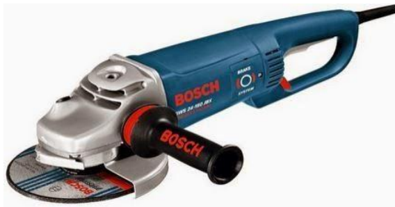
Gambar 2.2 Mesin Gerinda Tangan