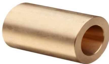
Gambar 2.9 Bushing

Bushing merupakan bantalan jenis silinder bercelah untuk menumpu poros. Pembuatan bushing adalah dengan proses metalurgi serbuk. Dalam pembuatan bushing agar mendapatkan proses pepadatan yang sempurna, maka kompaksi dapat dilakukan pada temperatur tinggi dengan tekanan konstan atau disebut Hot Isostatic Pressing.