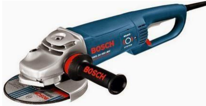
Gambar 2.2 Mesin Gerinda Tangan