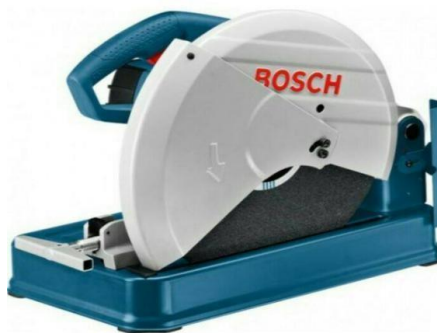
Gambar 2.3 Mesin Gerinda Cut Off

Mesin cut off merupakan sebuah gergaji kasar, juga dikenal sebagai gergaji potong atau gergaji adalah alat listrik yang biasanya digunakan untuk memotong bahan keras, seperti logam, genteng, dan beton. Tindakan pemotongan dilakukan dengan cakram abrasif, mirip dengan roda gerinda tipis. Secara teknis ini bukan gergaji, karena tidak menggunakan tepi gigi (gigi) secara teratur untuk memotong.