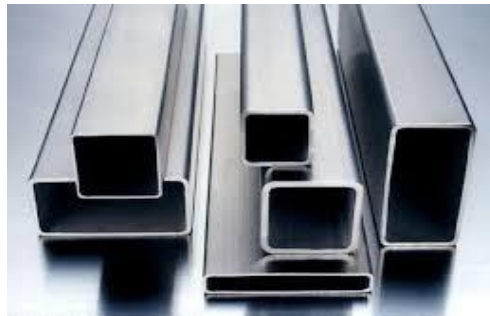
Gambar 2.5 Besi Hollow

Besi hollow adalah besi yang berbentuk pipa kotak. Besi hollow biasanya terbuat dari besi galvanis, stainless atau besi baja. Sering digunakan dalam konstruksi bangunan, terutama dalam konstruksi aksesoris seperti pagar, railing, atap kanopi dan pintu gerbang. Besi hollow juga dapat digunakan untuk support pada pemasangan plafon. Dan sekarang besi hollow kita gunakan sebagai kerangka dudukan dan meja pada alat potong gerinda tangan untuk memotong besi semi otomatis pengukuran 1-500mm.