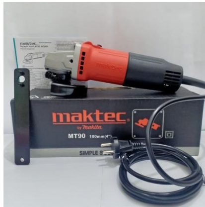
Gambar 2.4 Mesin Gerinda Tangan

Mesin gerinda tangan merupakan mesin yang berfungsi untuk menggerinda benda kerja. Menggerinda dapat bertujuan untuk mengasah benda kerja seperti pisau dan pahat, atau dapat juga bertujuan untuk membentuk benda kerja seperti merapikan hasil pemotongan, merapikan hasil las, membentuk lengkungan pada benda kerja yang bersudut, menyiapkan permukaan benda kerja untuk dilas, dan lain-lain. Mesin Gerinda didesain untuk dapat menghasilkan kecepatan sekitar 11000–15000 rpm. Dengan kecepatan tersebut batu gerinda, yang merupakan komposisi aluminium oksida dengan kekasaran serta kekerasan yang sesuai, dapat menggerus permukaan logam sehingga menghasilkan bentuk yang diinginkan. Dengan kecepatan tersebut juga, mesin gerinda dapat digunakan untuk memotong benda logam dengan menggunakan batu gerinda yang dikhususkan untuk memotong.