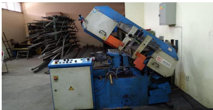
Gambar 2.1 Mesin Gergaji Pita

Mesin gergaji pita merupakan sebuah mesin yang mempunyai spesifikasi tersendiri, dikarenakan kemampuan mesin ini dapat memotong profil- profil lengkung tak tentu. Mesin gergaji pita ini dilengkapi dengan mata gergaji yang berbentuk pita melingkar. Mata gergaji ini diregang diantara dua rol . Rol penggerak dihubungkan dengan power suplai motor listrik . Motor listrik ini menghasilkan putaran dan sekaligus memutar mata gergaji yang berbentuk pita. Kedua rol ini mempunyai jarak yang berguna untuk tempat berlangsungnya proses pemotongan.