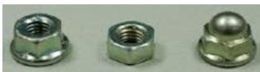
Gambar 2.7 Mur

Bentuk mur yang paling umum saat ini adalah segi enam (heksagonal), dengan alasan yang sama seperti kepala baut: enam sisi simetris memberikan granularitas sudut yang baik untuk alat untuk memutar mur (meskipun berada di tempat-tempat sempit), tetapi sudut yang lebih banyak (dan lebih kecil) akan rentan oleh aus. Hanya perlu seperenam putaran untuk mendapatkan sisi hexagon berikutnya dan genggamannya alat untuk memutar juga optimal. Namun, poligon dengan lebih dari enam sisi tidak dapat memberikan genggamannya (cengkraman) yang diperlukan dan poligon dengan kurang dari enam sisi membutuhkan lebih banyak waktu untuk melakukan rotasi penuh. Bentuk khusus lainnya ada untuk kebutuhan tertentu.