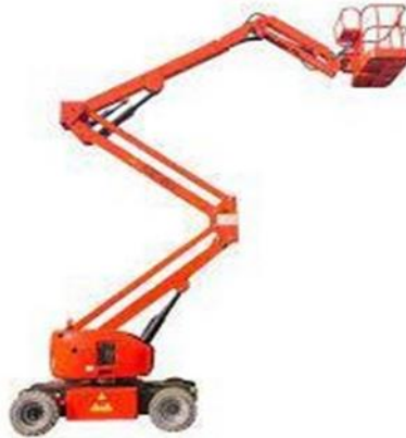
Gambar 2.7 Tangga Elektrik [5]