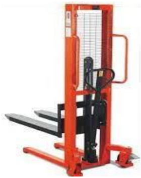
Gambar 2.3 Hand Stacker [5]

Merupakan alat angkut yang di desain untuk memindahkan sekaligus mampu mengikat beban dengan kapasitas dan tinggi angkat tertentu. Menggunakan sistem kerja hydroulis yang dioperasikan dengan cara pemompaan pada saat menaik turunkan beban di atas pallet kayu maupun plastik. Desain fork / garpu yang adjustable (dapat diatur kelebarannya) membuat alat angkut ini dapat dengan mudah digunakan untuk semua jenis pallet. Penggunaannya pun dinilai sangat efisien untuk memudahkan operator dalam hal pemindahan dan penataan barang di pabrik.