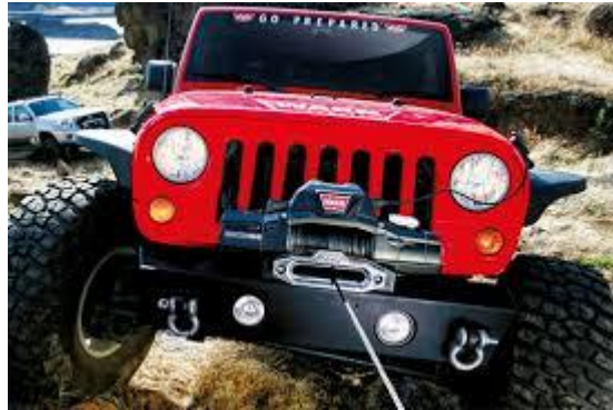
Gambar 2.8 Winch Mobil [1]