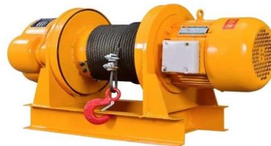
Gambar 2.9 Electric Winch [1]

Electric winch menggunakan baterai kendaraan, steker, atau sumber listrik lain untuk menghidupkannya. Ini dapat menguras baterai, jadi fungsi winch ini lebih cocok untuk penggunaan cepat, sesekali, dan ringan. Keuntungan winch elektrik adalah lebih mudah dipasang daripada jenis lainnya, dan dapat dengan mudah dipindahkan dari satu kendaraan ke kendaraan lain.