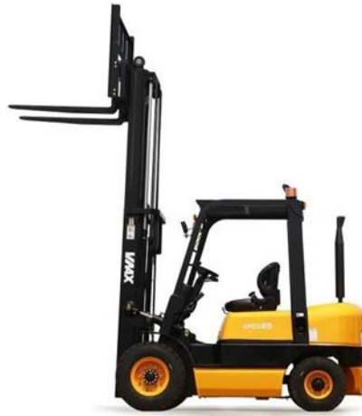
Gambar 2.1 Forklift [5]