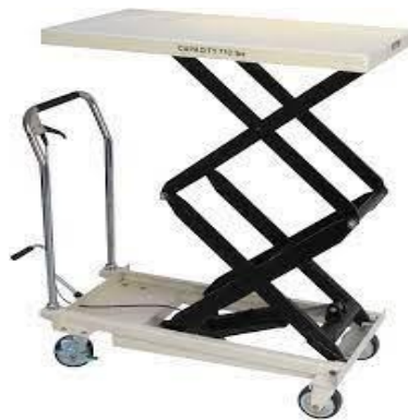
Gambar 2.6 Lift Table [5]

Merupakan alat yang dioperasikan dengan cara pemompaan pada hidroulis dalam mengakat beban. Dilengkapi roda pada setiap sisinya sehingga memungkinkan beban tersebut dapat dipindahkan dengan mudah dari satu area ke area yang lain. Sangat cocok difungsikan untuk semua jenis beban karena memiliki permukaan meja rata dan lebar. Seperti halnya pabrik pembuatan peralatan, lift table sangat membantu dalam proses perakitan maupun proses produksi lainnya. Banyak yang menjadikan alat ini pilihan sebagai alat pembantu yang efisien dalam kegiatan operasional perusahaan khususnya pada bagian produksi.