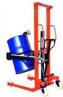
Gambar 2.5 Drum Handler [5]

Merupakan alat angkat khusus yang difungsikan dalam kegiatan penataan drum. Memiliki daya cengkram kuat sehingga mampu mengangkat dan memindahkan drum baja maupun plastik berkapasitas besar menggunakan tenaga hydraolis. Dapat dioperasikan dengan mudah dan aman serta drum mampu diputar 360 derajat untuk membantu pada saat proses penuangan. Sangat cocok pada penggunaan outdoor maupun indor dengan roda kemudi yang fleksibel untuk dipindahkan penggunaan alat ini dinilai sangat diperlukan dalam kegiatan operasional perusahaan untuk menunjang produktivitas kerja maupun meringankan beban operator. Memiliki kapasitas beban maksimal 350 kg dan memiliki daya angkat hingga 1,4 meter.