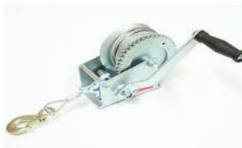
Gambar 2.11 Hand Winch [1]

Hand Winch yang dioperasikan dengan tangan adalah derek manual yang bekerja baik untuk aplikasi yang lebih ringan. Winch jenis ini memiliki pegangan sebagai lengan tuas dan poros laras sebagai tumpuan. Fungsi winch ini cocok untuk bekerja dalam kondisi basah dan lokasi di mana tidak ada stop kontak, seperti area hutan.