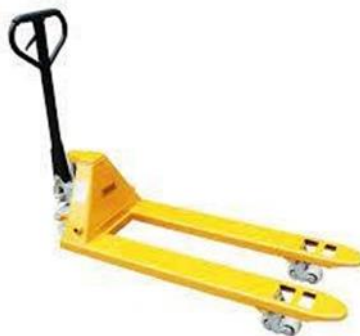
Gambar 2.2 Hand Pallet [5]

Merupakan alat yang di desain sebagai alat angkut untuk memindahkan beban diatas pallet kapasitas berat tertentu untuk meringankan pekerjaan operator dan menghemat waktu pada saat memindahkan satu barang dari satu area ke area lain. Alat ini menggunakan tenaga hydroulis dengan sistem pompa untuk menaikkan maupun menurunkan beban yang diangkat. Alat ini sangat cocok digunakan di pabrik, pergudangan, toko dll. Kapasitas beban yang dapat di angkut hand pallet berkisar antara 1 ton hingga 5 ton, dengan daya angkat 20 cm hingga 80 cm.