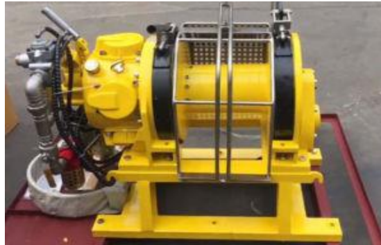
Gambar 2.10 Air Winch [1]