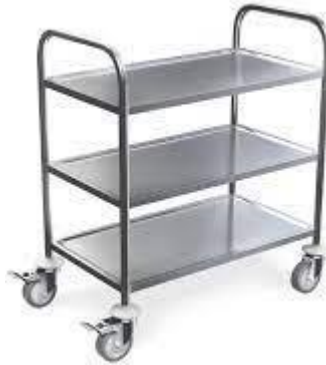
Gambar 2.4 Trolley [5]