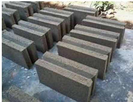
Gambar 2.1 Batako

Diiringi dengan majunya perkembangan zaman, begitu banyak inovasi yang muncul sebagai bahan alternatif untuk konstruksi bahan bangunan, salah satunya yaitu batako. Material ini biasanya digunakan dalam pembuatan dinding bangunan. Dengan campuran perbandingan semen dan agregat halus dalam suatu cetakan khusus pada batako. Material ini tersusun atas air, pasir dan semen portland atau tanpa tambahan lainnya Addictive . Dalam proses pembuatannya, material ini biasa sebagai bahan bangunan atau pemasangan dinding dan dicetak sesuai perencanaan, material ini biasa disebut dengan Conblock (Concrete block) atau bata cetak beton.