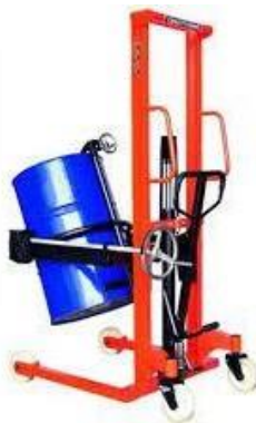
Gambar 2.5 Drum Handler [5]

Merupakan alat angkat khusus yang difungsikan dalam kegiatan penataan drum. Memiliki daya cengkram kuat sehingga mampu mengangkat dan memindahkan drum baja maupun plastik berkapasitas besar menggunakan tenaga hydraolis. Dapat dioperasikan dengan mudah dan aman serta drum mampu diputar 360 derajat untuk membantu pada saat proses penuangan. Sangat cocok pada penggunaan outdoor maupun indor dengan roda kemudi yang fleksibel untuk dipindahkan penggunaan alat ini dinilai sangat diperlukan dalam kegiatan operasional perusahaan untuk menunjang produktivitas kerja maupun meringankan beban operator. Memiliki kapasitas beban maksimal 350 kg dan memiliki daya angkat hingga 1,4 meter.