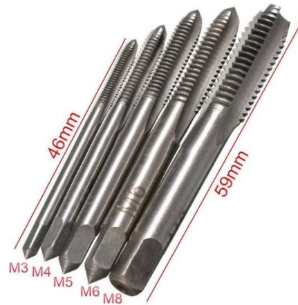
Gambar 2.2 Jenis-jenis Tap (Chammick.Blogspot.com, 2022)

kemudian dilanjutkan dengan tap no. 2 ( Tapper tap ) untuk pembentukan ulir, sedangkan tap no. 3 ( Botoming tap ) dipergunakan untuk penyelesaian.