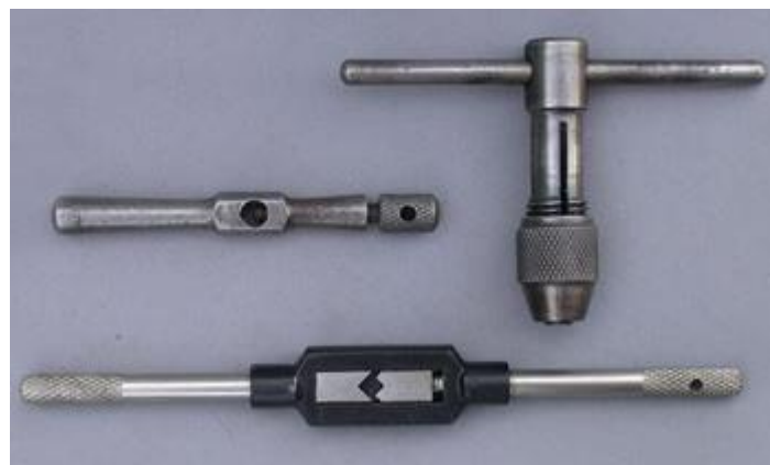
Gambar 2.3 Alat Pemegang Tap