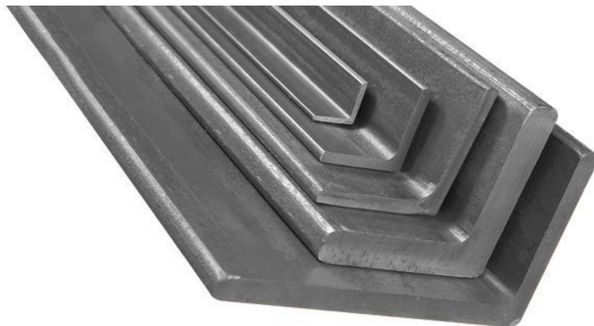
Gambar 2.6 Besi Siku (Wira.co.id, 2022)

Ketebalannya berada pada kisaran 1,4mm hingga 3,4mm. Akan berbeda-beda, tergantung pada ukuran tiap penampang yang ada. Misalnya, besi siku dengan ukuran penampang 40x40 mm akan mempunyai beberapa ketebalan seperti 3,4mm, 3,2mm, 2,4mm, 2,2mm.