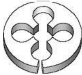
Gambar 2.4 Snei Belah Bulat