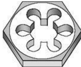
Gambar 2.5 Snei Segi Enam