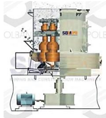
Gambar 2.2 Grinding Mill

Grinding Mill merupakan suatu unit operasi yang dirancang untuk memecah bahan padat menjadi potongan-potongan yang lebih kecil. Grinding mill banyak digunakan dalam metalurgi, bahan bangunan, bahan kimia, pertambangan mineral.