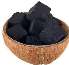
Gambar 2.4 Arang

Arang adalah residu hitam yang terdiri dari karbon tidak murni. Arang dihasilkan dengan menghilangkan kandungan air dan komponen volatile dari hewan atau tumbuhan. Pada umumnya, arang dihasilkan dengan memanaskan kayu, tulang ataupun benda lainnya. Arang memiliki ciri ringan, berwarna hitam, mudah hancur dan menyerupai batu bara. Arang terdiri dari 85% sampai 98% karbon dan sisanya adalah abu dan bahan kimia lainnya.