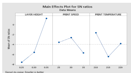
Gambar 2 Main Effect Plot for SN Ratios Dimensional Accuration

Nilai konfirmasi menggunakan metode taguchi dengan aplikasi minitab 19 dapat di lihat pada tabel