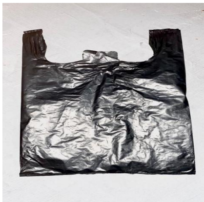
Gambar 2.1. Plastik Polyethylen

Polietilen atau yang dikenal dengan rumus kimia ( C_2H_4 ) adalah bahan plastik yang fleksibel. Bahan plastik PE pun tidak terbatas pada penggunaan kemasan snack saja melainkan juga bisa digunakan untuk mengemas produk yang memiliki bahan cair. Namun, walaupun begitu perlu juga memperhatikan produk yang di kemas tidak bermuatan lemak dan minyak berlebih. Plastik Polietilena terkenal dengan bahan yang sangat lentur sehingga sangat bagus dan cocok untuk produsen yang ingin menjaga produk tidak bocor. Menurut Wheaton dan Lawson (1985) bahwa bahan kemasan plastik yang paling banyak digunakan adalah plastik PE karena mempunyai harga relatif murah, mempunyai komposisi kimia yang baik, resisten terhadap lemak dan minyak, tidak menimbulkan reaksi kimia terhadap makanan, mempunyai kekuatan yang baik dan cukup kuat untuk melindungi produk dari perlakuan yang kasar, selama penyimpanan, mempunyai daya serap yang rendah terhadap uap air, serta tersedia dalam berbagai bentuk. Plastik PE juga menjadi bahan yang sangat kuat terhadap asam, deterjen, alkohol. Plastik PE cukup kuat dan bisa dapat andalkan di suhu rendah karena bahan PE mampu menyimpan bahan pada suhu pembekuan hingga -50\text{ }^{\circ}\text{C} .