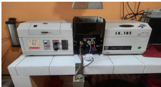
Gambar 2.4 Atomic Absorption Spectrophotometer

AAS ( Atomic absorption Spectrometry ) adalah suatu metode analisis yang didasarkan pada proses penyerapan energi radiasi oleh atom-atom yang berbeda pada tingkat energi dasar ( ground state ). Penyerapan tersebut mengakibatkan elektron dalam kulit atom tereksitasi ke tingkat energi yang lebih tinggi. Namun, elektron tersebut akan kembali ke tingkat energi dasar dan mengeluarkan energi yang berbentuk radiasi. Atom bebas berinteraksi dengan berbagai bentuk energi seperti energi panas, energi elektromagnetik, energi kimia, dan energi listrik. Interaksi ini menimbulkan proses-proses dalam atom bebas yang menghasilkan absorpsi dan emisi (pancaran) radiasi dan panas. Radiasi yang dipancarkan bersifat khas karena mempunyai karakteristik panjang gelombang untuk setiap atom bebas (Yusyniyah, 2017). Cara kerja AAS ini berdasarkan atas penguapan larutan sampel, kemudian logam yang terkandung didalamnya diubah menjadi atom bebas. Atom tersebut mengabsorpsi radiasi dari sumber cahaya yang dipancarkan dari lampu katoda ( Hollow Cathode Lamp ) yang mengandung unsur yang akan ditentukan. Banyaknya penyerapan radiasi kemudian diukur pada panjang gelombang tertentu menurut jenis logamnya (Yusyniyah, 2017).