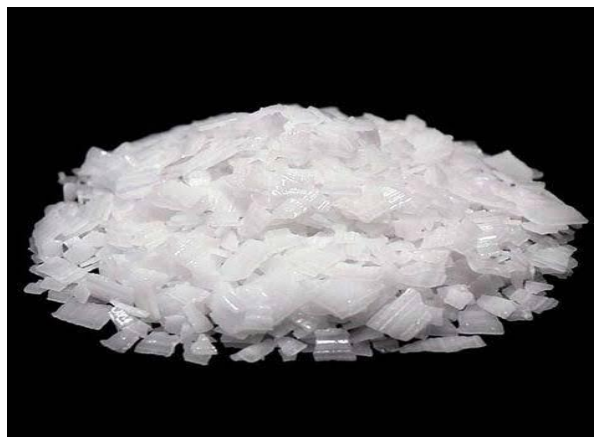
Gambar 2.3 KOH (Marlina, 2016)