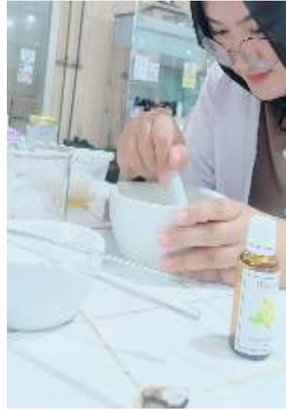
Pelarutan Carbomer 940 dengan air yang bersuhu 100 °C sampai menjadi bening transparan