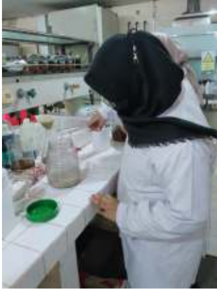
Proses Maserasi Ekstrak Sarang Burung Walet