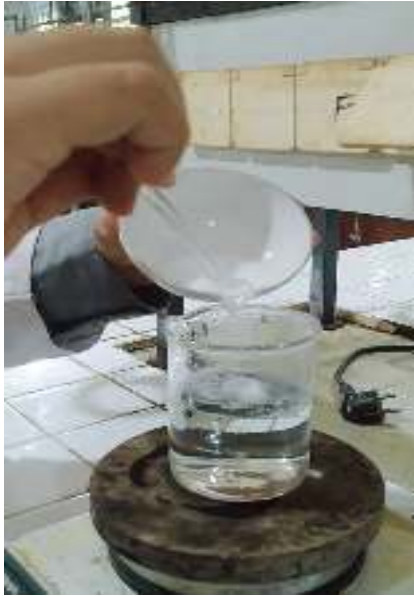
Mengembangkan PVA ke dalam air yang bersuhu 100°C