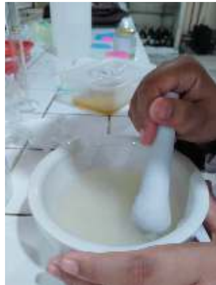
Proses pencampuran semua bahan