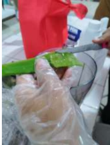
pembersihan dan pemisahan kulit dan daging lidah buaya