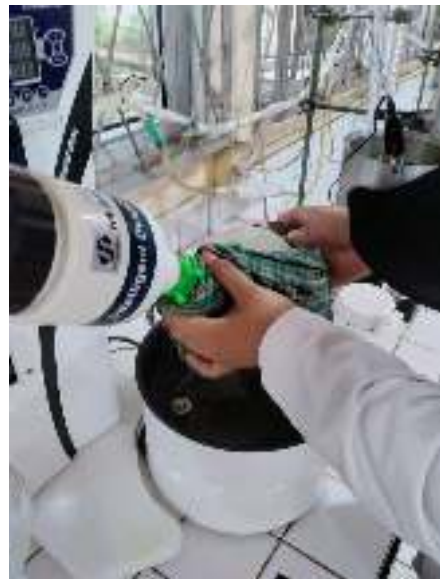
Hasil ekstrak yang sudah Disaring kemudia dipekatkan dengan Evaporator.