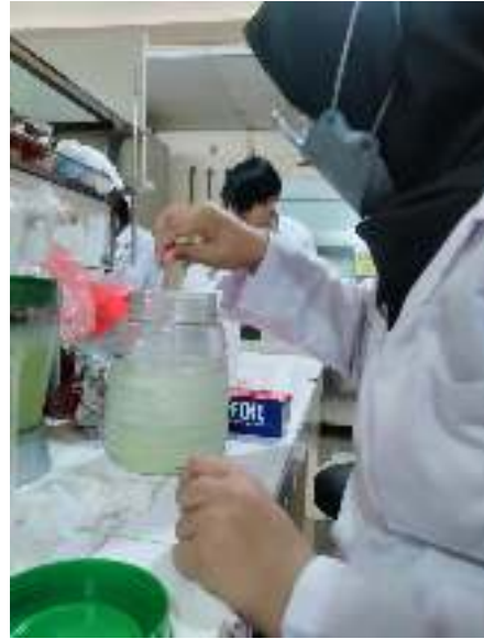
Proses Maserasi Lidah Buaya