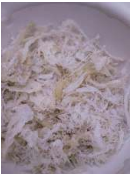
Sarang Burung walet yang telah di Keringkan