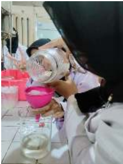
Proses penyaringan Sarang burung walet dan Lidah Buaya