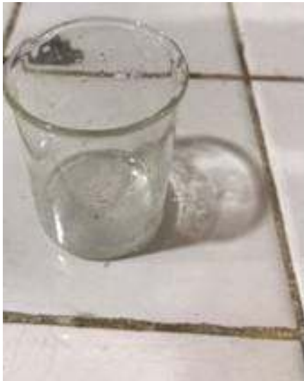
Metil paraben yang telah di Larutkan dengan Propilen Glikol