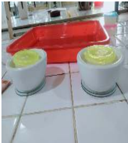
Proses uji daya lekat