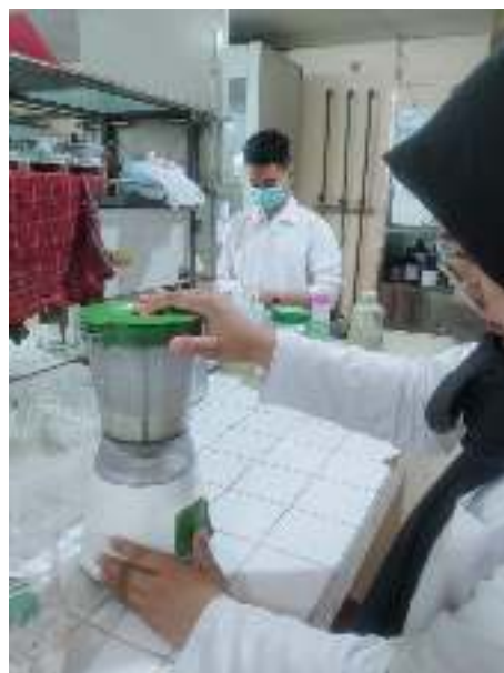
Penghalusan sarang burung walet