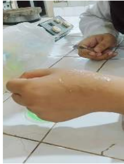
Proses uji waktu mengering