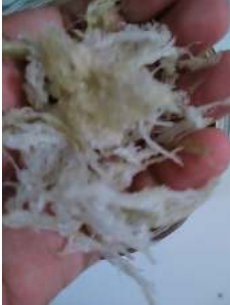
Sarang Walet yang telah di bersihkan