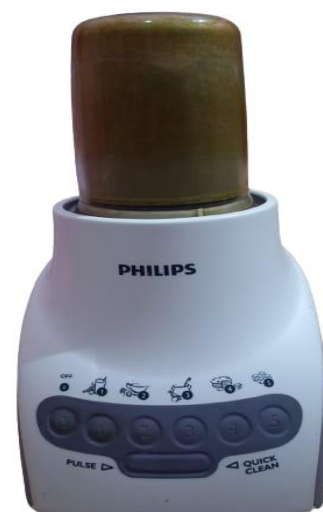
Penghalusan Daun Nanas