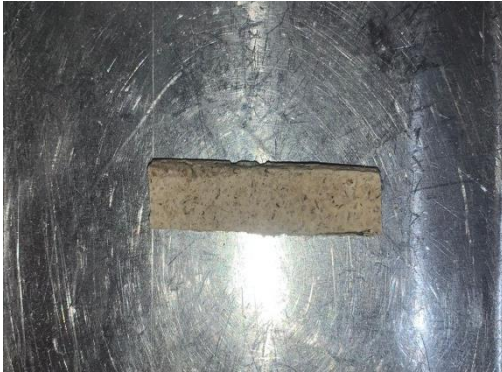
Analisa Kuat Tekan