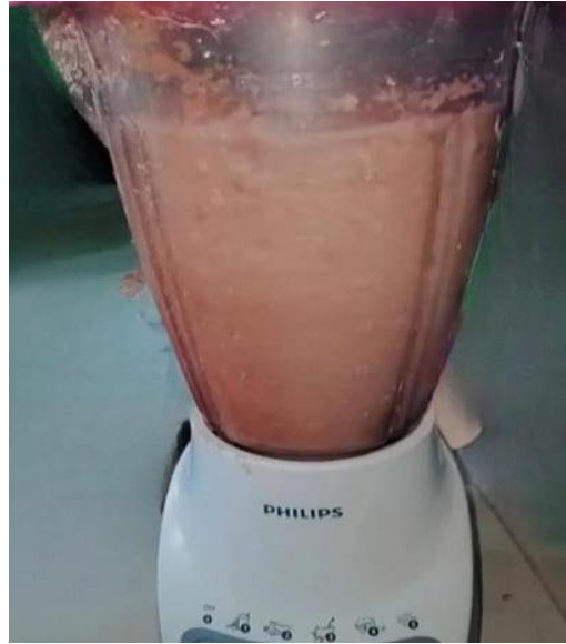
Penghalusan Umbi Ganyong