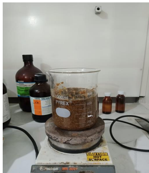
Perendaman Serat Selulosa Daun Nanas