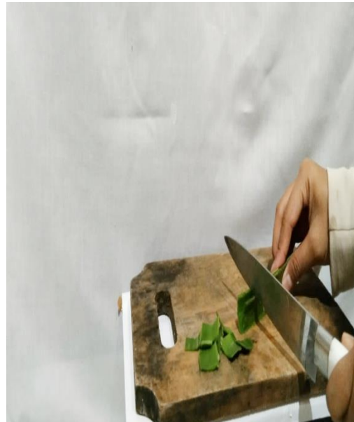
Pemotongan Daun Nanas