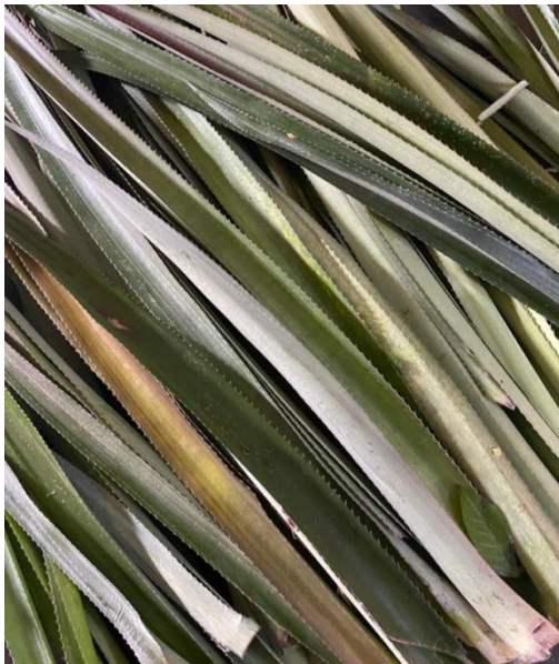
Pencucian Daun Nanas