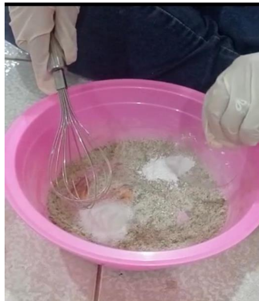
Pencampuran Bahan Kering