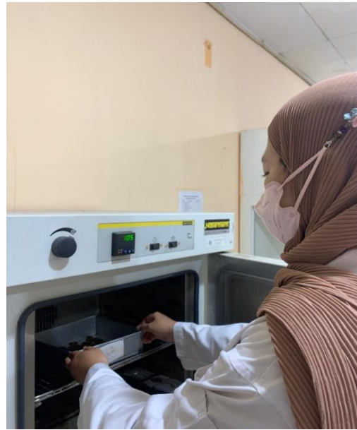
Pengovenan Serat Selulosa Daun Nanas