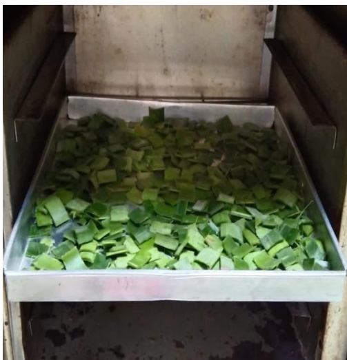
Pengovenan Daun Nanas