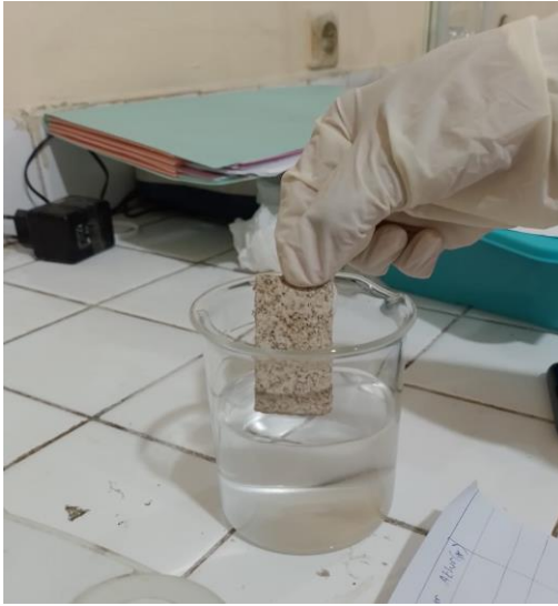
Analisa Daya Serap Air