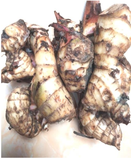
Bahan Baku Umbi Ganyong