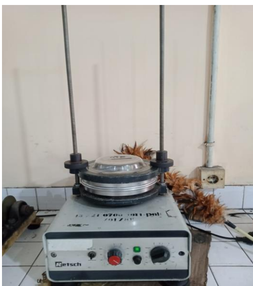
Pengayakan Serat Selulosa Daun Nanas