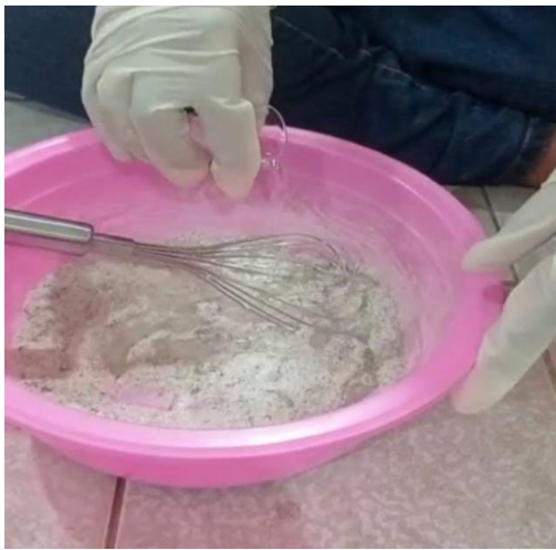
Penambahan Bahan Basah