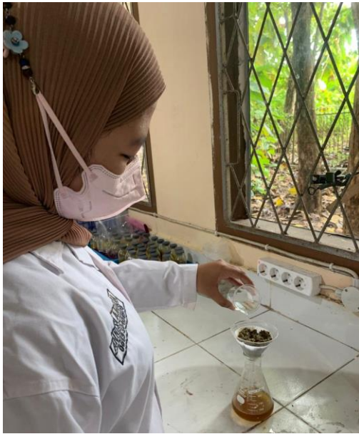
Pencucian Serat Selulosa Daun Nanas