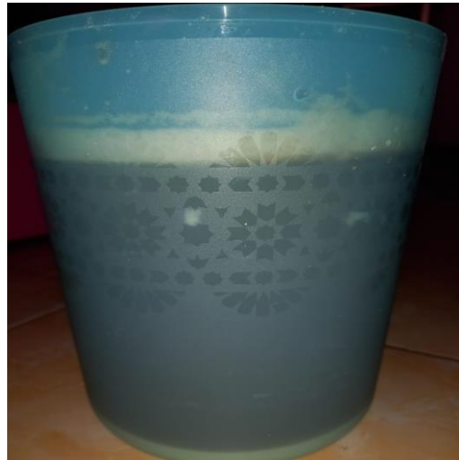
Pengendapan pati umbi ganyong