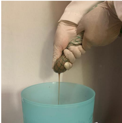
Penyaringan untuk mendapatkan suspensi pati