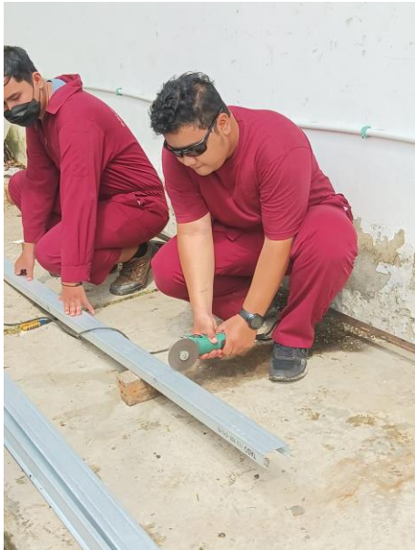
Gambar 7. Pemotongan Tiang Taso