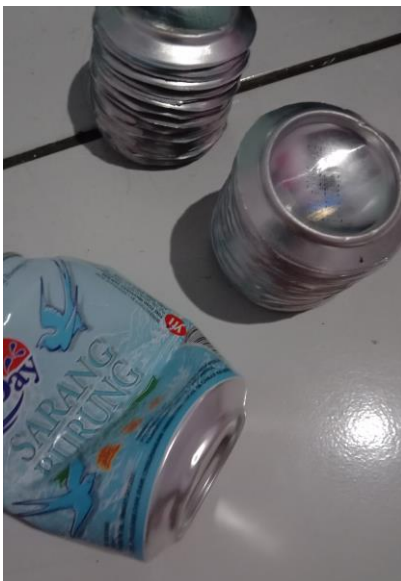
Gambar 3. Buntut Kaleng sebagai Plat Absorber