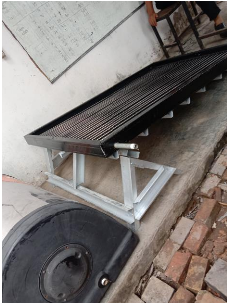
Gambar 19. Solar Water Heater Tampak samping