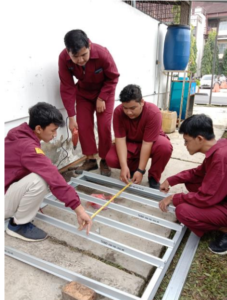
Gambar 8. Merangkai Potongan Taso untuk Membentuk Frame Panel