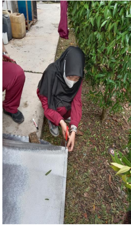
Gambar 10. Pemotongan Material Taso untuk Alas Panel