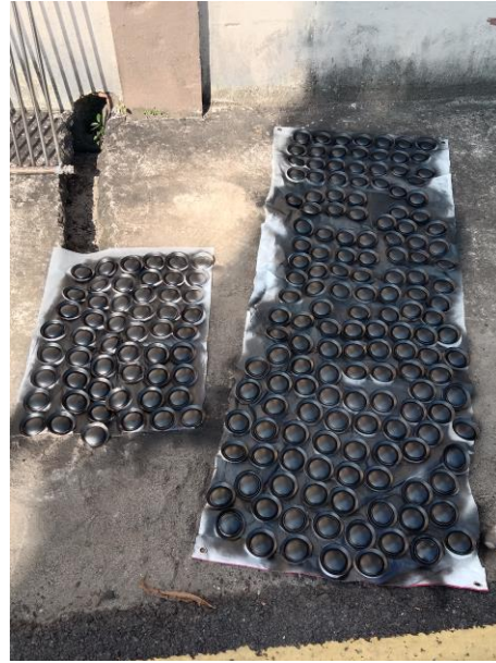
Gambar 6. Penjemuran Buntut Kaleng Setelah di cat