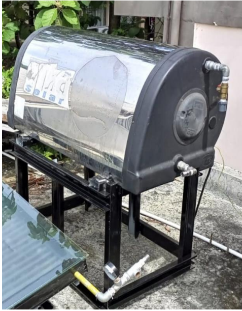
Gambar 17. Tangki Penyimpanan Air (Aluminium)