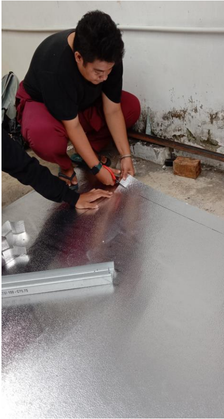
Gambar 9. Pemotongan Taso