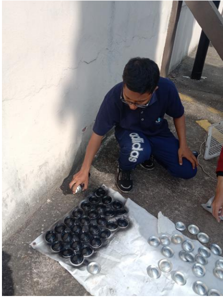
Gambar 5. Pengecatan Buntut Kaleng