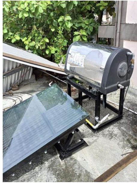
Gambar 22. Serangkaian Alat Solar Water Heater