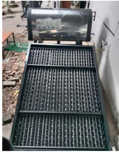
Gambar 18. Solar Water Heater Tampak Atas