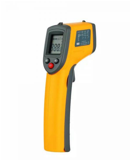
Gambar 25. Thermo gun