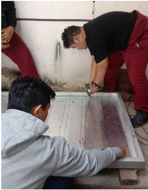
Gambar 13. Pembuatan Panel