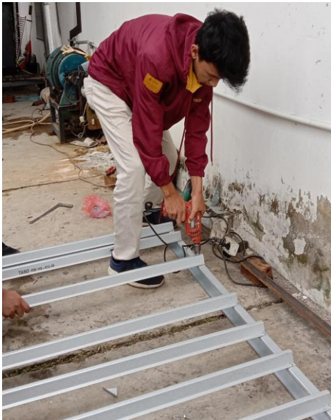
Gambar 11. Pembuatan Frame Panel