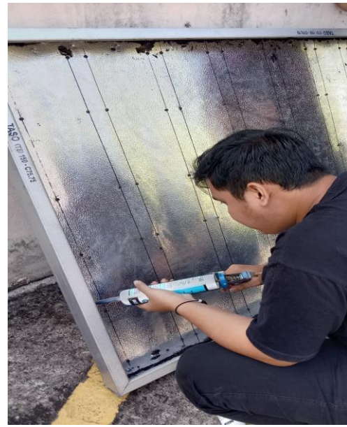
Gambar 14. Pemberian Lem Silicon Pada Lubang Agar Panel Kedap Udara