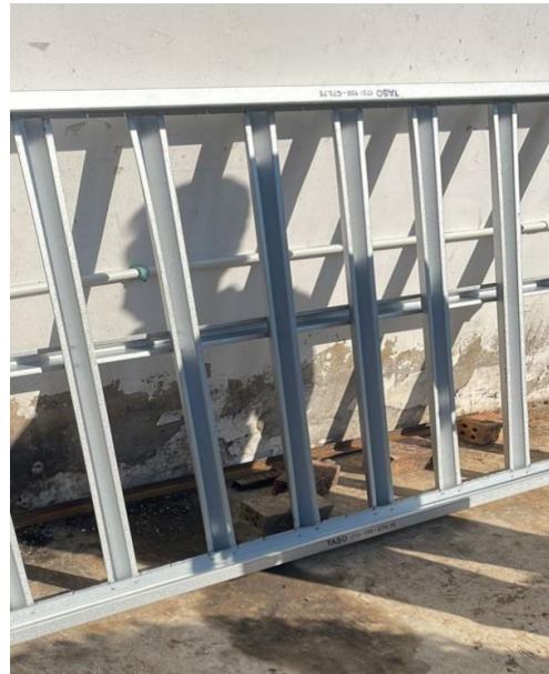
Gambar 12. Frame Panel