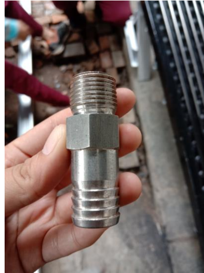
Gambar 2. Doublenaple