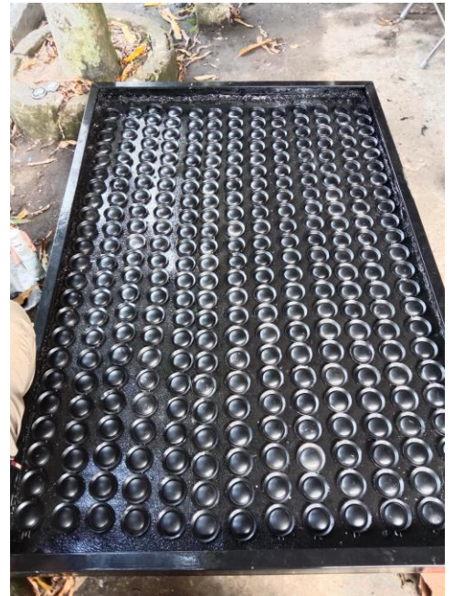
Gambar 16. Pemasangan Buntut Kaleng Pada Panel