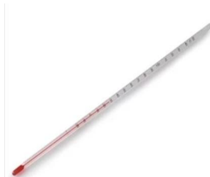
Gambar 24. Termometer