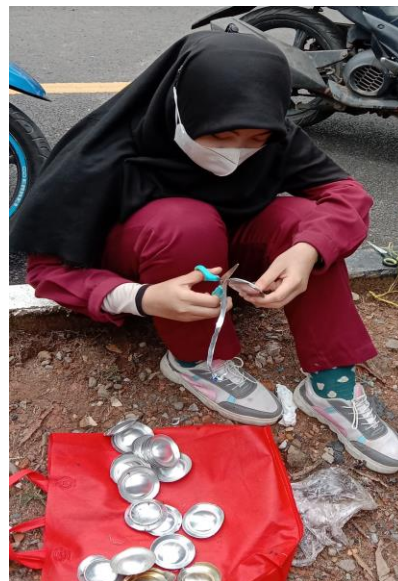
Gambar 4. Pemotongan Buntut Kaleng