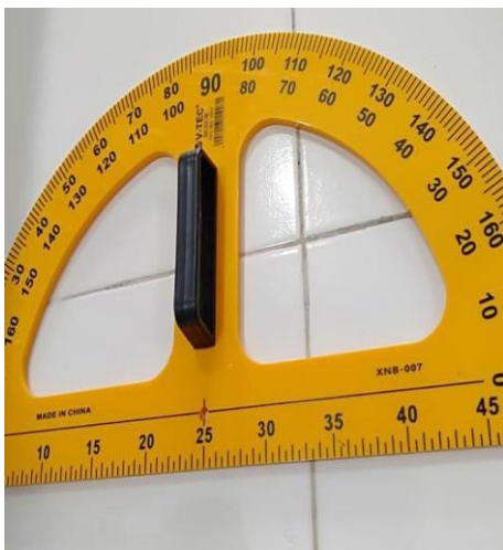
Gambar 23. Busur Derajat