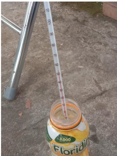
Gambar 27. Pengukuran Air Suhu Output