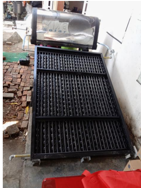
Gambar 20. Solar Water Heater