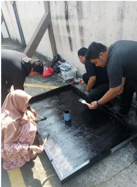
Gambar 15. Pemberian Cat Warna Hitam Pada Panel