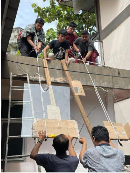
Gambar 21. Penaikkan Kaca Penutup Panel Ke Tempat Percobaan