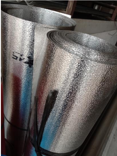
Gambar 1. Material Taso sebagai Alas Panel