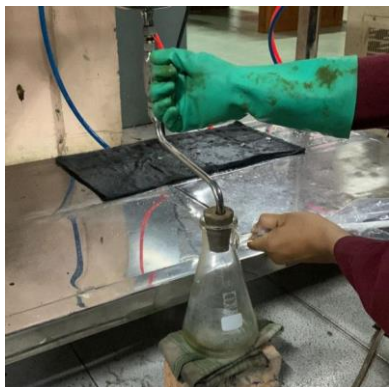
Mengeluarkan Produk Green Diesel