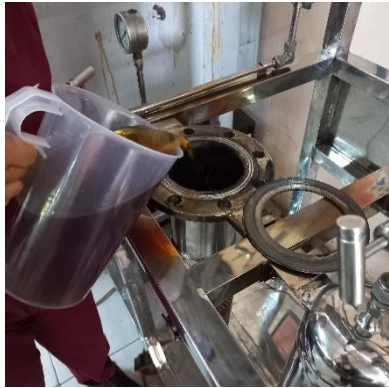
Memasukkan Minyak Jelantah