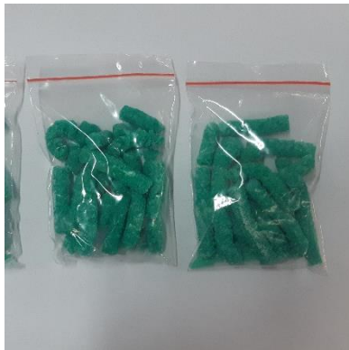
Katalis Ni-Zn/ \gamma Al 2 O 3