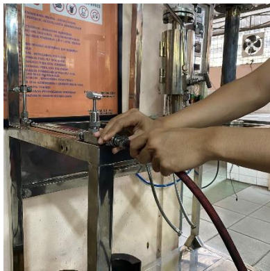
Menginjeksi Gas Hidrogen