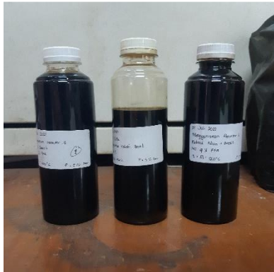
Bahan Bakar Green Diesel