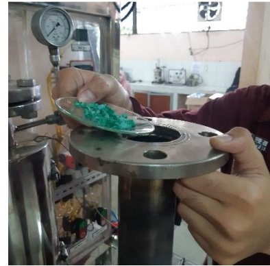
Memasukkan Katalis \text{Ni-Zn}/\gamma \text{Al}_2\text{O}_3