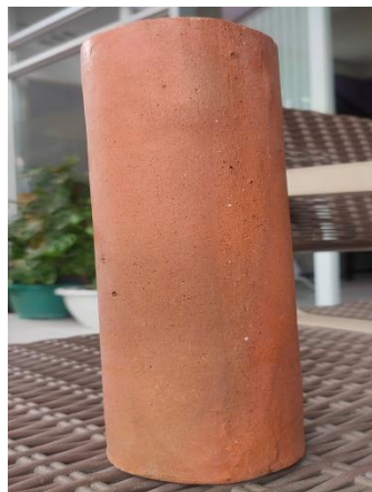
Gambar 2.3 Membran Keramik

Membran keramik terbuat dari kumpulan logam (aluminium, titanium, silicium atau zirconium) dan nonlogam (oxide, nitride, atau carbide). Pengaplikasian membran keramik yaitu untuk memisahkan suatu zat dari kumpulannya berdasarkan perbedaan ukuran partikel.