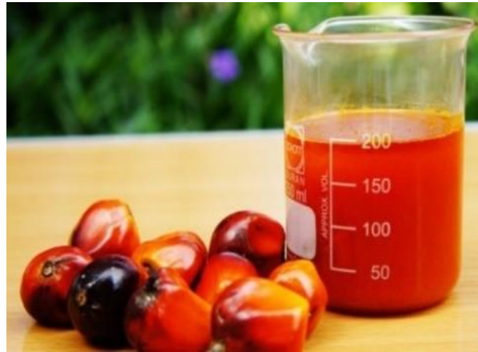
Gambar 2.1 Crude Palm Oil (CPO)

Minyak sawit sudah banyak digunakan sebagai bahan baku produk pangan dan non pangan. Produk pangan lebih dititik beratkan pada titik leleh dan kandungan lemak padat sedangkan produk non pangan pada komposisi asam lemak. Minyak sawit dapat digunakan untuk kebutuhan bahan pangan, industri kosmetik, industri kimia, dan industri pakan ternak. Mutu CPO yang dihasilkan dari pabrik dapat dipengaruhi oleh kualitas panen, pengangkutan, proses pengolahan dan penimbunan atau penyimpanan. Untuk aplikasi menjadi beberapa produk, minyak sawit harus memiliki mutu yang baik dan disesuaikan dengan karakteristiknya.