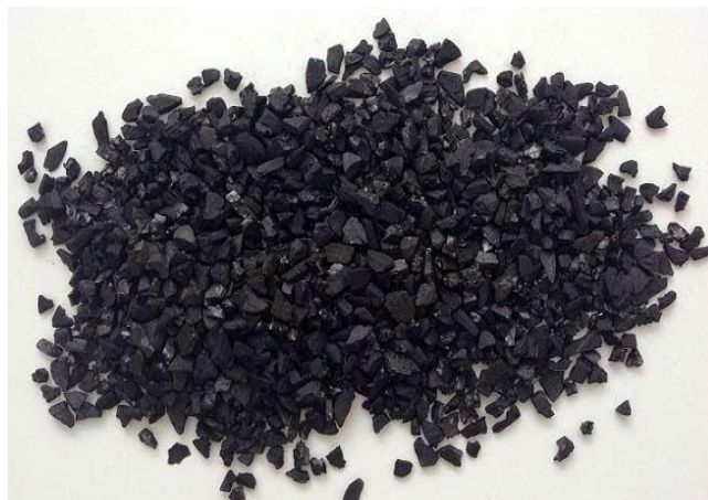
Gambar 2.4 Arang Aktif