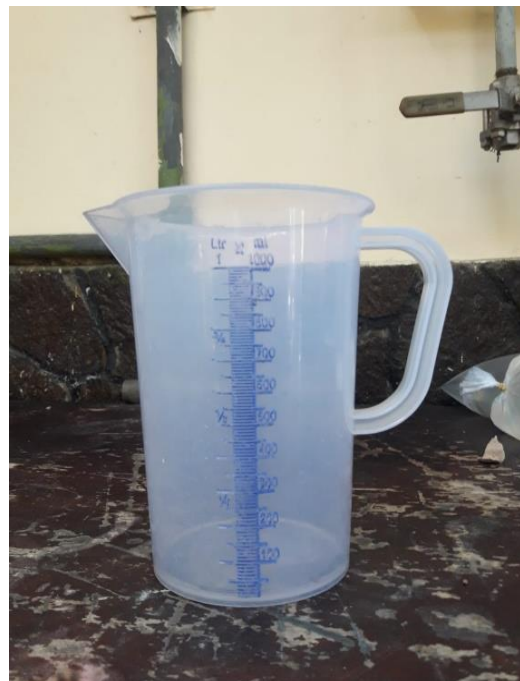
Gambar L3.4 Gelas Ukur