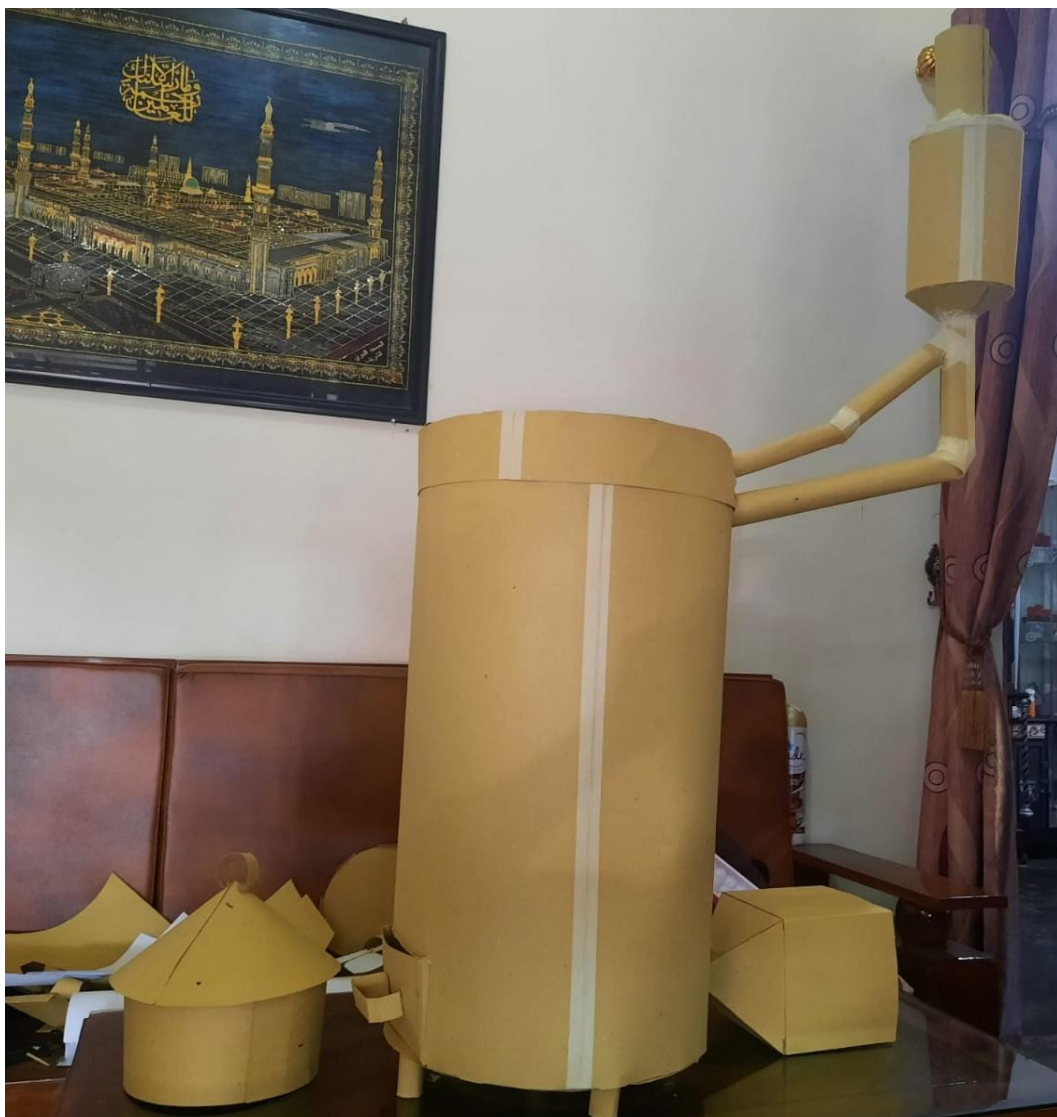
Gambar L3.14 Maket Kompor Biobriket