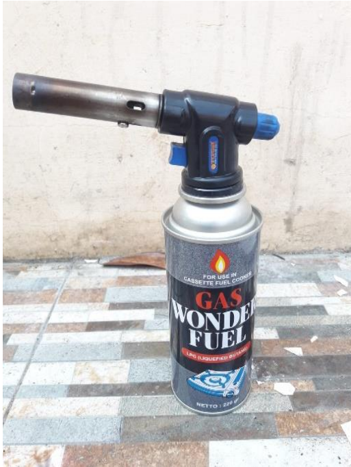
Gambar L3.1 Gas Torch