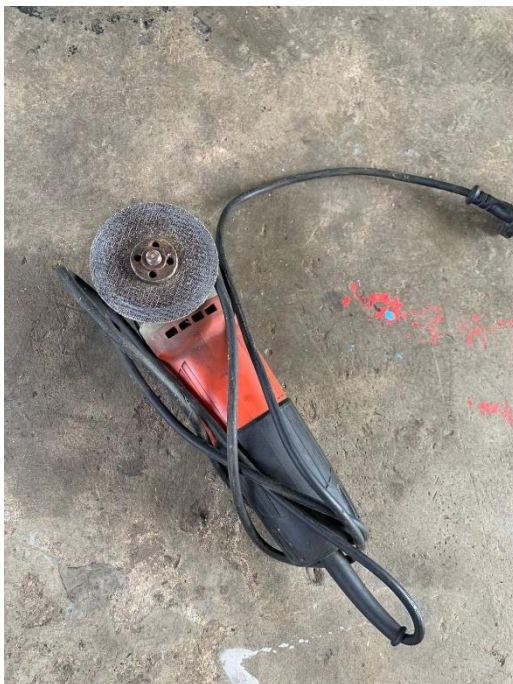
Gambar L3.19 Mesin Gerinda