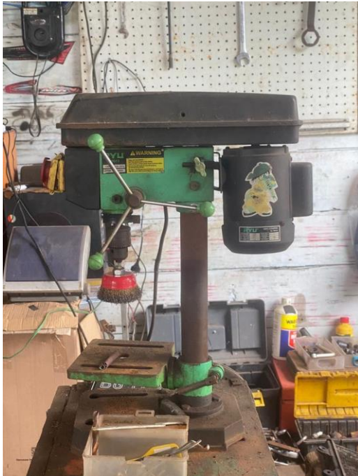
Gambar L3.17 Mesin Bor Duduk