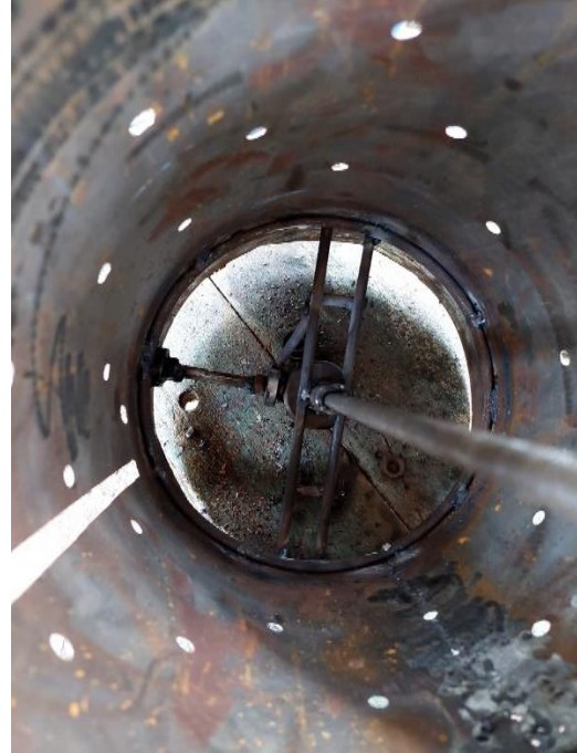
Gambar L3.10 Bagian Dalam Gasifier