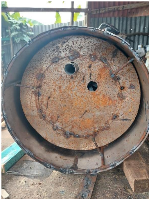
Gambar L3.7 Tampak Bawah Kompor