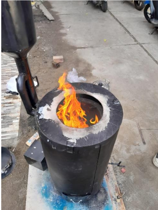
Gambar L3.9 Nyala Api