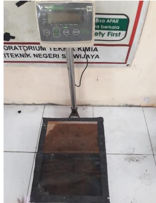
Gambar L3.6 Timbangan