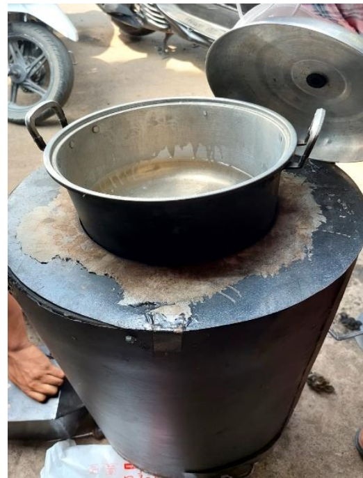
Gambar L3.8 Saat Uji WBT