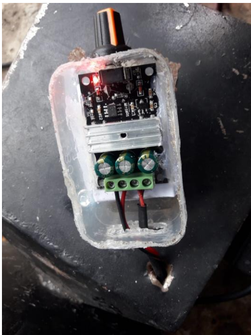
Gambar L3.23 Dimmer