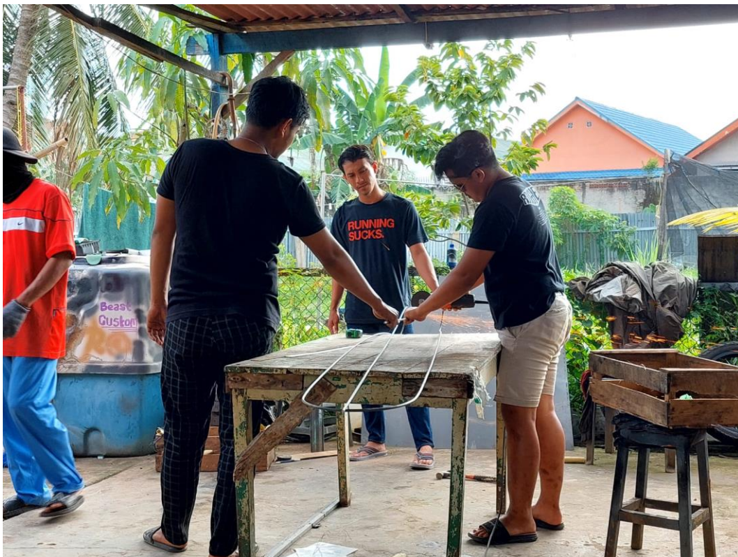
Gambar L3.28 Pada Saat Pabrikasi 4