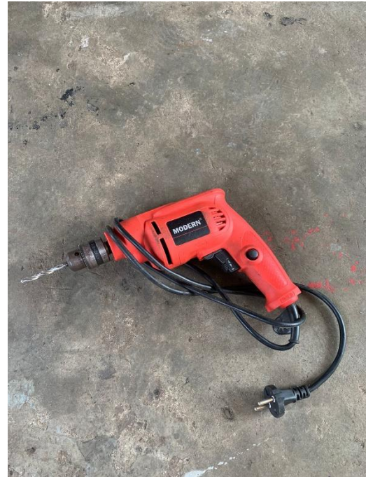
Gambar L3.18 Mesin Bor