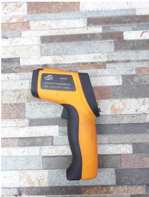
Gambar L3.3 Thermogun