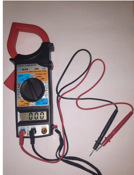
Gambar L3.22 Multitester Digital