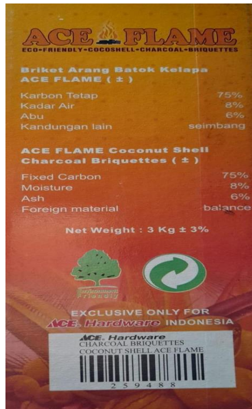
Gambar L3.15 Kandungan Biobriket Tempurung Kelapa