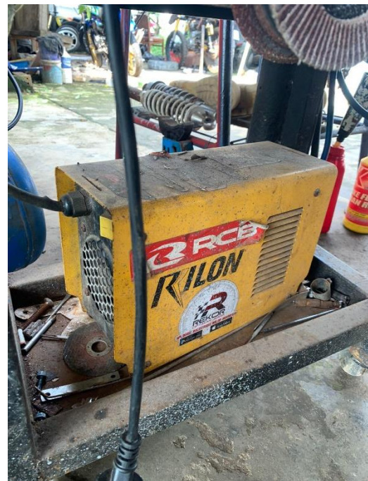
Gambar L3.20 Mesin Las Listrik