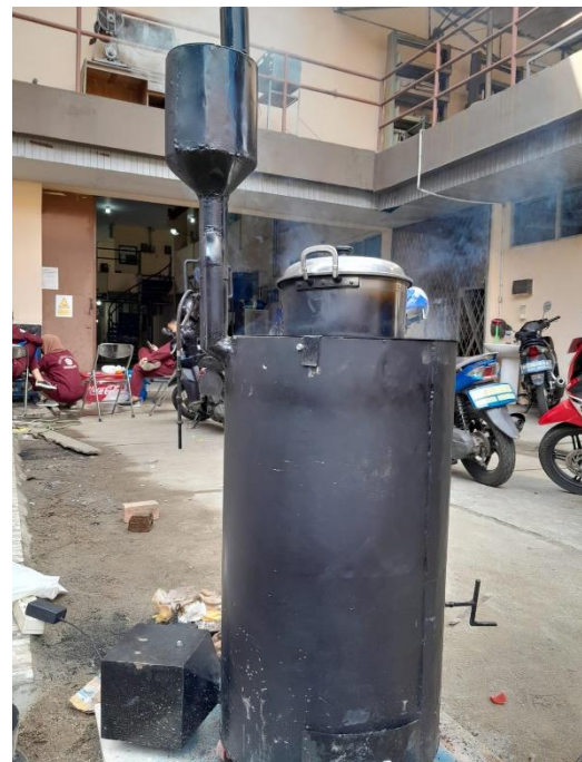
Gambar L3.32 Uji WBT