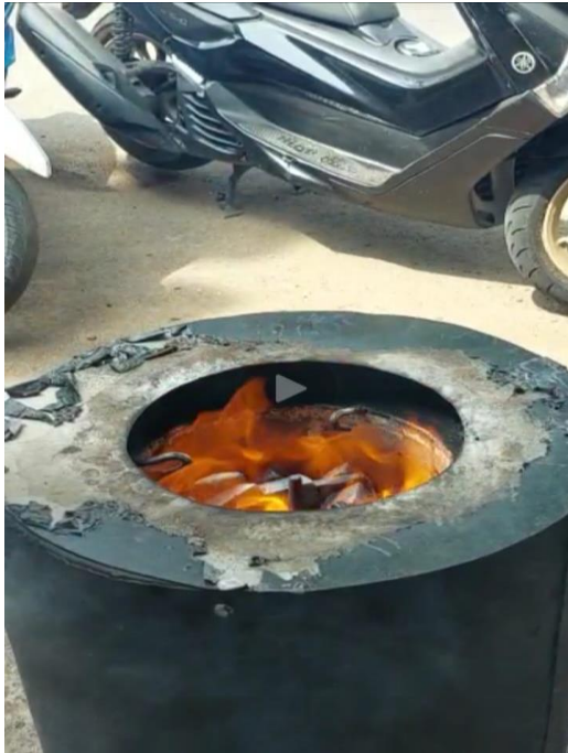
Gambar L3.33 Running Alat