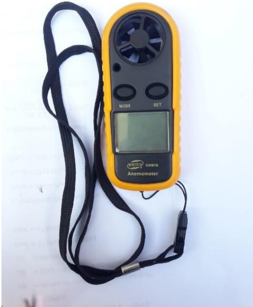
Gambar L3.5 Anemometer