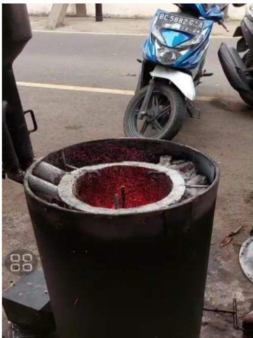
Gambar L3.35 Running Alat