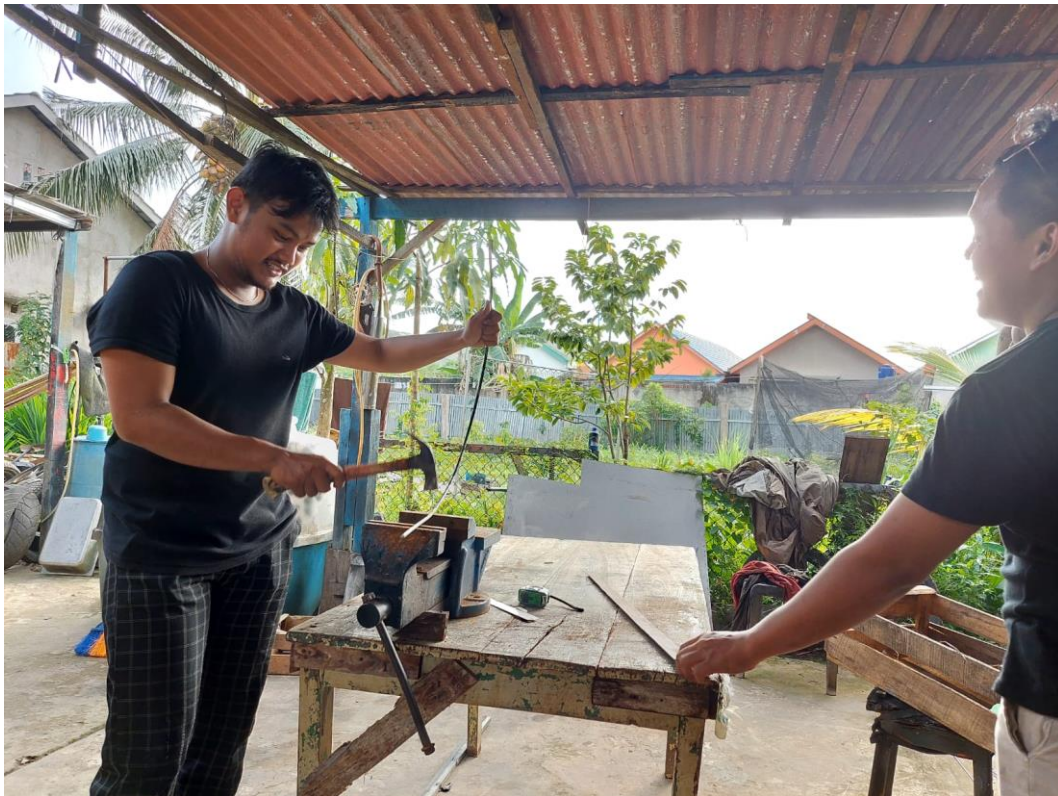
Gambar L3.27 Pada Saat Pabrikasi 3