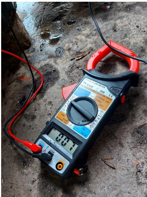
Gambar L3.31 Pengecekan Tegangan