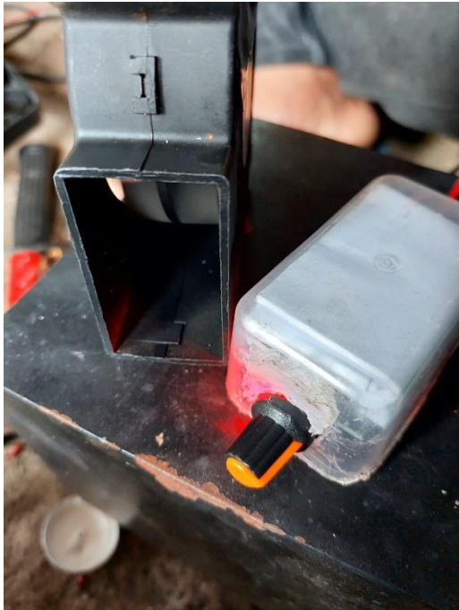
Gambar L3.29 Uji Coba Dimmer