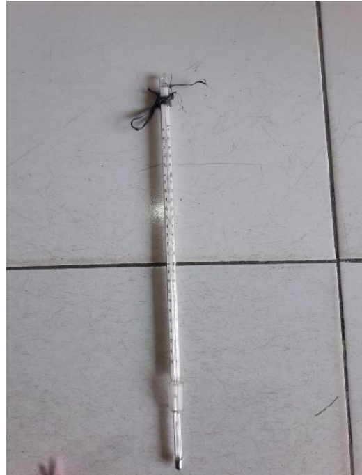
Gambar L3.2 Termometer Air Raksa