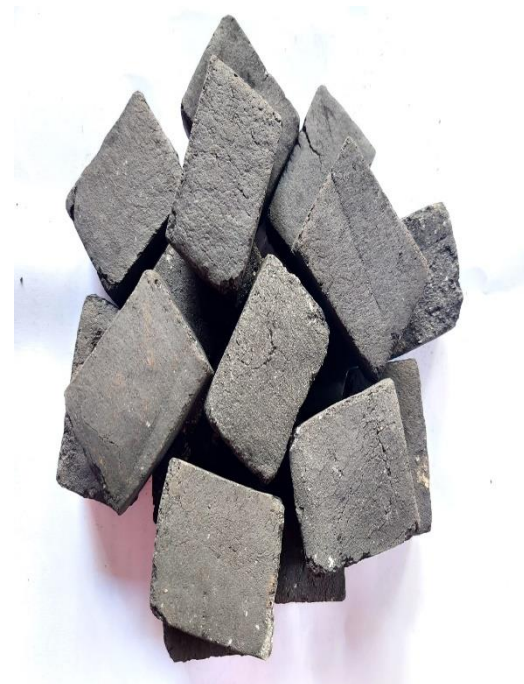
Gambar L3.24 Briket Tempurung Kelapa