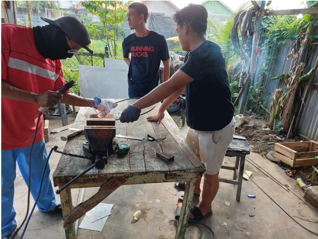
Gambar L3.25 Pada Saat Pabrikasi 1