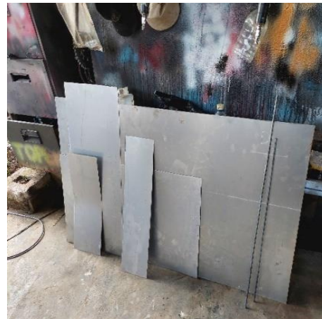
Gambar L3.12 Plat Besi