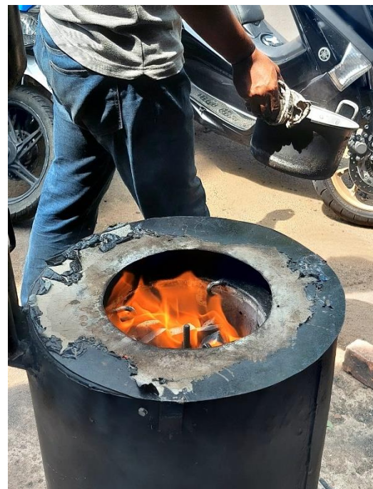
Gambar L3.36 Running Alat