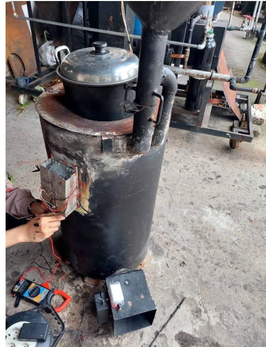
Gambar L3.30 Uji Coba TEG