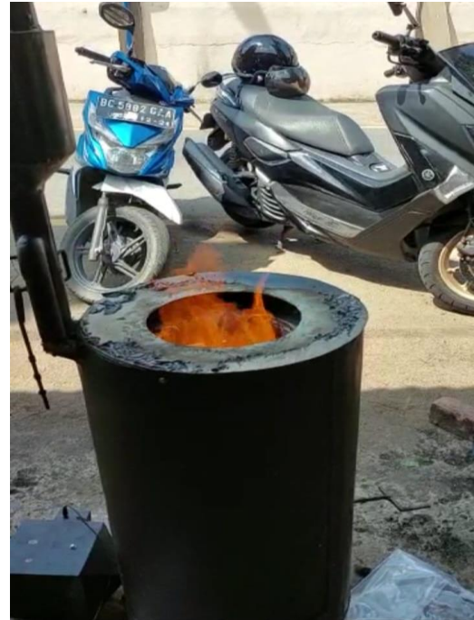
Gambar L3.34 Running Alat