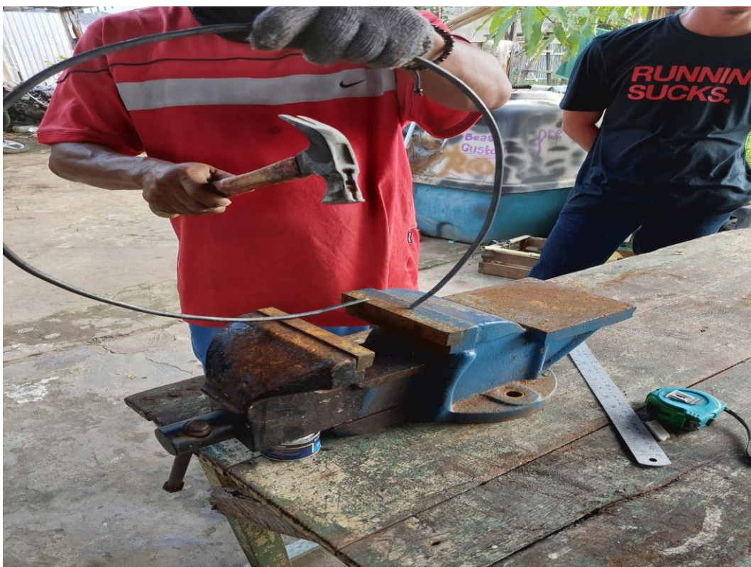
Gambar L3.26 Pada Saat Pabrikasi 2