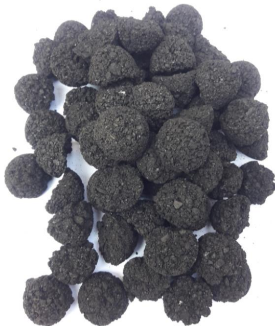
Gambar L3.16 Biobriket Tempurung Kelapa