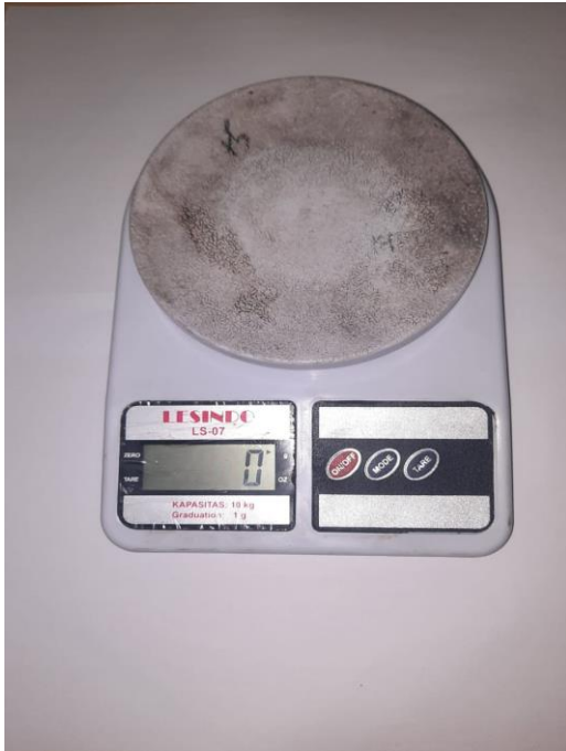
Gambar L3.21 Timbangan