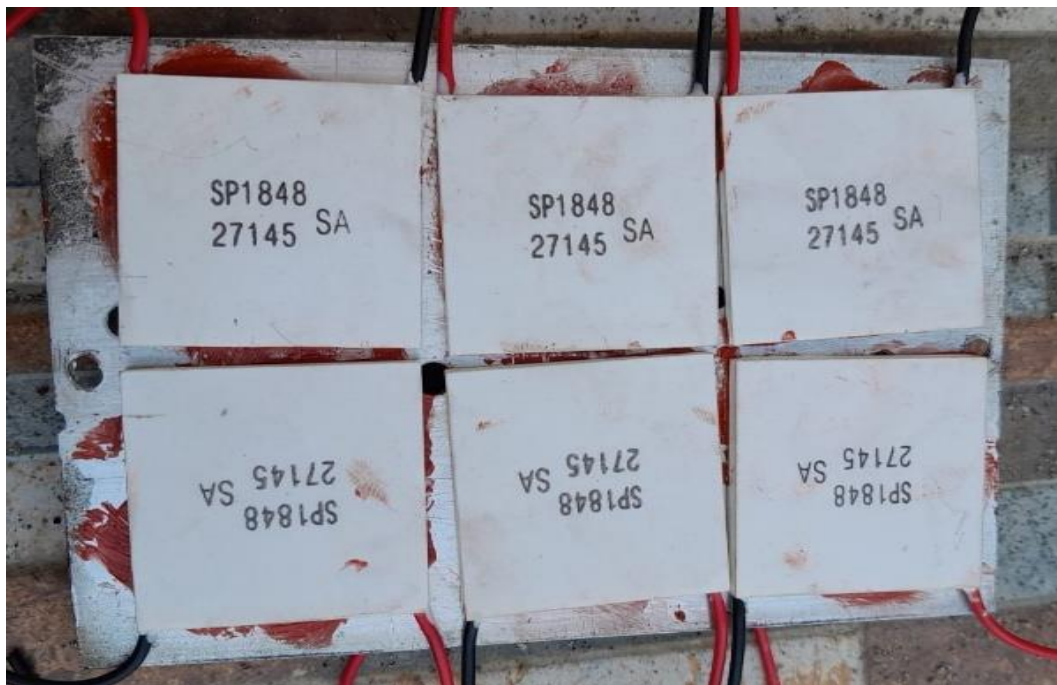
Gambar L3.13 Rangkaian TEG Disusun Seri