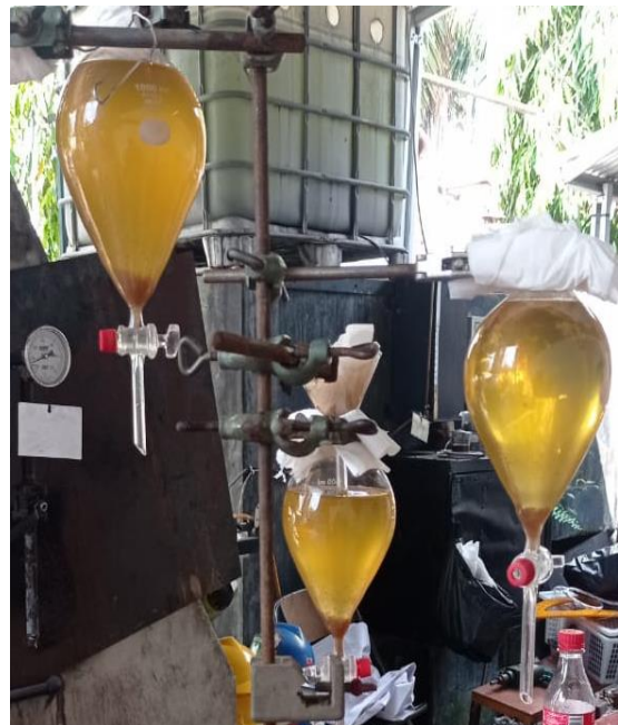
Gambar L3.4 Proses Running Alat dan Pengambilan Data