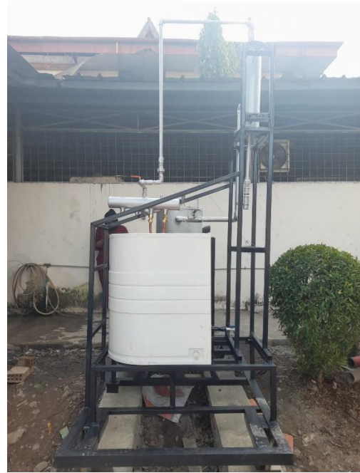
Gambar L3.3 Modifikasi Separator dan Kondenser