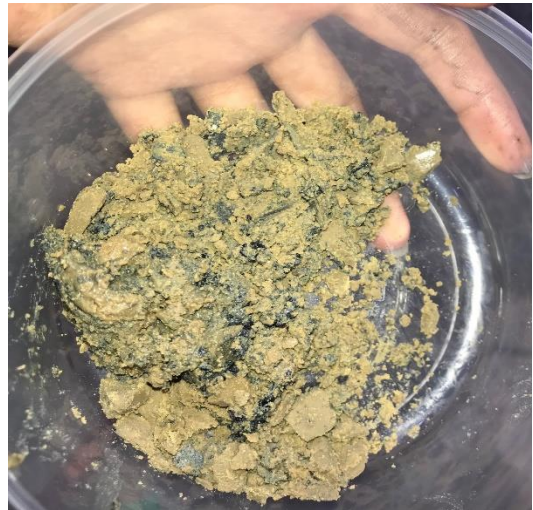
Gambar L3.5 Residu Reaktor Dan Lilin yang terbentuk