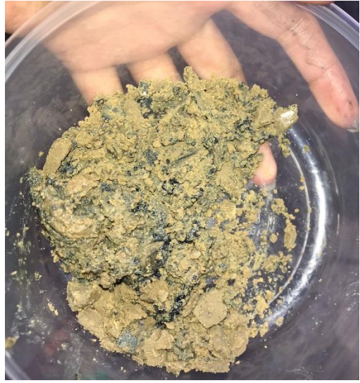
Gambar L3.5 Residu dan lilin yang terbentuk