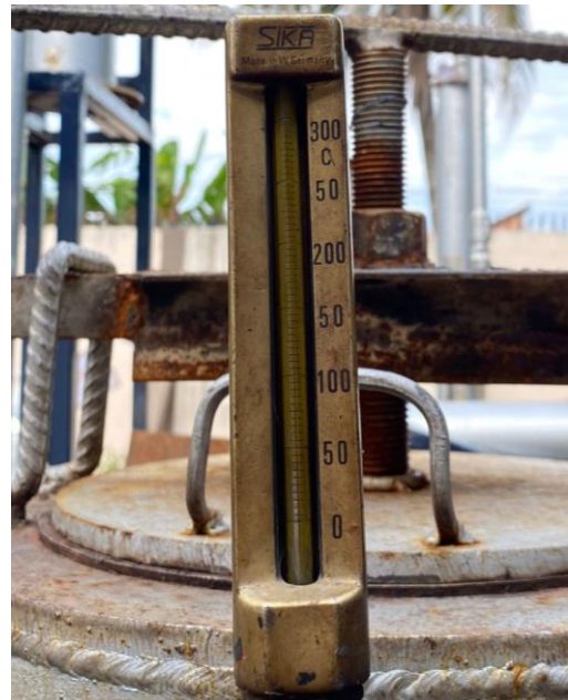
Gambar L3.8 Pressure Gauge dan Temperatur Indikator