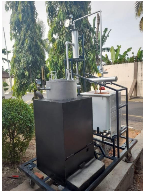
Gambar L3.3 Separator dan Kondenser