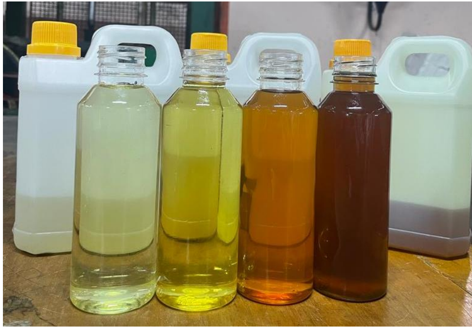
Gambar L4.1 Produk Bahan Bakar Cair