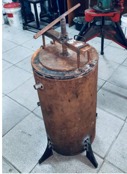
Gambar L3.1 Modifikasi Reaktor Pirolisis