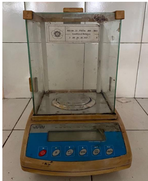
Gambar L4.0 Corong pemisah dan Neraca Analitik