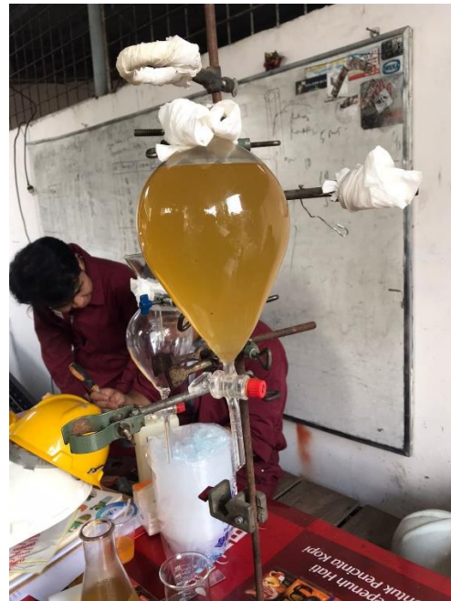
Gambar L3.4 Proses Running Alat dan Pengambilan Data