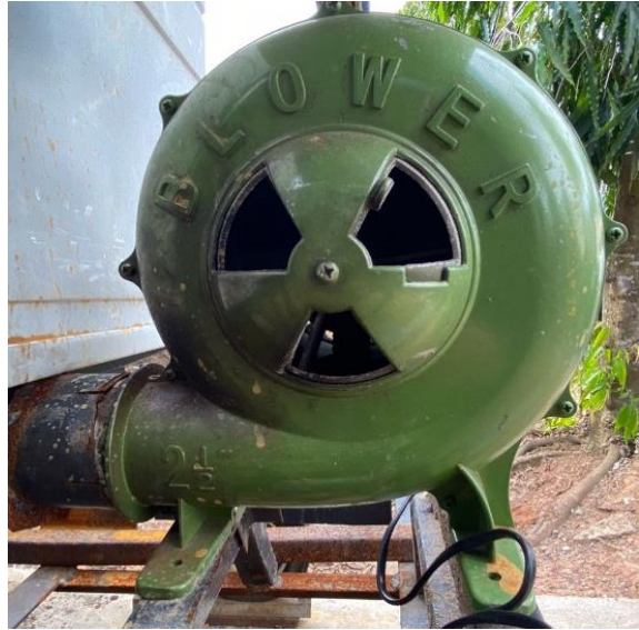
Gambar L3.7 Separator dan Blower