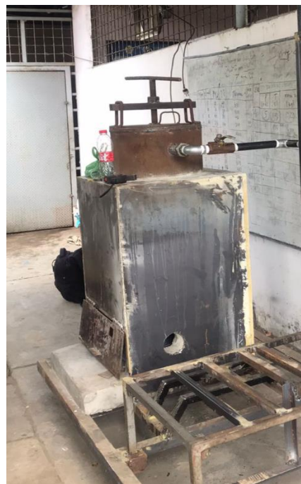
Gambar L3.2 Modifikasi Ruang Bakar