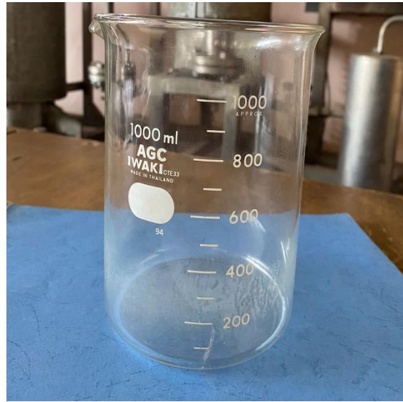
Gambar L3.9 Erlenmeyer dan Gelas kimia