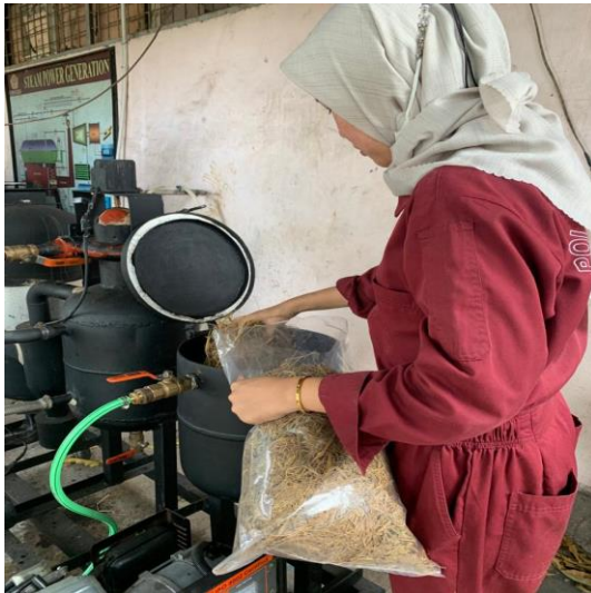
Gambar L.3.6 Memasukkan jerami pada tangki filter