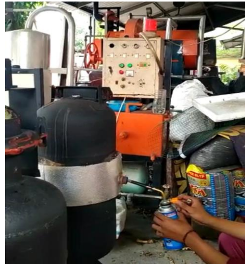
Gambar L.3.7 Menyulut api