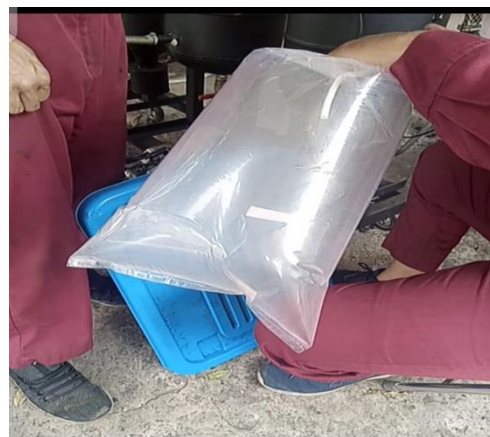
Gambar L.3.9 Pengambilan Syngas