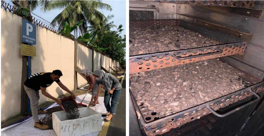
Gambar L.3.1 Preparasi Bahan Baku