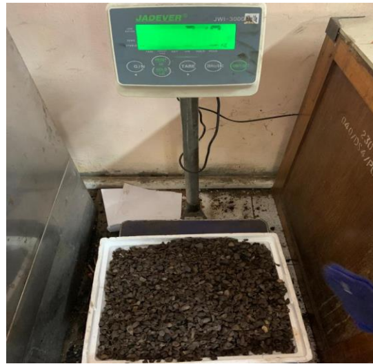
Gambar L.3.3 Menimbang Bahan Baku