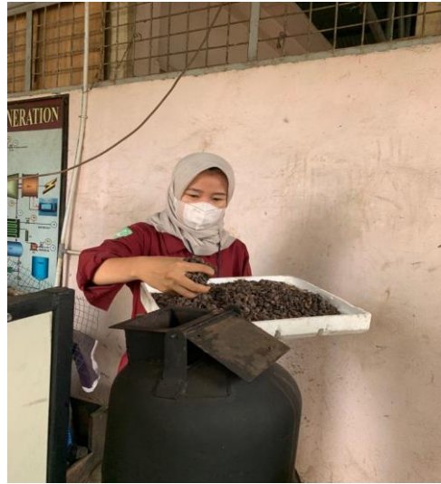
Gambar L.3.5 Memasukkan bahan baku kedalam Reaktor