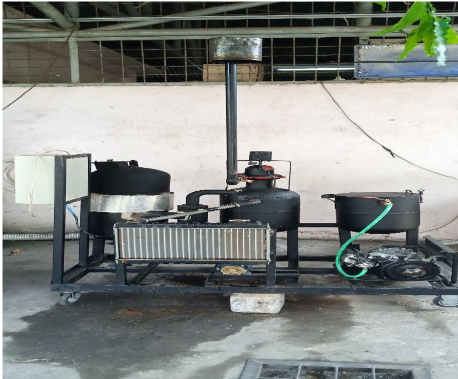
Gambar L.3.12 Alat Gasifikasi Sistem Crossdraft Gasifier