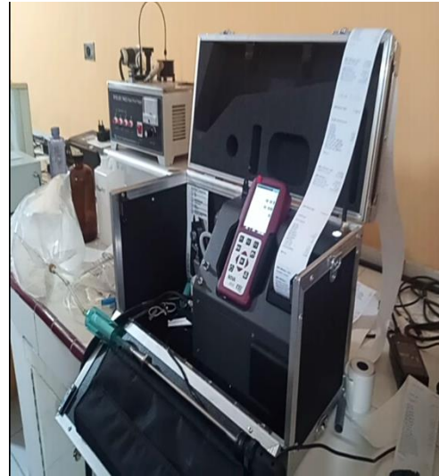
Gambar L.3.11 Analisis Syngas