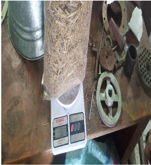
Gambar L.3.4 Menimbang Filter