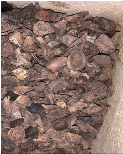
Gambar L.3.2 Cangkang kelapa Sawit