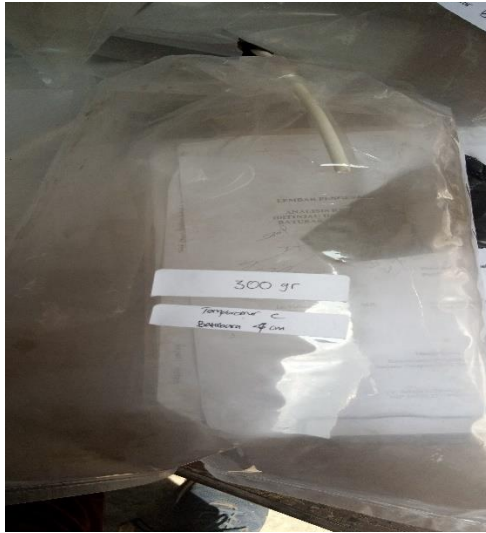
Gambar L.3.10 Hasil Syngas