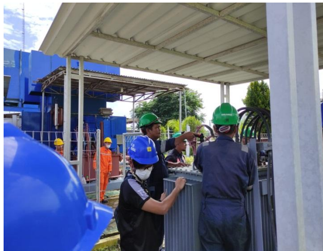
Gambar Saat Pemeliharaan dan Perawatan dilakukan di Transformator PS Unit 3