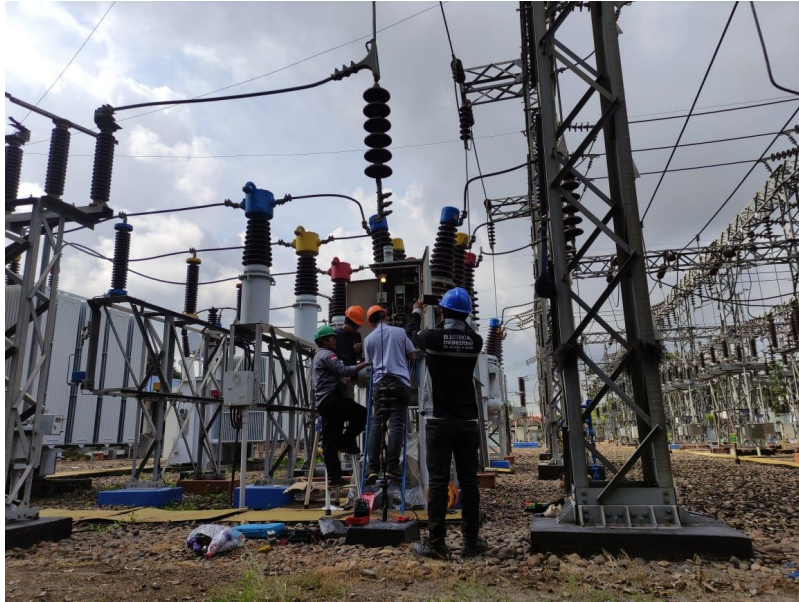
Gambar kegiatan Pemeliharaan dan Penggantian UVR (Under Voltage Relay) sebagai proteksi tegangan rendah