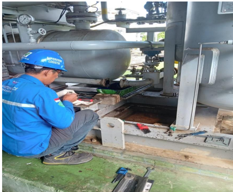
Gambar kegiatan Pemeliharaan dan penggantian saluran pipa penghubung di Air Compressor LM6000