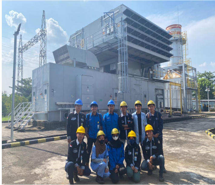
Foto bersama dengan Kelas 5LB,5LC,DAN 5LD D3 Teknik Listrik di PLTG Borang