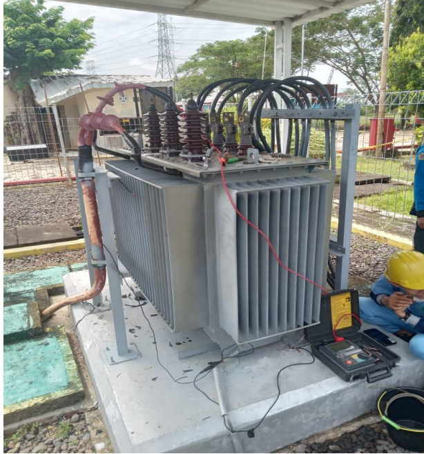
Gambar Transformator PS unit 3