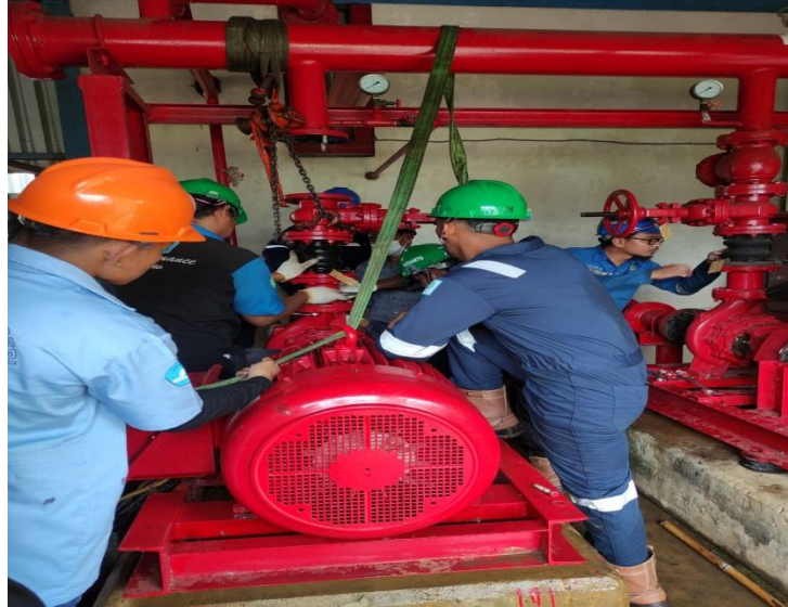
Gambar kegiatan Melakukan perbaikan pada Jockey pump dan melakukan penggantian Pipa Valve yang bocor di House Pump