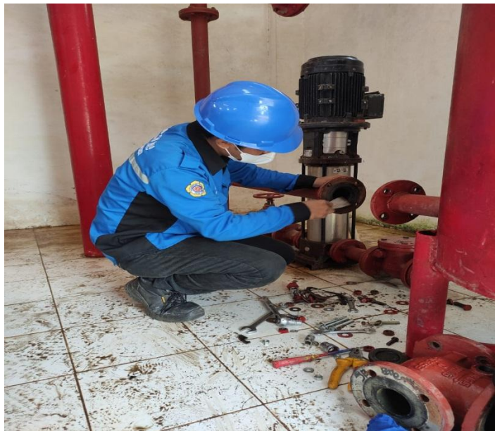
Gambar Kegiatan saat melakukan pembersihan dan penggantian pipa Vulve di House Pump