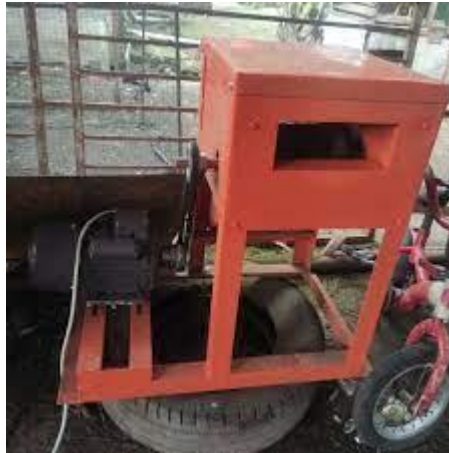
Gambar 2.3 Mesin Serut Lidi Kelapa Sawit (Cakra, 2020)

Untuk dapat membantu para pengrajin dalam proses penyerutan daun kelapa sawit yang lebih cepat, hemat tenaga, dan produksi yang dihasilkan lebih banyak, maka dirancang bangun suatu mesin serut lidi sawit bertujuan mempermudah dalam proses penyerutan daun kelapa sawit dengan waktu yang lebih cepat.