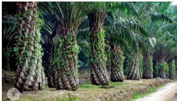
Gambar 2.1 Kelapa Sawit (Adh Nhl, 2021)

Kelapa sawit adalah tumbuhan industri/ perkebunan yang berguna sebagai penghasil minyak masak, minyak industri, maupun bahan bakar. Pohon Kelapa Sawit terdiri dari dua spesies yaitu elaeis guineensis dan elaeis oleifera yang digunakan untuk pertanian komersil dalam pengeluaran minyak kelapa sawit. Pohon Kelapa Sawit elaeis guineensis , berasal dari Afrika barat diantara Angola dan Gambia, pohon kelapa sawit elaeis oleifera , berasal dari Amerika tengah dan Amerika selatan. Kelapa sawit menjadi populer setelah revolusi industri pada akhir abad ke-19 yang menyebabkan tingginya permintaan minyak nabati untuk bahan pangan dan industri sabun.