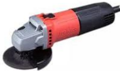
Gambar 2.5 Mesin Gerinda (Makita, 2021)

Mesin gerinda adalah salah satu mesin perkakas yang digunakan untuk memotong atau mengasah benda kerja dengan tujuan tertentu. Prinsip kerja mesin ini ialah roda gerinda berputar bersentuhan dengan benda kerja dan terjadi pemotongan atau pengesahan.