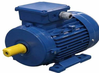
Gambar 2.5 Motor Listrik (Etsworld, 2021)