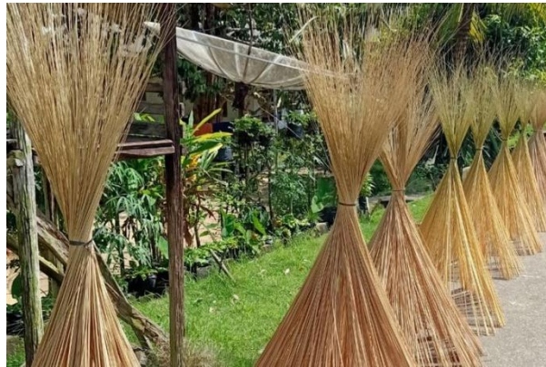
Gambar 2.2 Lidi Sawit (Heru Danhur, 2020)

Lidi atau tulang daun kelapa bisa diolah menjadi kerajinan bernilai ekonomis. Daun kelapa sawit terdiri dari rachis(pelepah daun), pinnac (anak daun) dan spines (lidi). Panjang pelepah daun bervariasi tergantung varietas dan tipenya serta kondisi lingkungan.