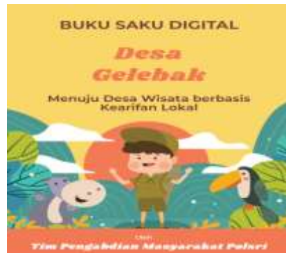
Gambar 2. Halaman Sampul Buku Saku Digital

penyusunan kerangka buku berupa outline dasar. Develop dengan mengembangkan konten materi buku saku berdasarkan outline yang diberikan. Gambar 2 berikut menunjukkan halaman sampul dari buku digital yang dikembangkan :