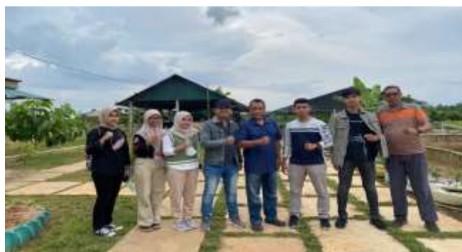
Gambar 1. Bersama koordinator kegiatan