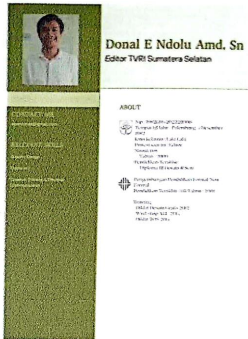
Validator Audio Visual II