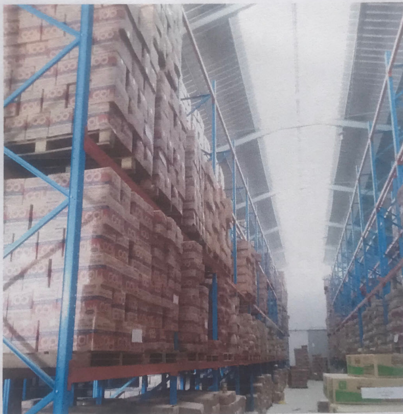
Lokasi Dalam Gudang