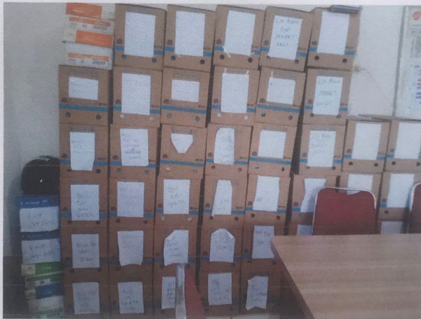
Penyimpanan Arsip Terbaru