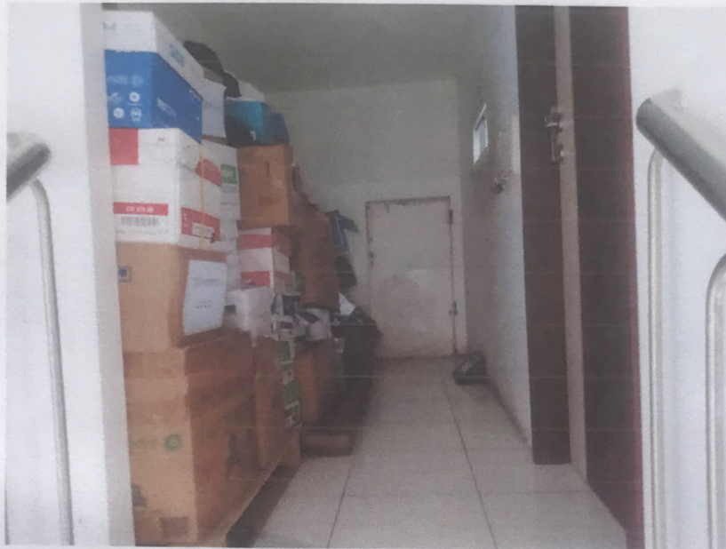
Penyimpanan Arsip Lama