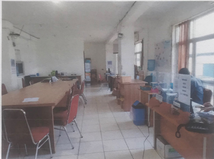
Ruang Kerja Karyawan