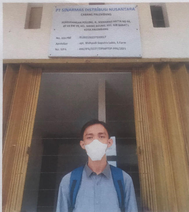
Bagian depan Lokasi Penelitian