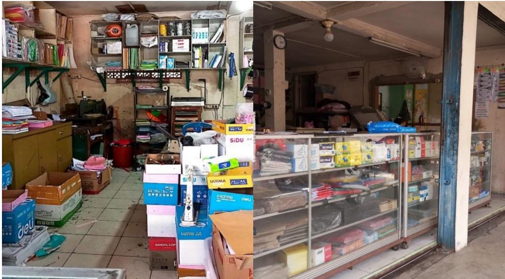
Gambar 1.1 Keadaan Toko CV Adi Putra Utama

I, Kota Palembang. Adapun gambaran keadaan toko pada CV Adi Putra Utama dapat dilihat sebagai berikut: