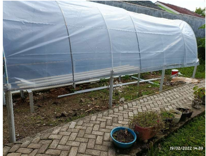
Green House Hidroponik