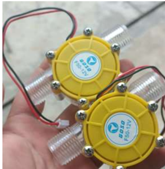
Generator DC 12 Volt