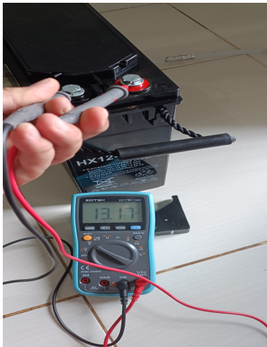
Pengukuran Tegangan Baterai kedua