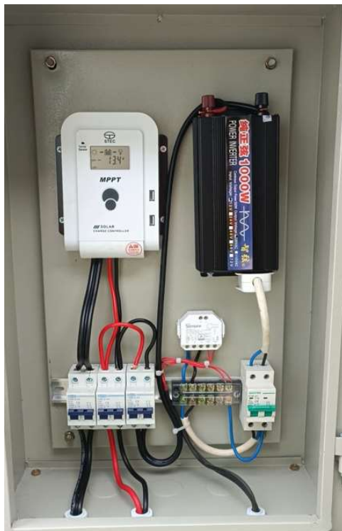
Panel Box bagian dalam