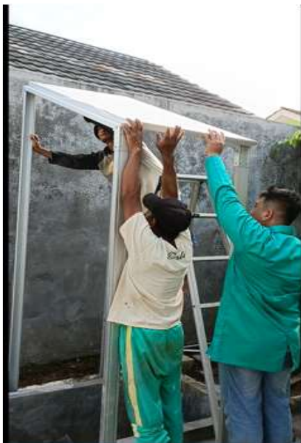
Pemasangan panel surya pada struktur