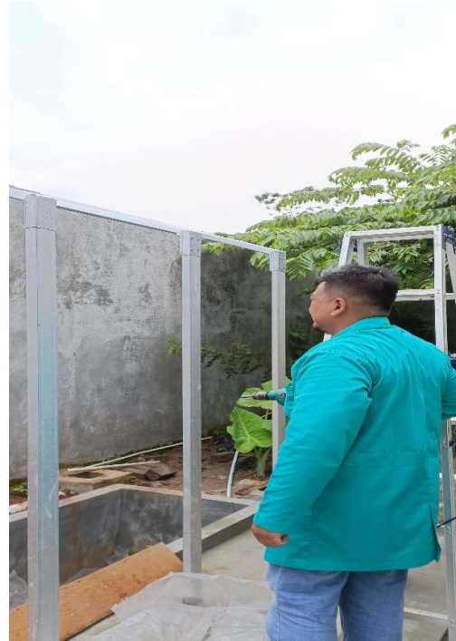
Persiapan pemasangan panel surya