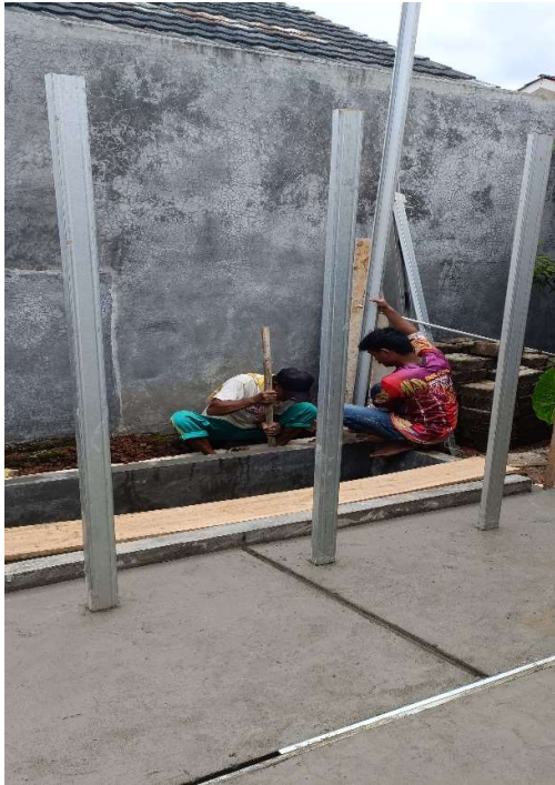
Pemasangan struktur panel surya dan pembuatan kolam ikan