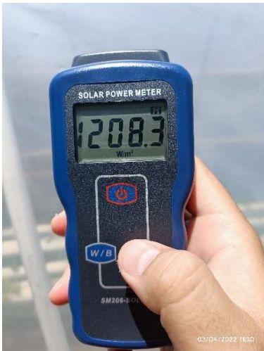
Irradiance pada bulan maret 2022 jam 11.30