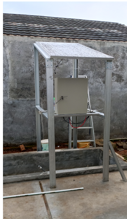
Panel box terinstal pada struktur