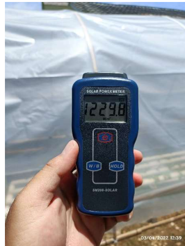
Irradiance pada bulan maret 2022 jam 12.39