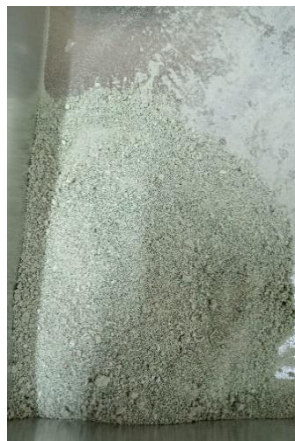
Katalis zeolite setelah di furnace