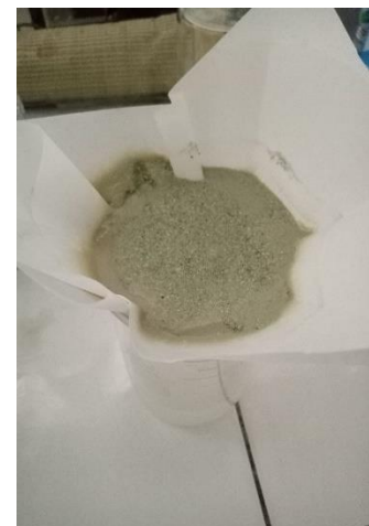
Pencucian katalis zeolit dengan aquadest hingga