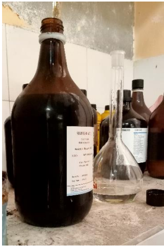
Pembuatan Larutan H_2SO_4 1.2 M