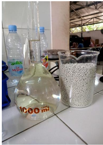
Melarutkan dengan aquadest