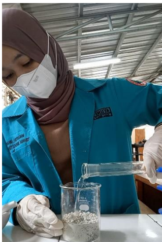
Katalis zeolite direndam dalam larutan H_2SO_4 1,2 M