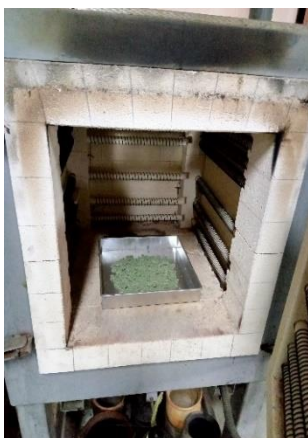
Katalis zeolite dikeringkan didalam