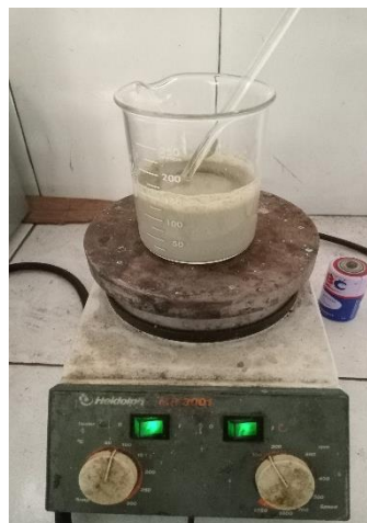
Katalis zeolite dipanaskan dengan suhu 78\text{ }^{\circ}\text{C}