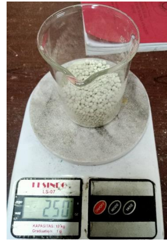
Penimbangan Katalis zeolit