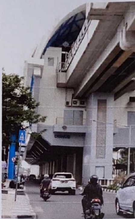
Stasiun LRT Dishub