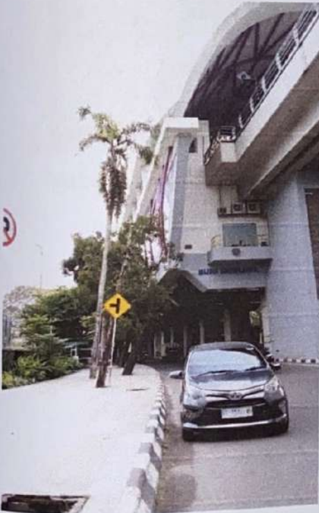
Stasiun LRT Bumi Sriwijaya