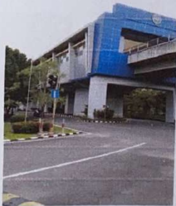
Stasiun LRT Bandara