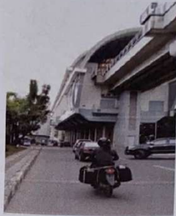
Stasiun LRT RSUD