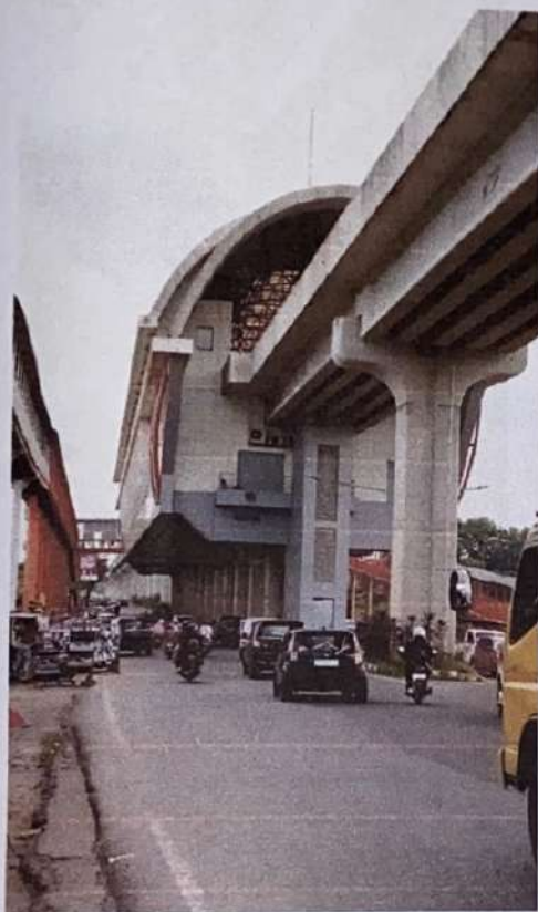
Stasiun LRT DJKA