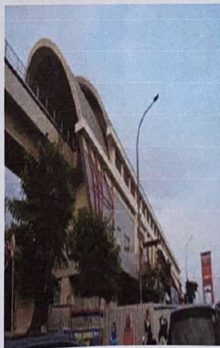
Stasiun LRT Ampera