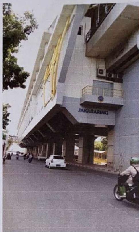
Stasiun LRT Jakabaring