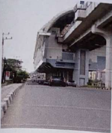
Stasiun LRT Garuda Dempo