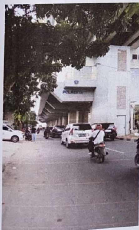
Stasiun LRT Polresta