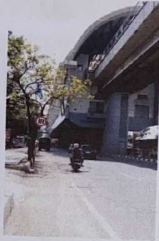
Stasiun LRT Asrama Haji