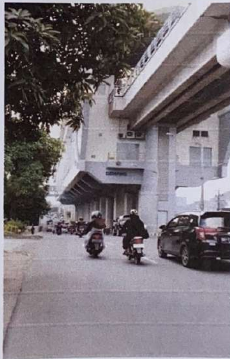
Stasiun LRT Demang