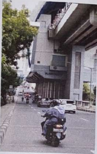
Stasiun LRT Puntikayu