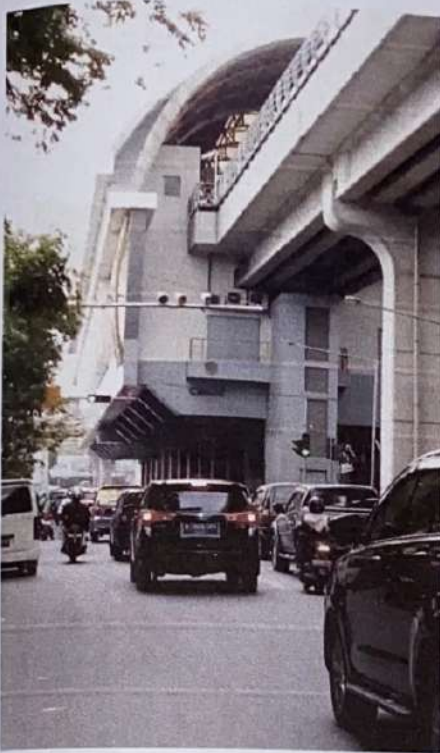
Stasiun LRT Cinde