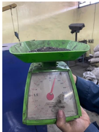
Proses Pengujian dan Perawatan