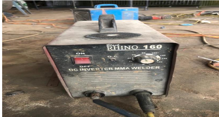
Gambar 2.8 Mesin Las Listrik

yang di las. Elektroda yang digunakan untuk membuat alat tersebut yaitu elektroda NK 68 E6013 dengan ukuran 2,6 mm.