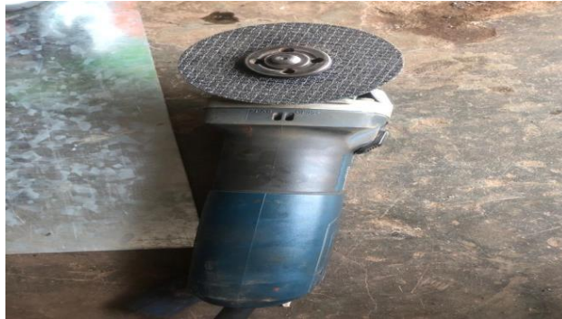
Gambar 2.10 Mesin Gerinda

Mesin gerinda ialah mesin perkakas yang digunakan untuk mengasah dan memotong benda kerja untuk kebutuhan di sebuah industry (Erick Y, 2021). Dalam pengoperasiannya, mesin gerinda menggunakan cutting wheel atau mata gerinda potong. Mesin gerinda ini berfungsi untuk memotong besi plat maupun besi pipa.