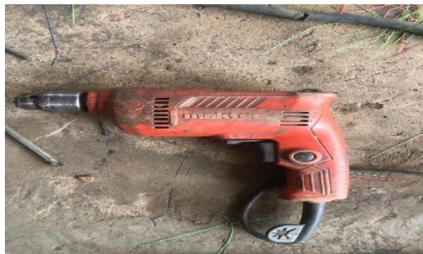
Gambar 2.9 Mesin Bor Tangan

Mesin bor adalah suatu jenis mesin gerakanya memutarakan alat pemotong yang arah pemakanan mata bor hanya pada sumbu mesin tersebut (pengerjaan pelubangan) (Klop mart 2019), sedangkan pengeboran adalah operasi menghasilkan lubang berbentuk bulat dalam lembaran kerja dengan menggunakan pemotong berputar yang disebut bor, Mata bor yang digunakan untuk membuat alat tersebut yaitu mata bor ukuran 6 mm. (Klop mart 2019)