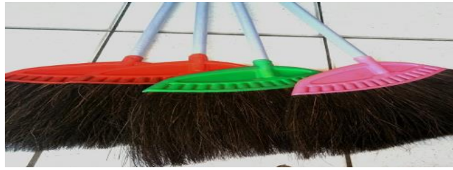
Gambar 2.4 Sapu Ijuk (Salsa R, 2022)