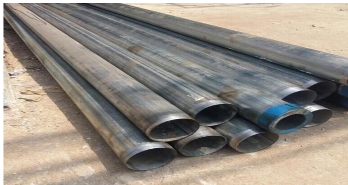
Gambar 2.11 Besi Pipa Galvanis

Besi pipa 1 inch ini diperlukan untuk membuat bagian handle dorongan alat penyapu tersebut dan besi ini sangat cocok karena ukuran dan kekuatan serta harga yang terjangkau.