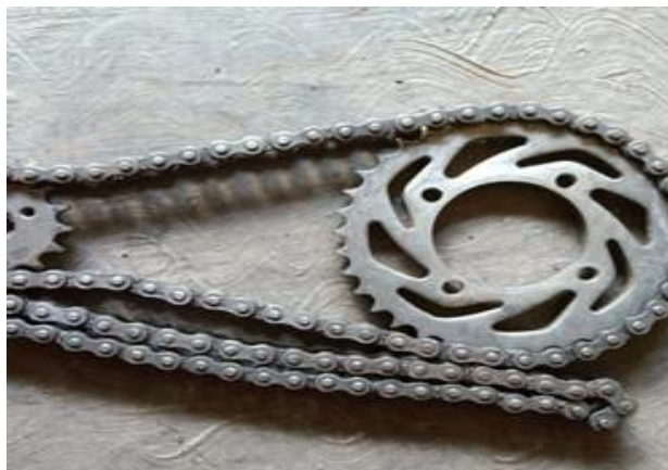
Gambar 2.7 Sprocket dan Rantai motor

Penambahan rantai memungkinkan ukuran roda kemudi dikurangi. Roda kemudi yang lebih kecil memungkinkan kedua roda itu berukuran sama, membuat alat tersebut lebih aman. Rantai motor bersifat tertutup untuk menghubungkan gerigi-gerigi penggerak roda. Rantai motor, menghubungkan antara sprocket depan dengan sprocket belakang. Sprocket depan menyatu dengan sapu penyalur, sedangkan sprocket belakang menyatu dengan roda. Dengan adanya rantai sebagai penghubung antar sprocket , ketika alat di dorong dan ban berputar, maka sapu juga berputar dan akan menggerakkan alat sesuai mekanik.