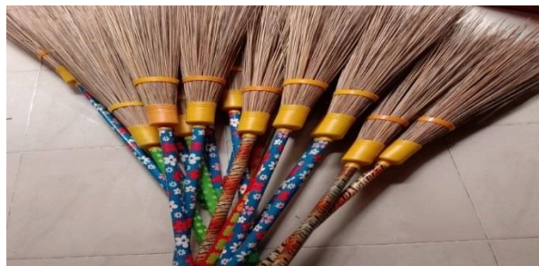
Gambar 2.3 Sapu Lidi (Murtazam, 2016)

Sapu lidi adalah alat pembersih halaman, pekarangan atau jalan raya, sapu lidi banyak digunakan oleh perumahan, perkantoran atau petugas kebersihan, yang terbuat dari lidi pelepah pohon, lidi yang digunakan bisa berasal dari pelepah kelapa atau aren.