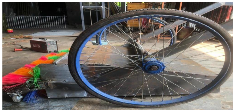
Gambar 2.6 Roda Gerobak/Velg Becak ukuran 28 7 17 (Dokumentasi Pribadi, 2023)

Roda gerobak/velg becak jari-jari ukuran diameter 28 7 17 ini sangat cocok digunakan untuk membuat alat rancang bangun yang kami produksi yaitu alat penyapu jalan sistem mekanik.