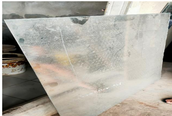
Gambar 2.13 Besi Plat Galvanis (Dokumentasi Pribadi, 2023)

Besi plat dengan ukuran 6mm ini diperlukan untuk membuat tempat sampah dan tempat dudukan tempat sampah tersebut.