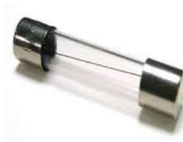
Gambar 3.1 Fuse (Buka Lapak, 2019)

Memutuskan arus listrik saat mengetahui adanya korsleting atau arus hubungan pendek yang bisa menyebabkan kecelakaan seperti kebakaran.