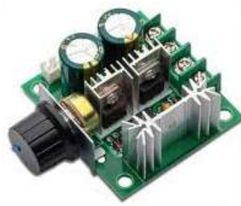
Gambar 3.2 Dimmer DC ( Shopee, 2020)