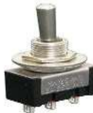
Gambar 2.9 Toggle Switch (Webike, 2021)

Saklar yang digerakan oleh tuas atau toggle yang miring ke salah satu posisi dari dua posisi atau lebih untuk menghubungkan atau memutuskan aliran listrik.