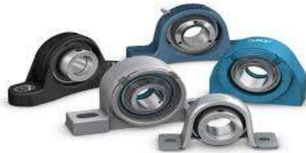
Gambar 2.6 Pillow Block (SKF, 2023)