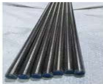
Gambar 2.6 As Drat (Bibli, 2013)

Dengan menggunakan Ulir long drat , maka sebuah benda kerja atau komponen mesin bisa di setting pada posisi atau kondisi tertentu sesuai kebutuhan karena dengan long drat mempunyai stroke yang panjang sepanjang Ulir long drat tersebut. Long drat ini pada dasarnya merupakan baut yang berukuran panjang dengan seluruh bagian batangnya full alur ulir, sehingga kita bisa menggunakan semua titik alur ulir tersebut sesuai kebutuhan.