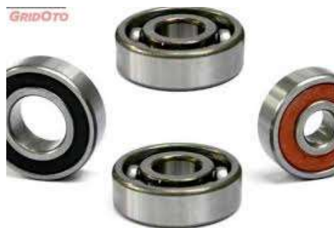
Gambar 2.6 Bearing (Gridoto, 2018)