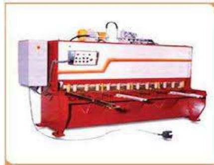
Gambar 2.2 Mesin Gunting Hidrolik (Mudirianto. 2016)