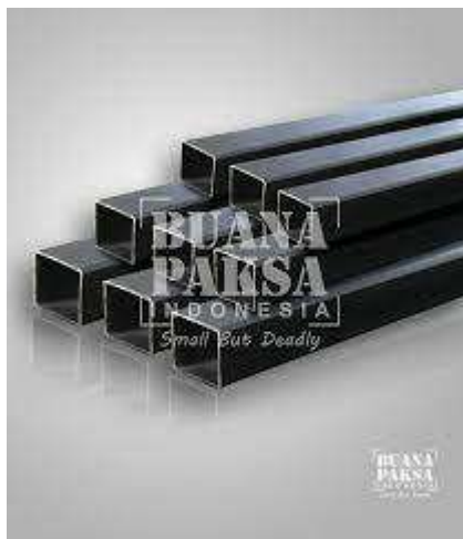
Gambar 2.3 Besi square hollow bar (Buana Paksa Indonesia, 2013)

Bahan pada rangka yang digunakan adalah besi square hollow bar ukuran 40mm x 40mm x 2mm Merupakan komponen yang digunakan untuk meletakkan komponen-komponen lainnya. Seperti meletakkan base pada rangka yang menggunakan besi square hollow bar dengan ukuran 40mm x 40mm dengan ketebalan 2mm dan untuk terminal memakai besi square hollow bar ukurana 25mm x 25mm x 2mm, komponen ini digunakan sebagai dudukan pada gerinda yang di bantu bearing untuk pergerakan maju mundur.