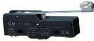
Gambar 3.0 Limit Switch (Shopee, 2020)