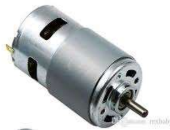
Gambar 2.4 Motor DC (Dictio, 2021)