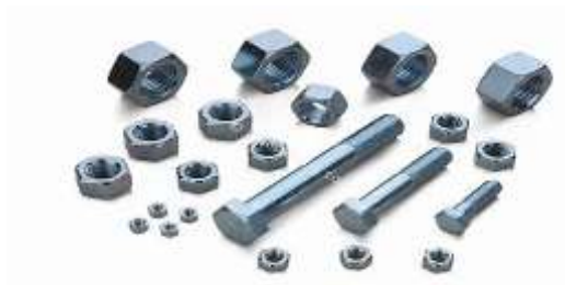
Gambar 2.5 Baut dan Mur (Shopee, 2020)

Untuk menentukan ukuran baut dan mur, sebagai faktor harus diperhatikan seperti sifat gaya yang bekerja pada baut, syarat kerja, kekuatan bahan, kelas ketelitian, dll. Adapun gaya-gaya yang bekerja pada baut dapat berupa: