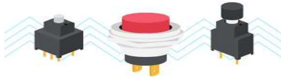
Gambar 2.8 Push Button Switch ( Cui Devices, 2022)

Saklar tombol dorong adalah jenis saklar dua posisi yang dapat menghubungkan aliran arus listrik pada saat pengguna menekannya dan memutuskan hubungan listrik tersebut apabila kita melepaskannya.