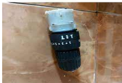
Gambar 2.7 Gearbox Chuks Bor (Shopee, 2020)

Gearbox digunakan untuk menyalurkan tenaga atau daya dari motor yang berputar untuk memunculkan pergerakan. Dengan begitu, tenaga yang dihasilkan motor bisa dimanfaatkan untuk membuat alat bisa bergerak maju atau mundur. Chuks bor digunakan untuk menjepit as drat agar bisa berputar.