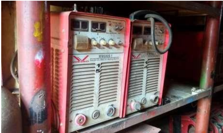
Gambar 2.2 Mesin/Travo Las (Workshop PT. Yasa Wahana Tirta Samudera, 2023)

Jika di tinjau dari arus yang keluar, mesin las dapat di golongkan menjadi :