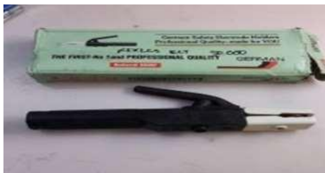
Gambar 2.5 Penjepit ( Holder ) Elektroda (Workshop PT. Yasa Wahana Tirta Samudera, 2023)

Pada holder atau pemegang elektrode bagian untuk menjepit elektrode sudahdi buat sedemikian rupa agar mampu menjepit elektrode dengan kuat agar saat digunakan untuk mengelas elektroda tidak terjatuh. Sedangkan untuk menjepit massa juga dibuat sedemikian rupa agar dapat menjepit benda yang akan di las dengan kuat.