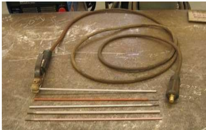
Gambar 2.3 Kabel Las (Workshop PT. Yasa Wahana Tirta Samudera, 2023)

Mesin las ini mampu melayani pengelasan dengan arus searah (DC) dan pengelasan dengan arus bolak-balik. Keluaran arus bolak-balik diambil dari terminal lilitan sekunder transformator melalui regulator arus. Adapun arus searah diambil dari keluaran alat perata arus. Pengaturan keluaran arus bolak-balik atau arus searah dapat dilakukan dengan mudah, yaitu hanya dengan memutar alat pengatur arus dari mesin las. Mesin las AC-DC lebih fleksibel karena mempunyai semua kemampuan yang dimiliki masing-masing mesin las DC atau mesin las AC. Mesin las jenis ini sering digunakan unbengkel yang mempunyai jenis-jenis pekerjaan yang bermacam-macam, sehingga tidak perlu mengganti-ganti las untuk pengelasan berbeda.