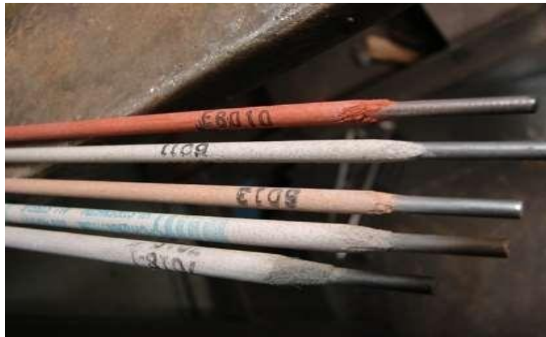
Gambar 2.6 Elektroda (Workshop PT. Yasa Wahana Tirta Samudera, 2023)