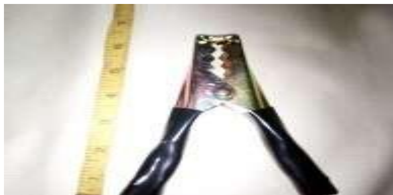
Gambar 2.4 Penjepit massa las (workshop PT. Yasa Wahana Tirta Samudera, 2023)

Bahan yang di gunakan untuk Membuat penjepit massa dan pemegang elektroda digunakan bahan yang mudah menghantarkan listrik. Bahan yang umum digunakan untuk membuat penjepit massa dan pemegang elektrode adalah dengan menggunakan bahan tembaga. Ujung yang berselaput dari elektroda dijepit dengan pemegan elektrode. Ini terdiri dari mulut penjepit dengan pemegang yang di bungkus oleh bahan penyekat (biasanya dari ebonit).