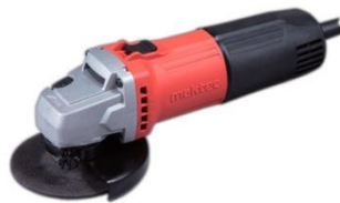
Gambar 2.7 Gerinda Tangan (aziz, 2023)

Mesin gerinda tangan merupakan mesin yang berfungsi untuk menggerinda benda kerja. Awalnya mesin gerinda hanya ditujukan untuk benda kerja berupa logam yang keras seperti besi dan stainless steel. Menggerinda dapat bertujuan untuk mengasah benda kerja seperti pisau dan pahat, atau dapat juga bertujuan untuk membentuk benda kerja seperti merapikan hasil pemotongan, merapikan hasil las, membentuk lengkungan pada benda kerja yang bersudut, menyiapkan permukaan benda kerja untuk dilas, dan lain-lain.