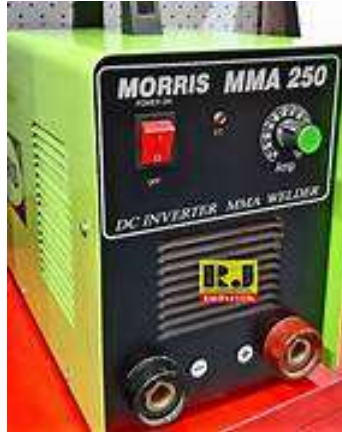
Gambar 2.9 Mesin Las DC (Swarma, 2023)

(AC) menjadi arus searah (DC). Arus bolak-balik diubah menjadi arus searah pada proses pengelasan mempunyai beberapa keuntungan, antara lain: