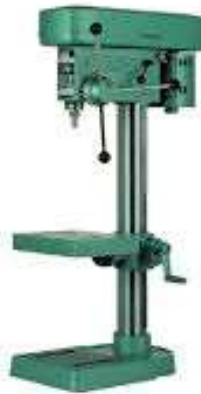
Gambar 2.4 Mesin Bor Tegak (Wikipedia, 2023)