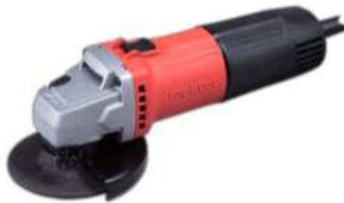
Gambar 2.11 Mesin Gerinda Tangan (Supardi, 2023)

untuk mengasah benda kerja seperti pisau dan pahat atau dapat juga bertujuan untuk membentuk benda kerja seperti merapikan hasil potongan, merapikan hasil las, membentuk lengkungan pada benda kerja yang bersudut, menyiapkan permukaan benda kerja untuk dilas, dan lain-lain.