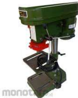
Gambar 2.2 Mesin Bor Meja (Wikipedia, 2023)

Bor meja adalah ini digunakan untuk membuat lobang benda kerja kecil (terbatas sampai dengan diameter 16 mm). Prinsip meja adalah putaran motor listrik diteruskan ke poros poros berputar. Selanjutnya poros berputar yang pemegang mata bor dapat digerakkan naik turun dengan pengeboran.