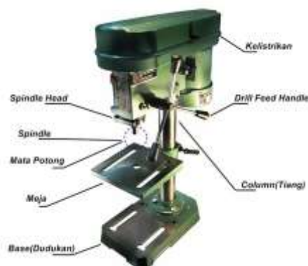
Gambar 2.5 Bagian-Bagian Mesin Bor

Handel untuk menurunkan atau menekan spindle dan mata bor ke benda kerja (memakankan)