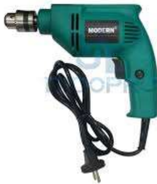
Gambar 2.3 Mesin Bor Tangan (Wikipedia, 2023)

Mesin bor tangan adalah mesin bor yang pengoperasiannya dengan menggunakan tangan dan bentuknya mirip pistol. Mesin bor tangan biasanya digunakan untuk melubangi kayu, tembok maupun pelat logam. Khusus Mesin bor ini selain digunakan untuk membuat lubang juga bisa digunakan untuk mengencangkan baut maupun melepas baut karena dilengkapi 2 putaran yaitu kanan dan kiri. Mesin bor ini tersedia dalam berbagai ukuran, bentuk, kapasitas dan juga fungsinya masing-masing.