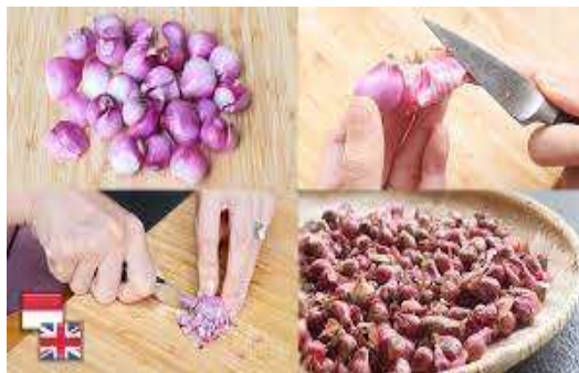
Gambar 2.1 Mengupas Bawang (Juna, 2023)

Alat ini cocok digunakan untuk produksi dalam skala menengah seperti, restoran, dan UMKM, sehingga dapat meminimalisir waktu produksi sekaligus menambah kuantitas hasil produksi. Selain itu, dengan menggunakan alat ini juga dapat mengurangi jumlah tenaga kerja, karena cukup satu orang saja untuk mengoperasikannya. Hal ini berbanding terbalik apabila masih menggunakan cara manual yang memerlukan banyak tenaga kerja