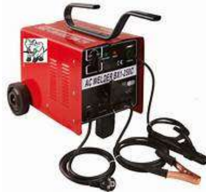
Gambar 2.8 Mesin Las AC (Wikipedia, 2023)

dimana jika kedua kabel tersebut tertukar, tidak akan mempengaruhi perubahan temperature yang timbul.