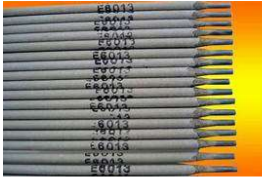
Gambar 2.7 Elektroda Las Listrik (Dwiki, 2023)