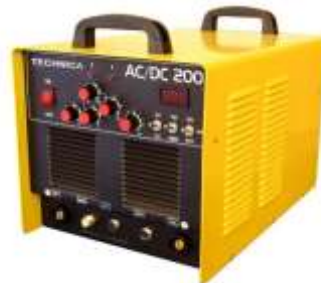
Gambar 2.10 Mesin Las AC-DC (Swaddipa, 2023)

Mesin las AC-DC lebih fleksibel karena mempunyai semua kemampuan yang dimiliki masing-masing mesin las DC atau mesin las AC. Mesin las jenis ini sering digunakan untuk bengkel-bengkel yang mempunyai jenis-jenis pekerjaan yang bermacam-macam, sehingga tidak perlu mengganti las untuk pengelasan berbeda. Mesin las Arus ganda dapat menyuplai arus antara 25 ampere sampai 140 ampere yang digunakan untuk mengelas plat – plat tipis, baja anti karat ( stainless steel ) dan aluminium. Untuk mengelas benda kerja yang tebal, arus dapat disetel 60-300 ampere.