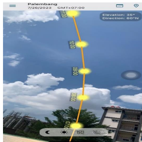
Arah Matahari Terhadap Solar Panel