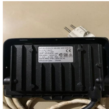
Lampu Sorot (30watt)