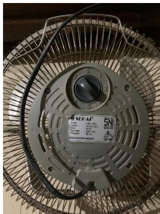
Kipas Angin (40 Watt)