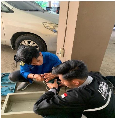
Merangkai Komponen Di Box Panel