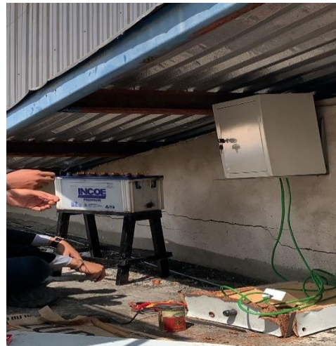
Peletakan Box Panel