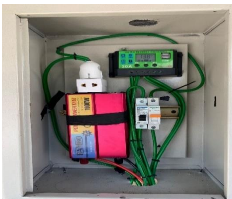
Komponen Di Dalam Box Panel