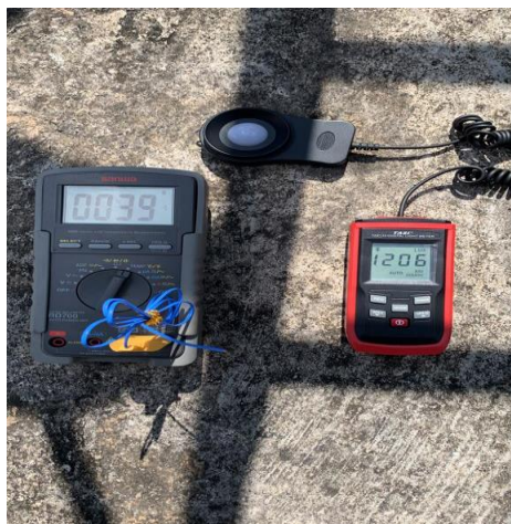
Mengukur suhu solar panel dan Lux