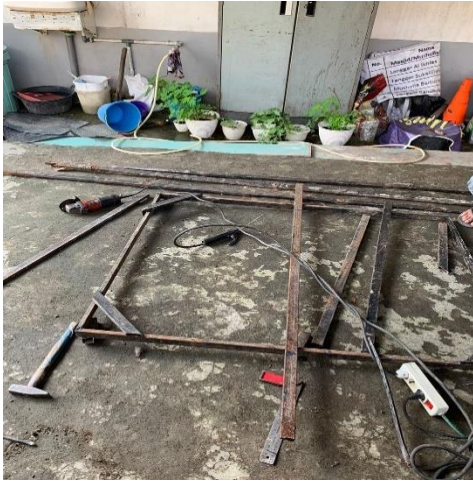
Proses Pembuatan Bricket