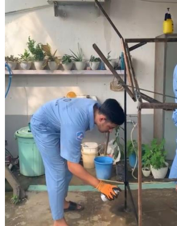
Proses Pengecetan Bricket