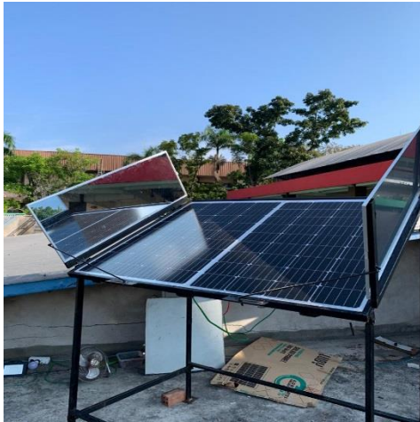
Posisi Solar Panel