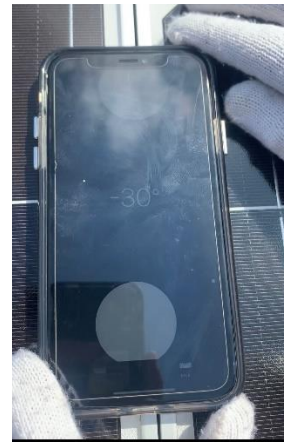
Pengaturan Sudut Solar Panel