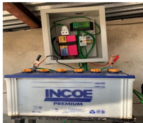
Komponen Solar Panel