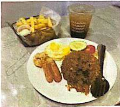
Gambar Paket 1