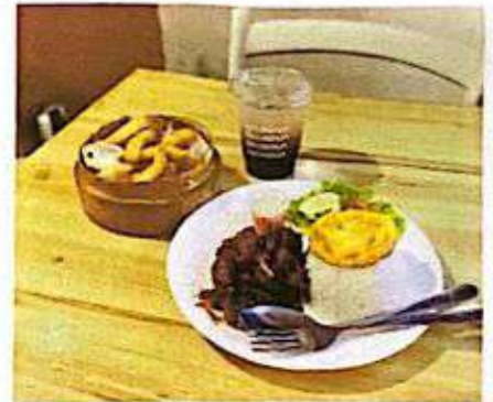
Gambar Paket 3