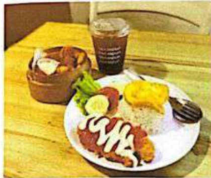
Gambar Paket 2