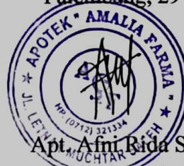
Apt. Afni Bida S.Farm Pemilik Apotek Amalia Farma