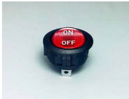
Gambar 2.5 Saklar

Saklar berfungsi untuk memutus dan menghubungkan arus listrik.