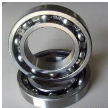
Gambar 2.2 Bearing (Bantalan)