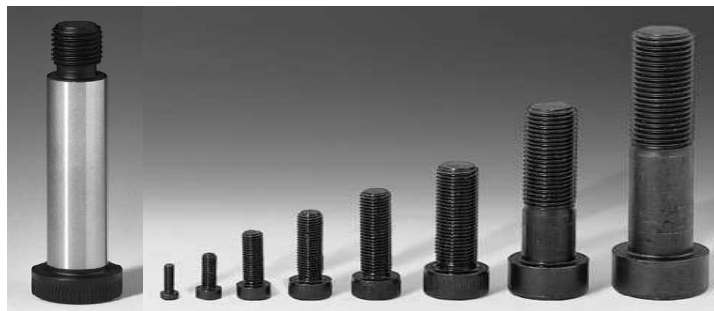
Gambar 2.6 Baut Pengikat

Baut pengikat berfungsi untuk mengikat dies ke pelat bawah dan pelat pemegang punch ke pelat atas. Diameter dan panjang baut pengikat disesuaikan dengan ukuran dua komponen yang diikatnya.