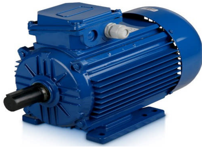
Gambar 2.1 Motor Listrik