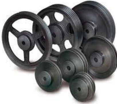
Gambar 2.4 Pulley

n_2 = putaran pulley yang digerakkan (rpm)