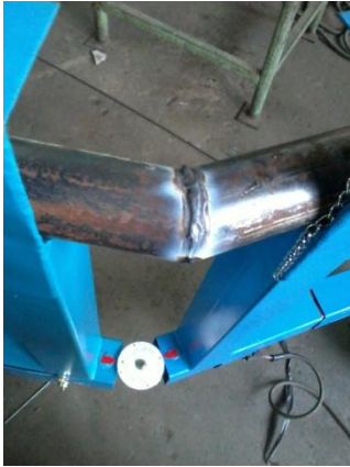
Gambar 4.1 Pengelasan Sudut 150°