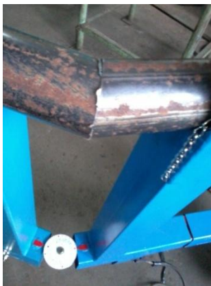
Gambar4.3 Penyetingan Sebelum Pengelasan