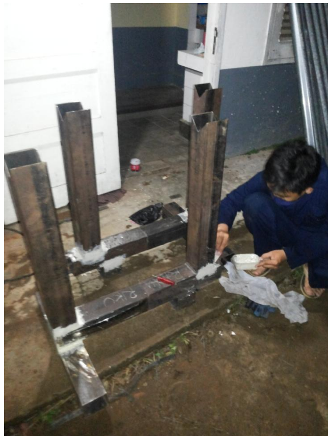
Gambar 1.2 Proses pendempulan pada alat