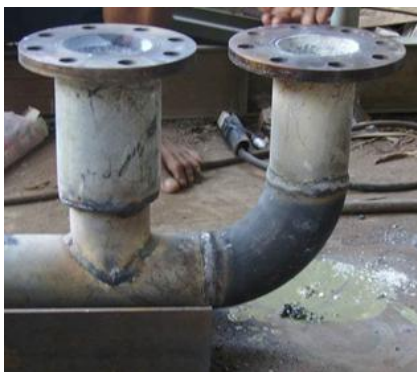
Gambar 4.5 Aplikasi pada Pipa Air