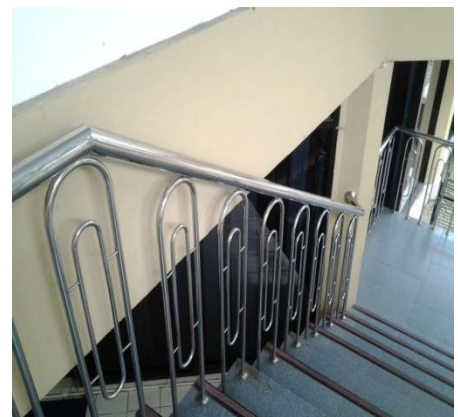
Gambar 4.4 Aplikasi Pada Pegangan Tangaa