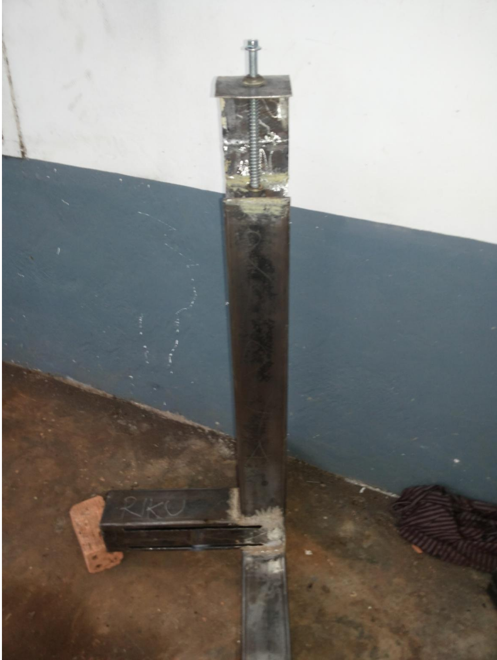
Gambar 2.1 Penyangga alat penepat sebelum di assembling dan di cat