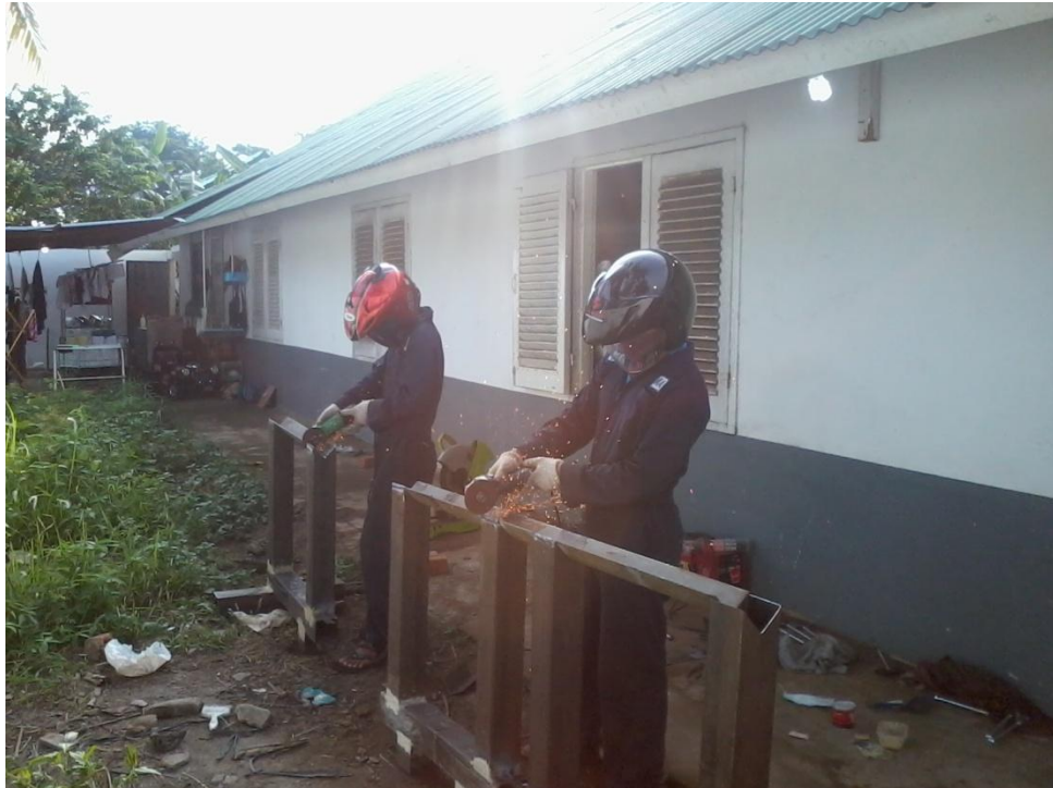
Gambar 1.1 Proses pembuatan alat