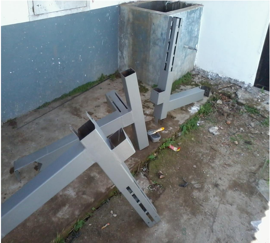
Gambar 3.1 Proses pengecatan pada alat