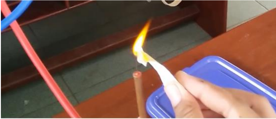
Gambar 25. Uji Bakar terhadap Gas Hidrogen