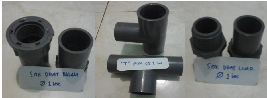
Gambar 19. Sambungan Pipa