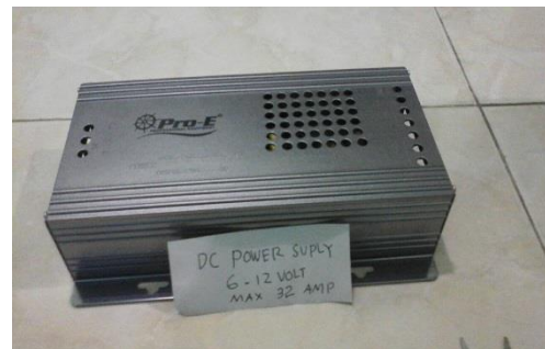
Gambar 16. DC Supplay 6-12 volt