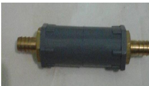
Gambar 17. Flashback Arrestor