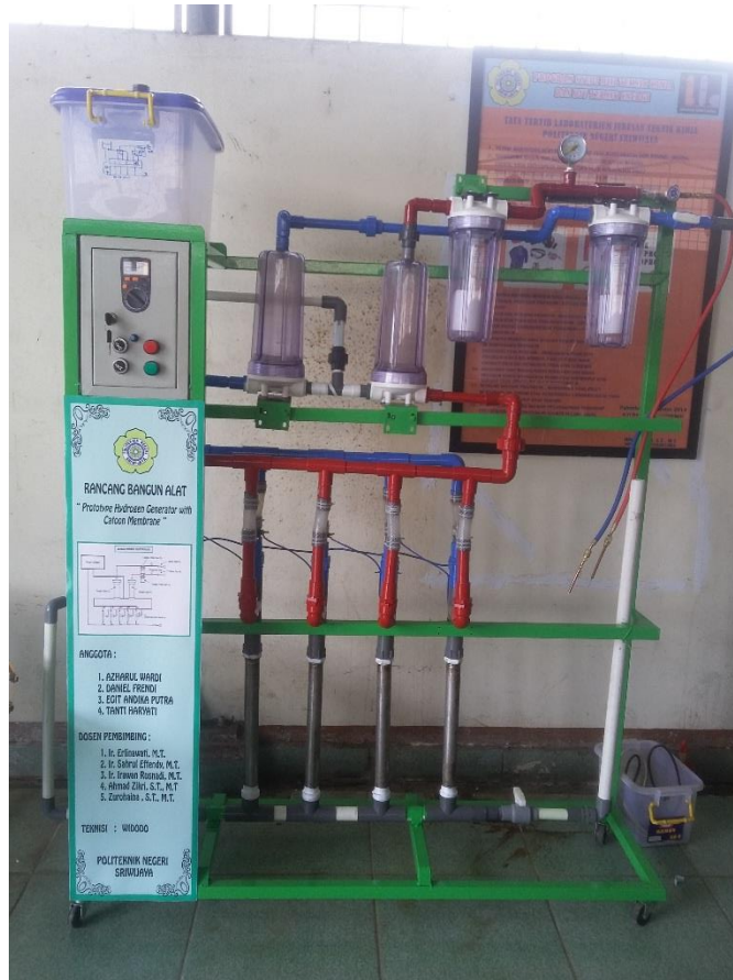
Gambar 22. Keseluruhan Alat beserta rangkaian