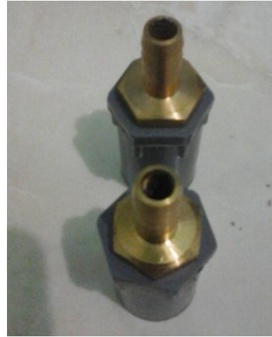
Gambar 14. Pipa Flashback Arrestor