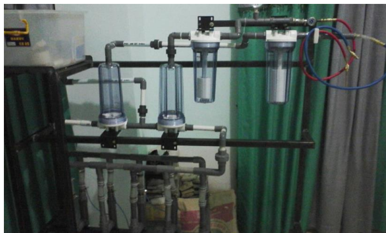
Gambar 21. Proses Perakitan Tabung Gas Penampung