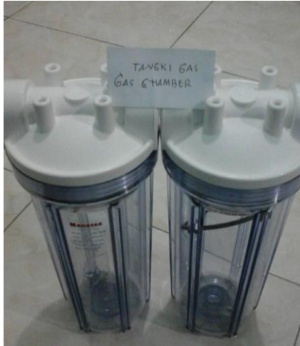
Gambar 13. Tangki Penampung Gas