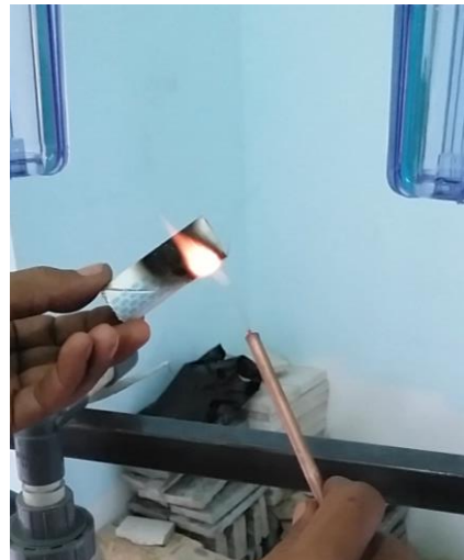
Gambar 24. Uji Bakar terhadap pipa