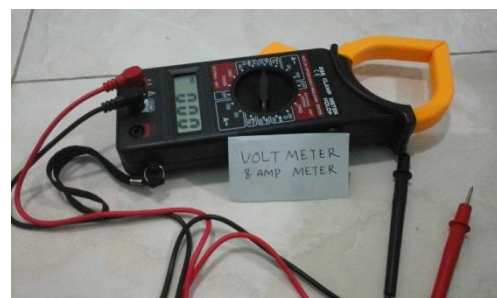
Gambar 18. Tang Meter