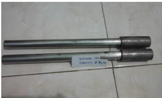
Gambar 15. Pipa Stainless Steel Elektroda