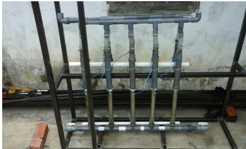
Gambar 20. Proses Perakitan Elektroda