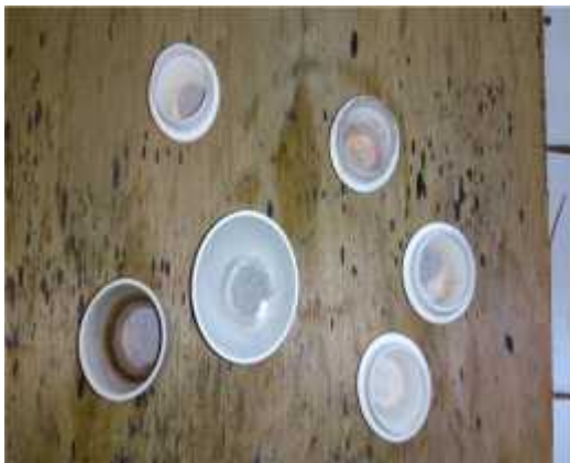
Gambar 27 Uji Kadar Abu