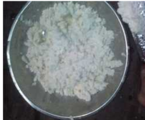
Gambar 21. Singkong telah diparut