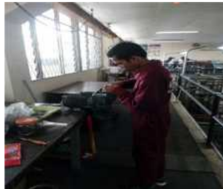
Gambar 17. Penghancur arang