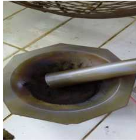
Gambar 26. Penghalusan Sampel