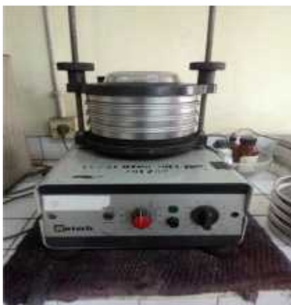
Gambar 18. Pengayakan arang