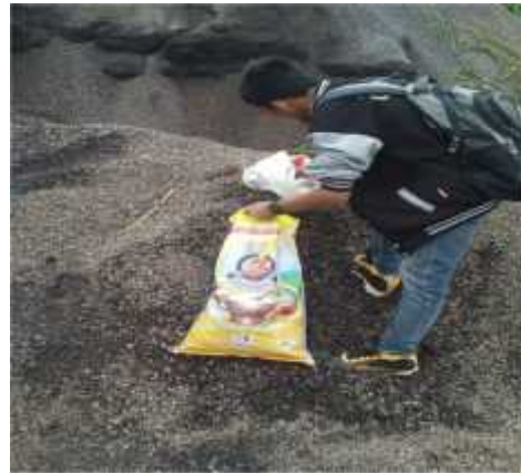
Gambar 15. Pengambilan bahan baku