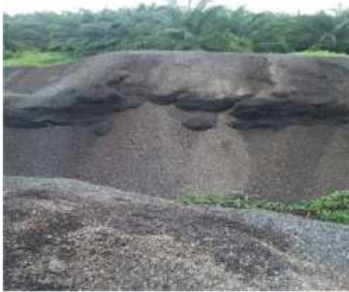
Gambar 14. Bahan baku cangkang kelapa sawit