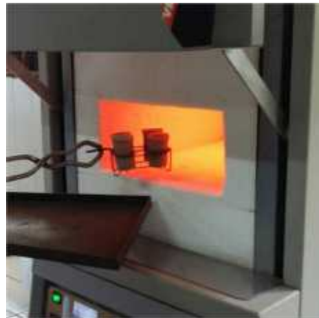
Gambar 28. Uji Kadar VM