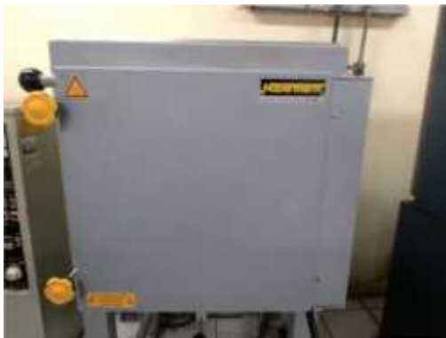
Gambar 16. Pengarangan Cangkang di Dalam Furnace