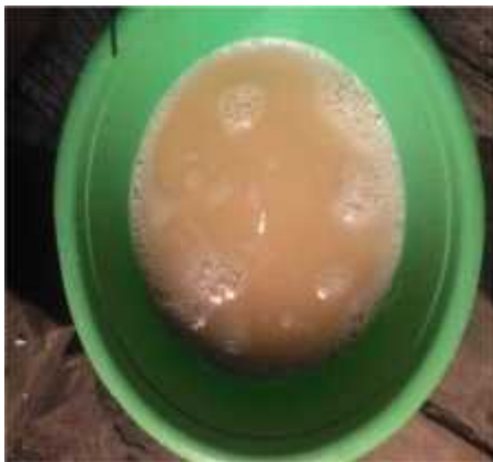
Gambar 22. Pati Singkong