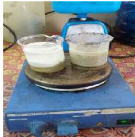
Gambar 23. Proses Pembuatan Perekat