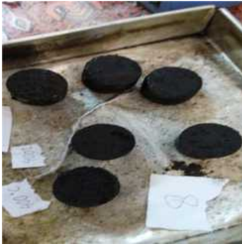
Gambar 25. Briket yang telah dipress