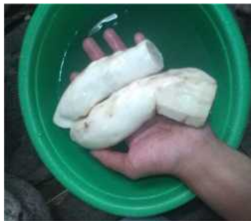
Gambar 19. Singkong yang telah dikupas