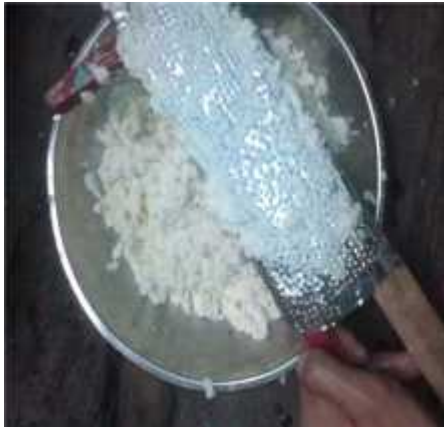
Gambar 20. Proses pamarutan Singkong