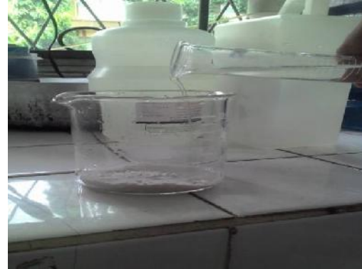
Gambar 19. Penambahan Aquadest