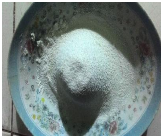
Gambar 17. Tepung Singkong Karet