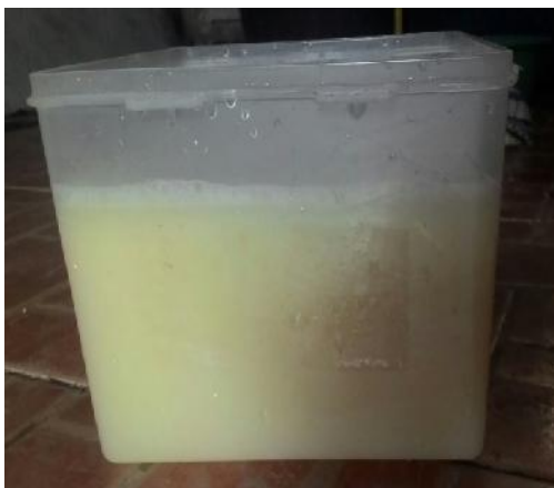
Gambar 16. Pengendapan Pati