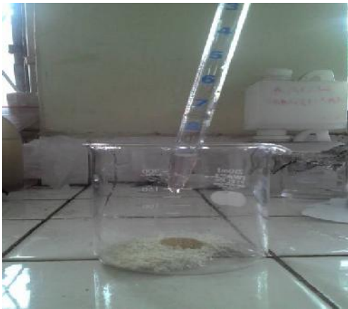
Gambar 20. Penambahan Asam Asetat