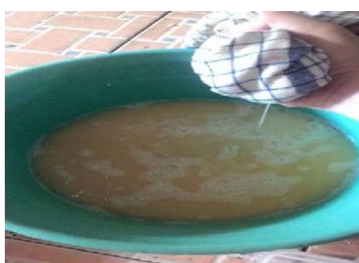
Gambar 15. Pemisahan Ampas dengan cairan