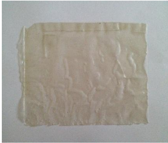
Gambar 24. Pengeringan Plastik Pada Suhu Kamar