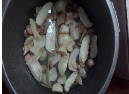
Gambar 13. Perendaman Singkong Karet