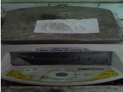
Gambar 18. Penimbangan Bahan Baku