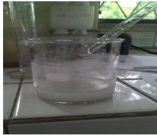
Gambar 21. Penambahan Plasticizer