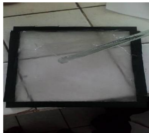
Gambar 23. Pencetakan Pada Plat