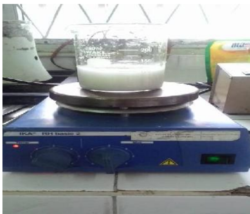
Gambar 22. Pemanasan Larutan Pada Suhu 70-80 0 C