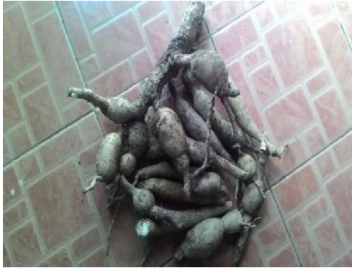
Gambar 12. Singkong Karet