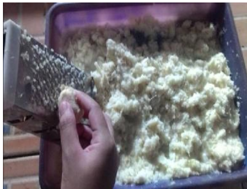
Gambar 14. Pamarutan Singkong Karet