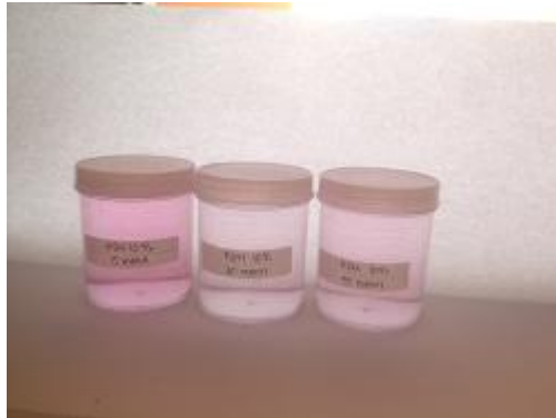
Gambar 30. Hasil Adsorpsi ( KOH 10%)