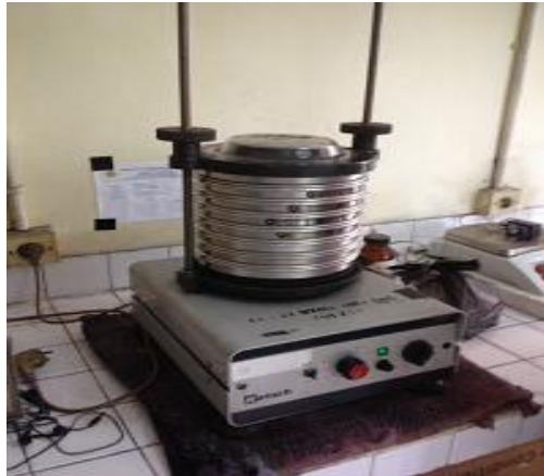
Gambar 24. Proses Sieving