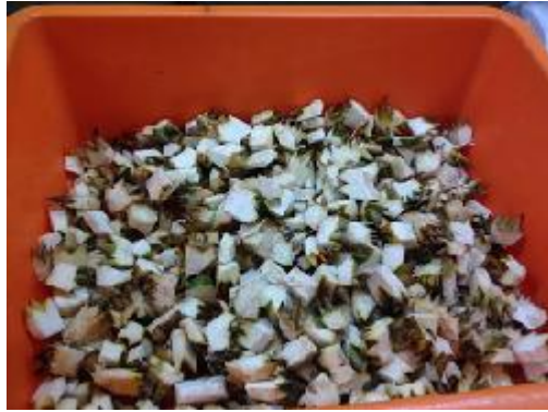
Gambar 21. Tahap Preparasi Sampel