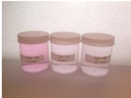
Gambar 31. Hasil Adsorpsi ( KOH 15%)