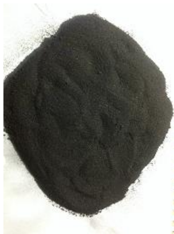
Gambar 26. Karbon Aktif Kulit Durian