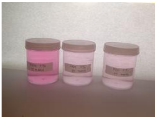
Gambar 29. Hasil Adsorpsi ( KOH 5%)