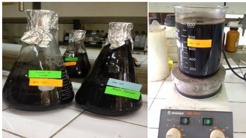
Gambar 25. Proses Aktivasi dan Pencucian Karbon Aktif