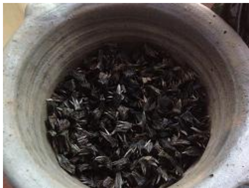
Gambar 22. Proses Karbonisasi