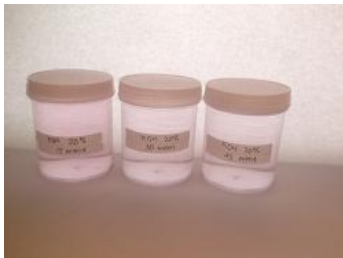
Gambar 32. Hasil Adsorpsi ( KOH 20 %)