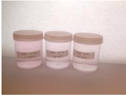
Gambar 33. Hasil Adsorpsi ( KOH 25%)