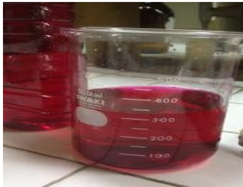
Gambar 28. Limbah Zat Warna Tenun Songket