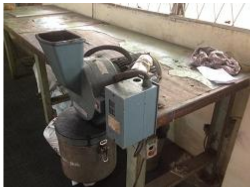
Gambar 23. Proses Grinding