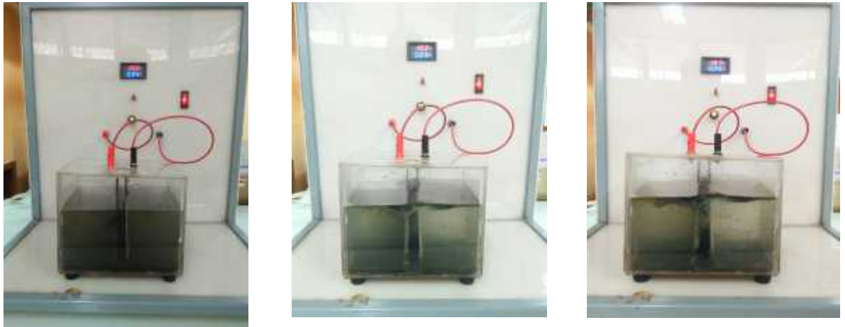
Gambar 14. Pengolahan Limbah Cair Bengkel Motor dengan Proses Elektrokoagulasi