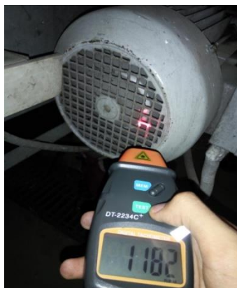
Proses Pengukuran Rpm Pada Motor Induksi 3 Fasa