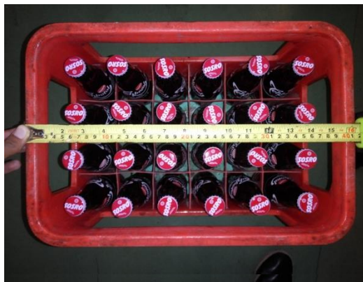
Proses Pengukuran Panjang Peti Isi