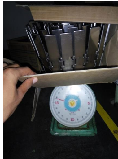
Proses Pengukuran Berat Peti Isi dan Berat Konveyor Rantai