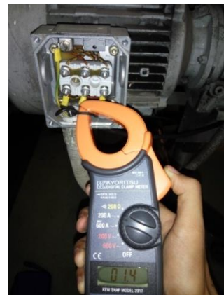
Proses Pengukuran Arus Pada Terminal Motor Induksi 3 Fasa