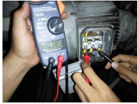
Proses Pengukuran Tegangan Pada Terminal Motor Induksi 3 Fasa