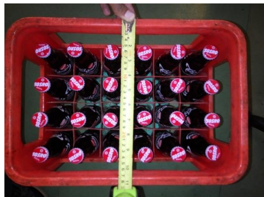
Proses Pengukuran Lebar Peti Isi