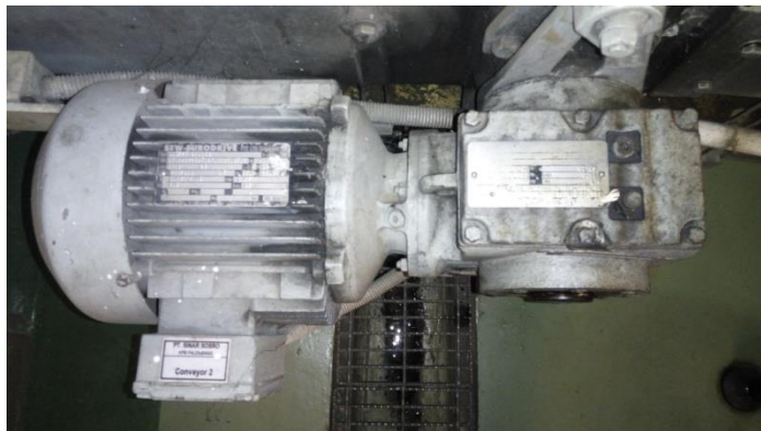
Motor Induksi Dan Gear Box Tampak Atas