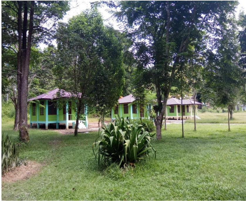
Villa Penginapan di Objek Wisata Air Terjun Curup Tenang Bedegung