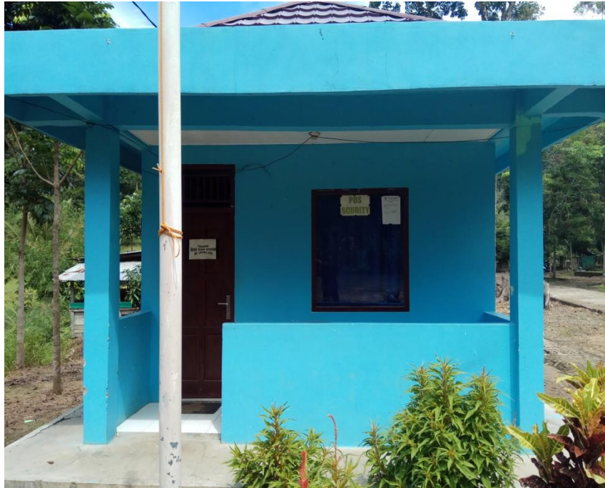
Pos Security di Objek Wisata Air Terjun Curup Tenang Bedegung