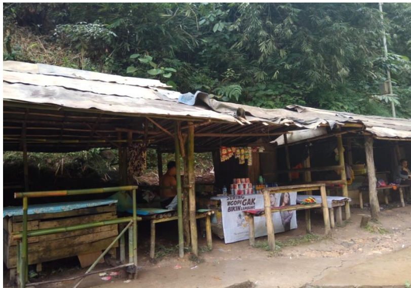
Kios Berjualan di Objek Wisata Air Terjun Curup Tenang Bedegung