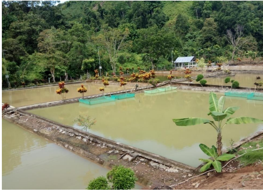
Kolam Pemancingan Ikan Yang Bekerja Sama Dengan Dinas Perternakandan Perikanan Kabupaten Muara Enim