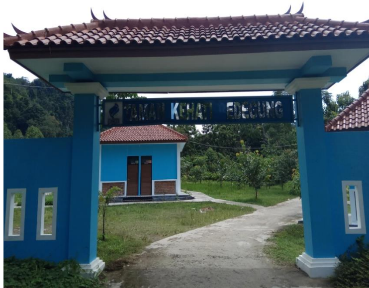
Taman Keanekaragaman Hayati Yang Bekerja Sama Dengan BLH (Badan Lingkungan Hidup) Kabupaten Muara Enim