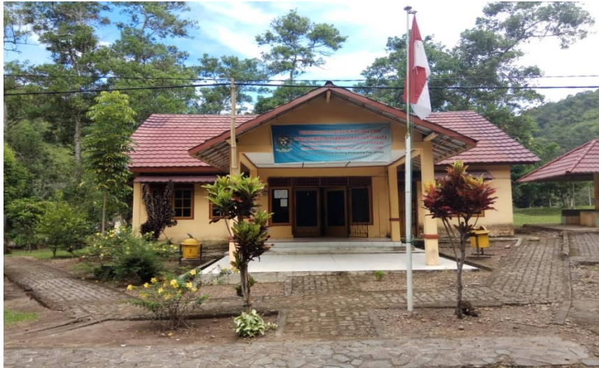
Kantor UPTD Objek Wisata Air Terjun Curup Tenang Bedegung