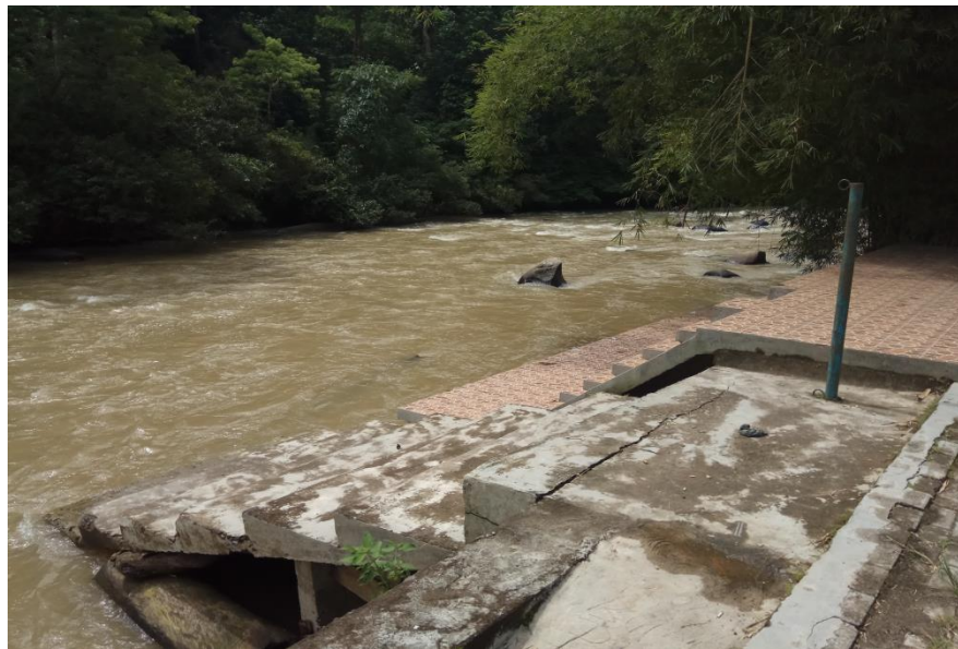
Dermaga Arung Jeram