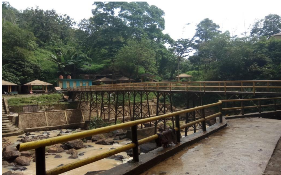
JembatanMenujuObjekWisata Air TerjunCurupTenangBedegung