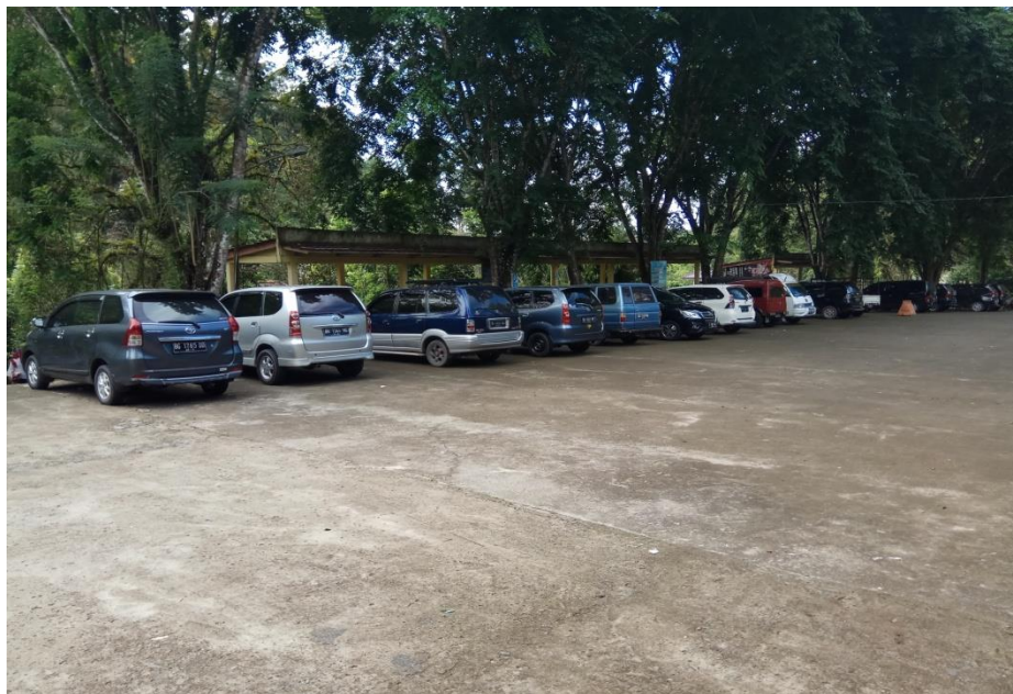
Lapangan Parkir di Objek Wisata Air Terjun Curup Tenang Bedegung