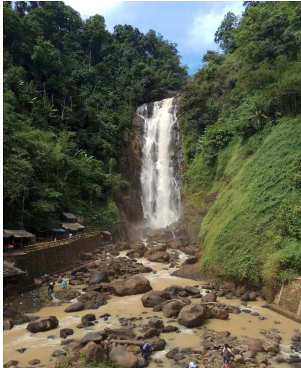
Air Terjun Curup Tenang Bedegung