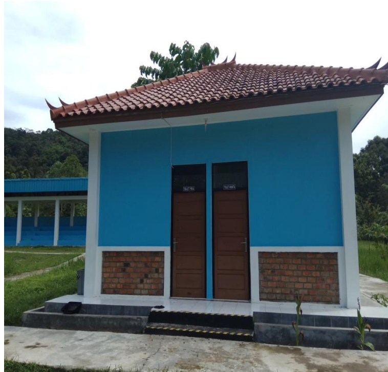
WC di ObjekWista Air TerjunCurupTenangBedegung