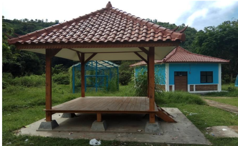
Gazebo Tempat Beristirahat