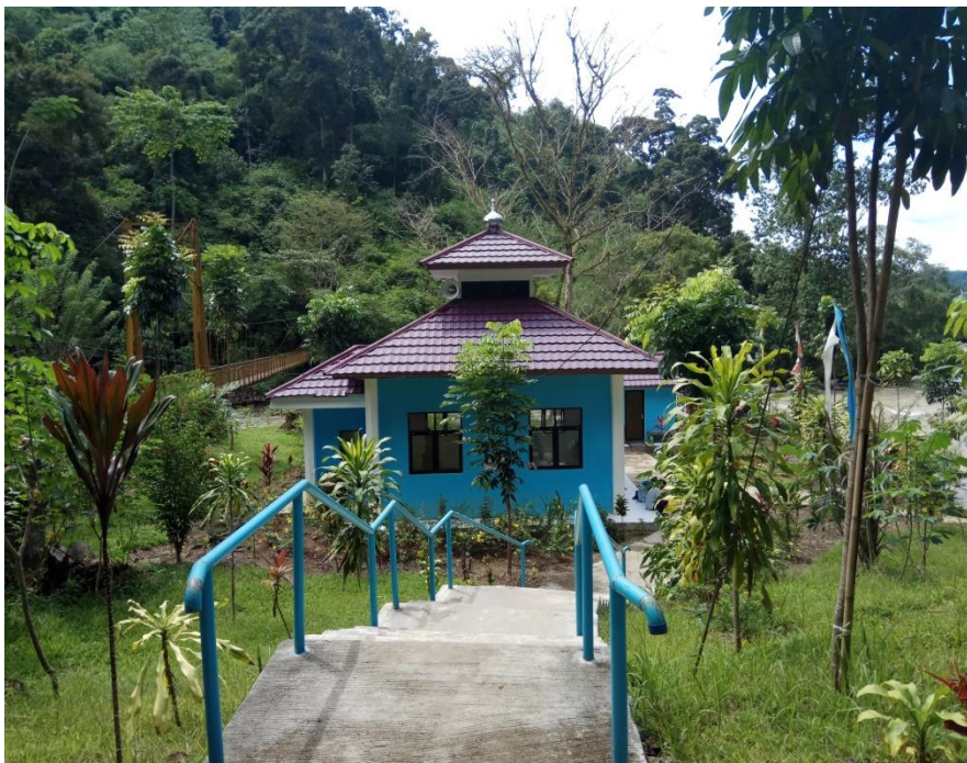
Mushola di Objek Wisata Air Terjun Curup Tenang Bedegung