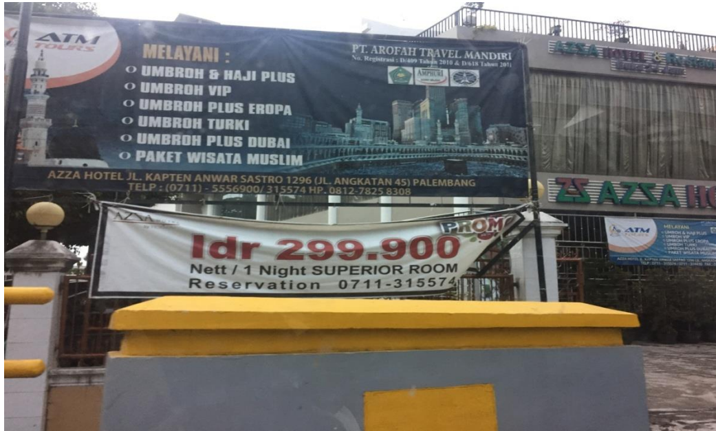
Salah satu bentuk promosi yang dilakukan oleh Hotel Azza Palembang