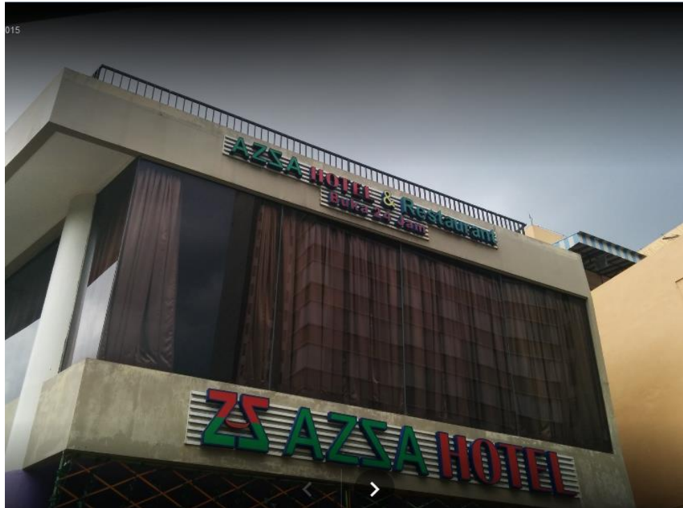
Gambar tampak depan Hotel Azza Palembang