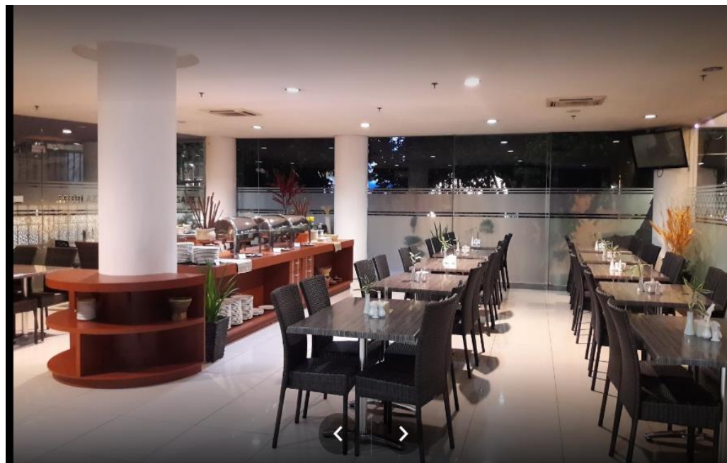
Dining Room Hotel Azza Palembang