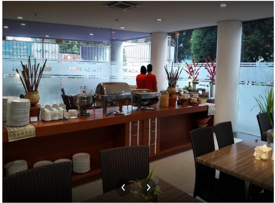
Banquet Hotel Azza Palembang