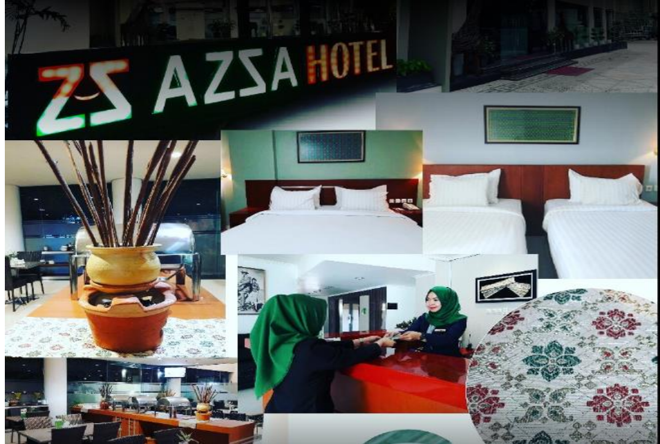
Gambar Fasilitas dan Kamar Hotel Azza Palembang