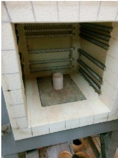
Gambar 16. Sampel Setelah dikalsinasi