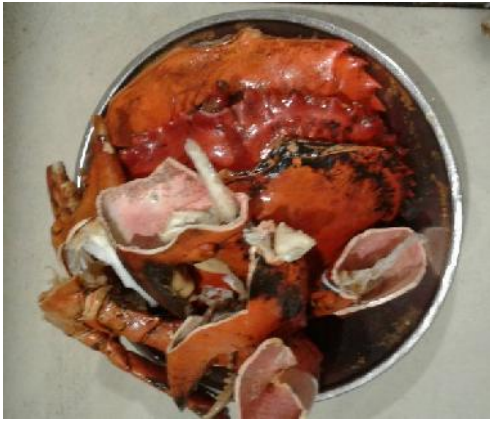
Gambar 8. Cangkang Kepiting setelah di cuci