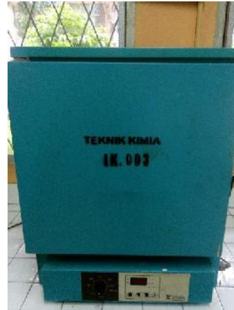
Gambar 9. Proses Pengovenan