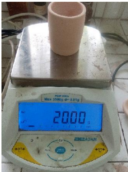
Gambar 14. Penimbangan Berat Sampel