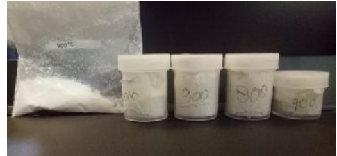
Gambar 23. Sampel yang akan dianalisa menggunakan XRD