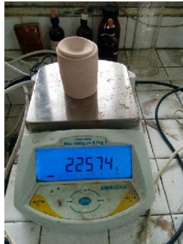
Gambar 17. Berat sampel setelah dikalsinasi