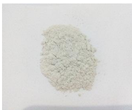
Gambar 21. Sampel pada Temperatur 1000 °C