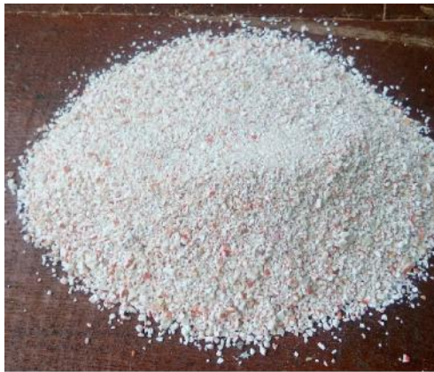
Gambar 10. Sampel Setelah dihancurkan