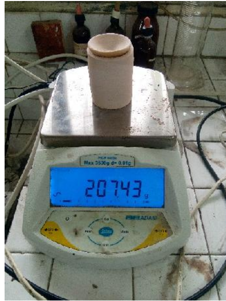
Gambar 13. Pengukuran Berat kendi Kosong