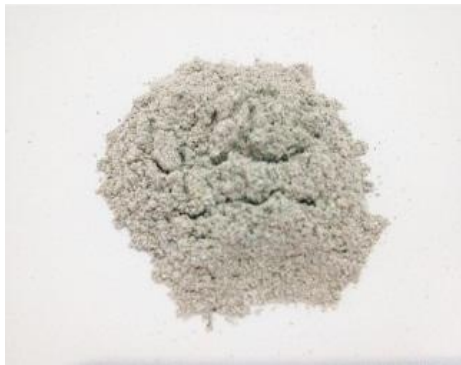
Gambar 18. Sampel pada Temperatur 700 °C