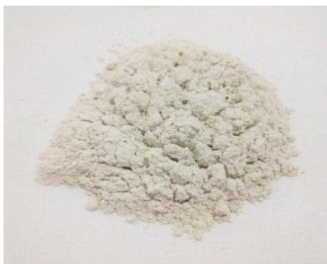
Gambar 20. Sampel pada Temperatur 900 °C