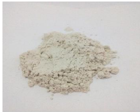
Gambar 19. Sampel pada Temperatur 800 °C