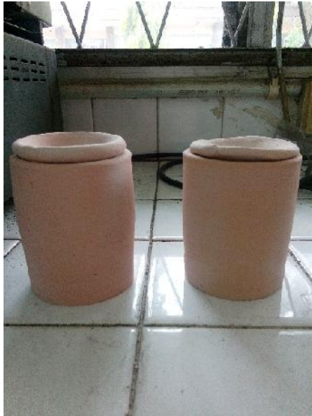
Gambar 12. Kendi (wadah sampel)