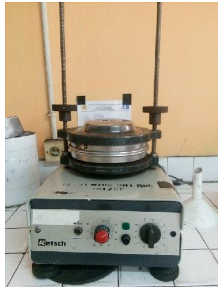
Gambar 11. Proses Sieving