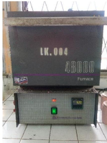
Gambar 15. Proses Kalsinasi