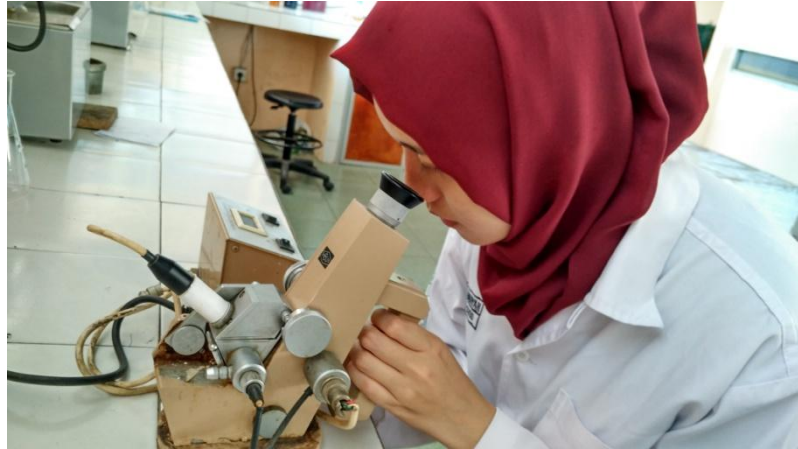
Menganalisa indeks bias produk