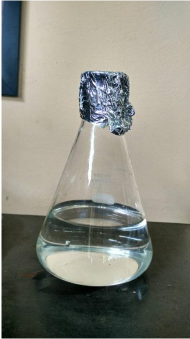
Etanol Produk 97,5 %