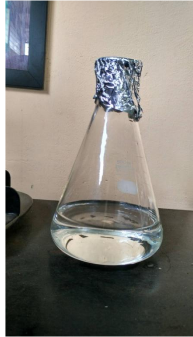
Etanol Produk 98,4 %