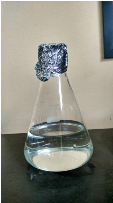
Etanol Produk 96,6 %