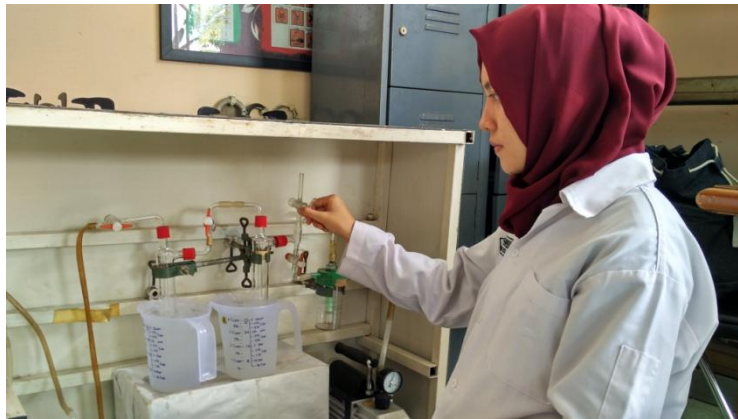
Mengatur tekanan sisi permeal