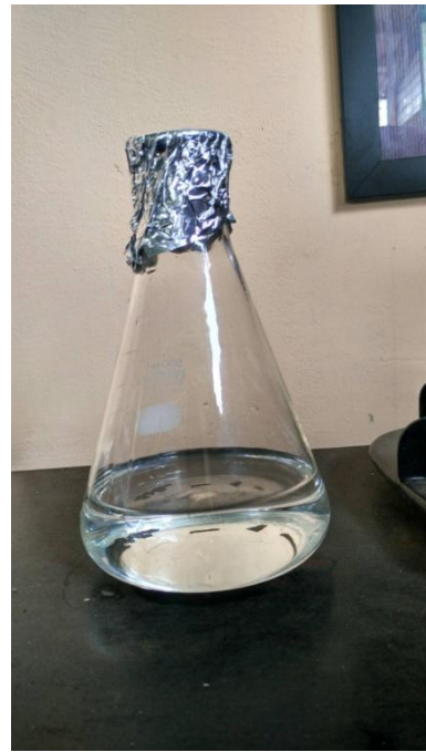
Etanol Produk 97 %