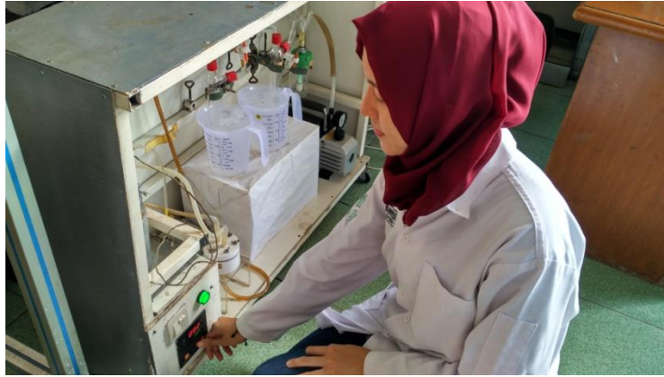
Mengatur temperatur umpan