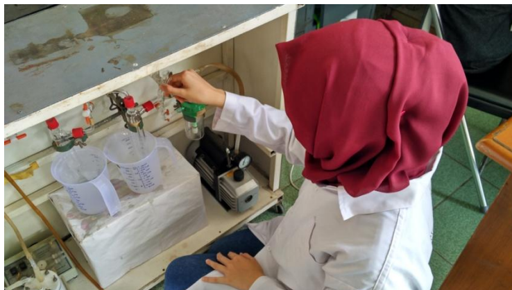
Mengatur katup aliran air