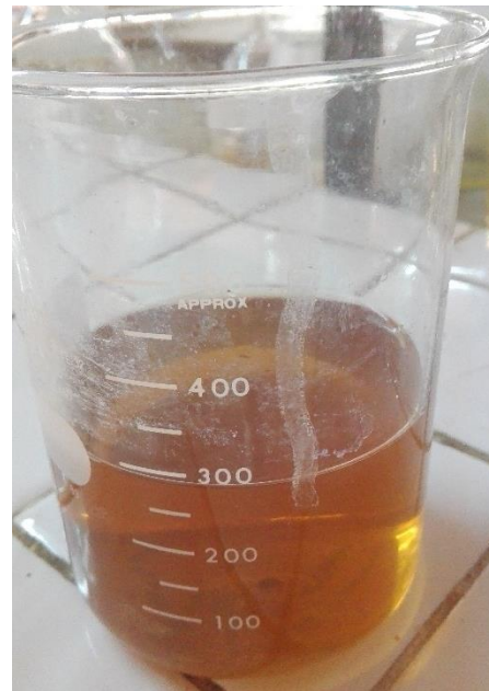
Gambar 14. Filtrat yang Didapat