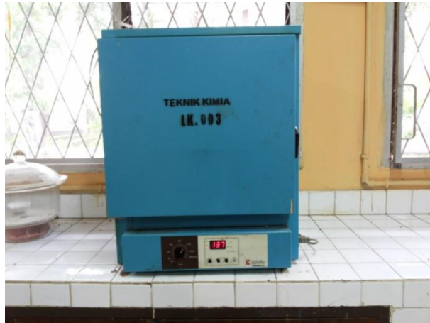
Gambar 19. Proses Pengeringan Silika Gel di dalam Oven