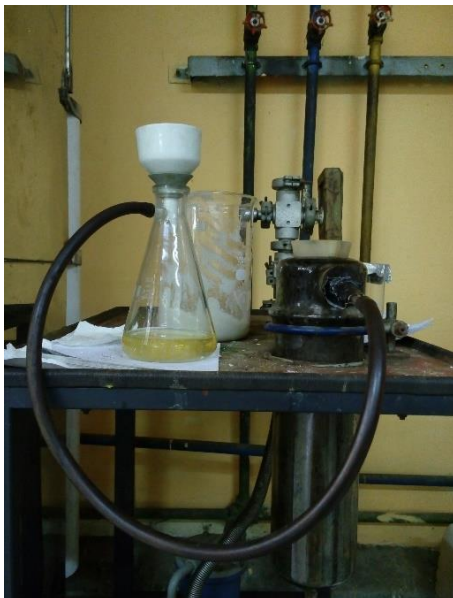
Gambar 17. Hasil Presipitasi Disaring Menggunakan Pompa Vakum