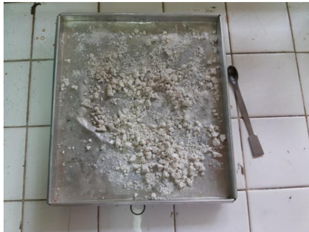
Gambar 20. Silika Gel Kering