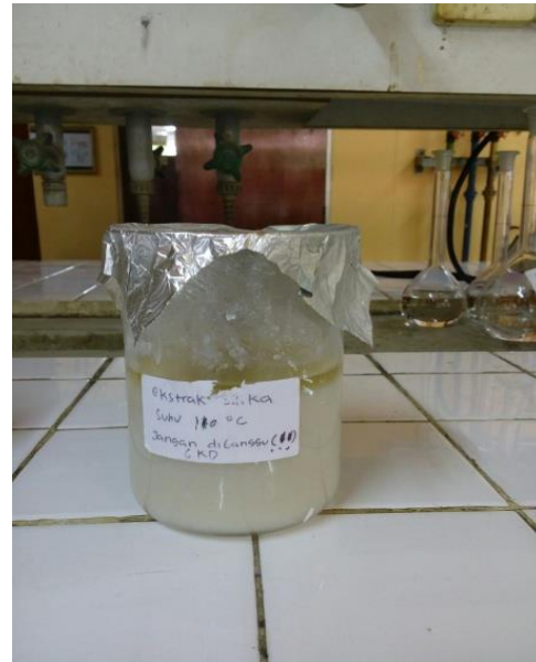
Gambar 16. Padatan Berbentuk Gel dari Proses Presipitasi