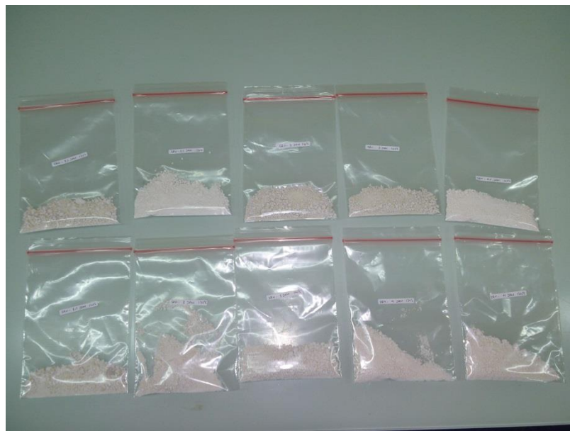
Gambar 23. Produk Silika Gel