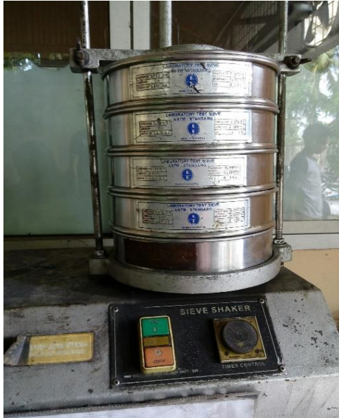
Gambar 8. Pengayakan Abu Sekam Padi 200 mesh