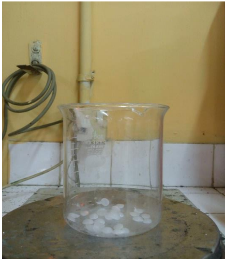
Gambar 10. Menimbang KOH