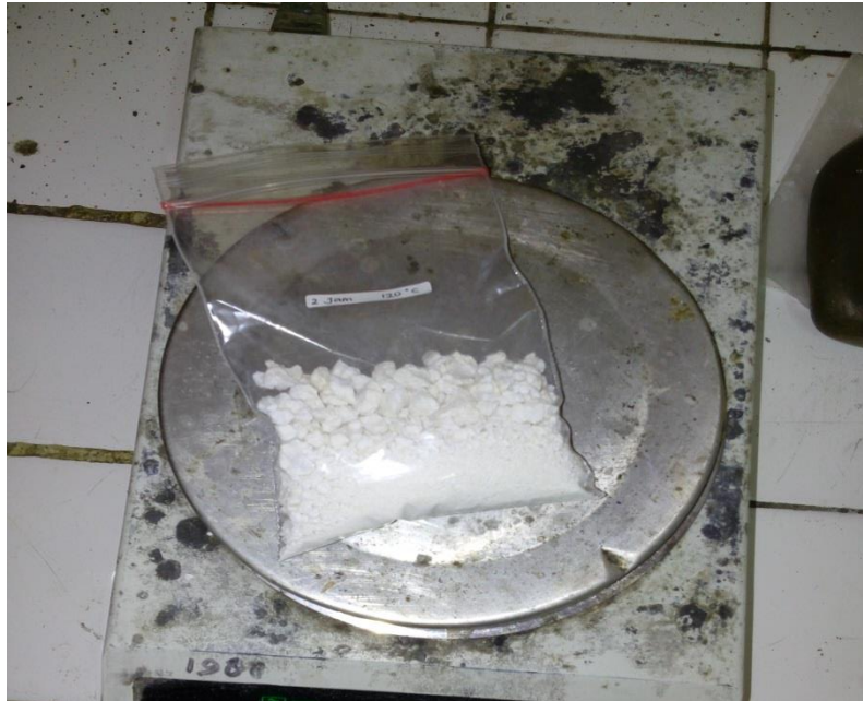
Gambar 22. Penimbangan Silika Gel Kering