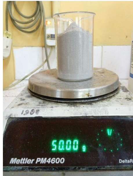
Gambar 9. Penimbangan Abu 50 gr