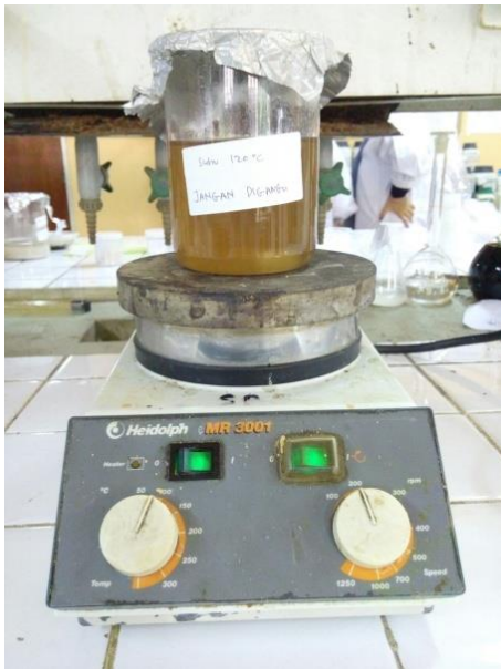
Gambar 15. Presipitasi Larutan Kalium Silikat