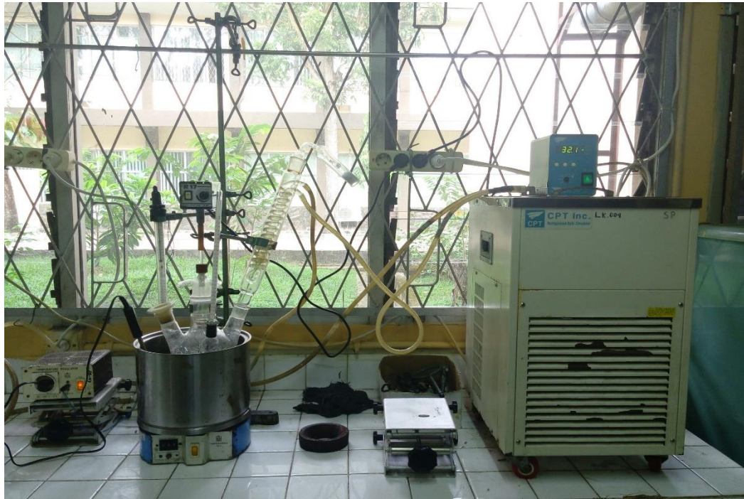
Gambar 12. Ekstraksi Abu Sekam Padi Menggunakan Pelarut KOH 2 M