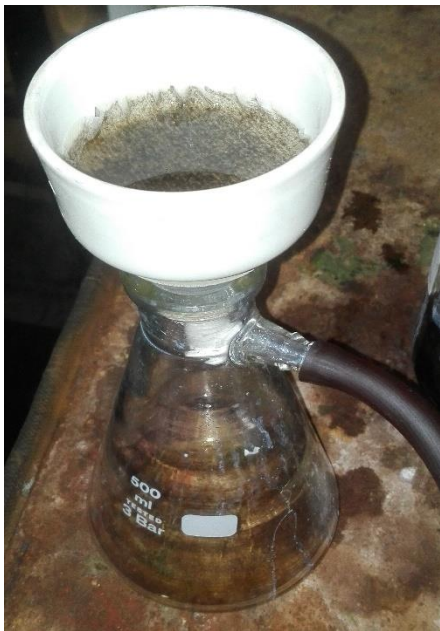
Gambar 13. Penyaringan Hasil