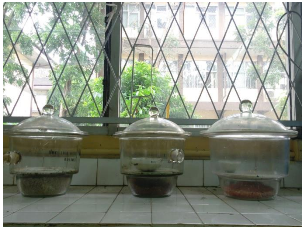
Gambar 21. Silika Gel Didinginkan di dalam Desikator