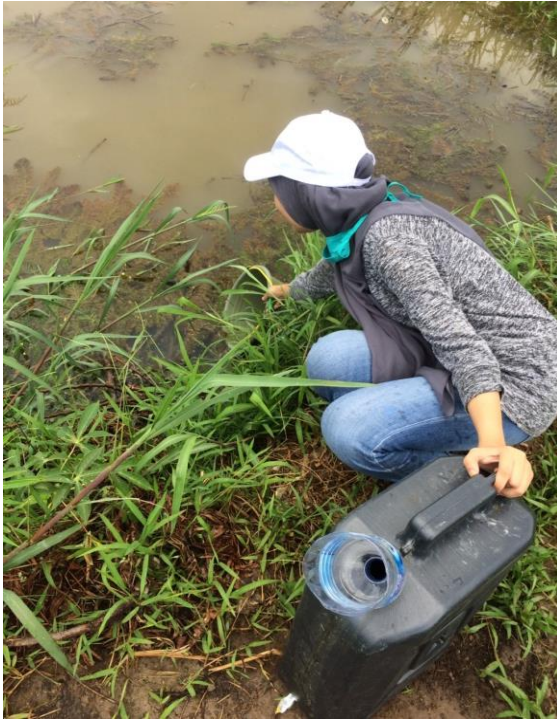
Pengambilan air rawa