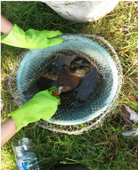
Pengolahan kotoran sapi dan air rawa