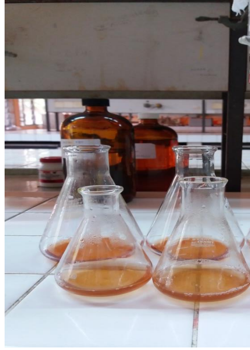
Sampel setelah di titrasi