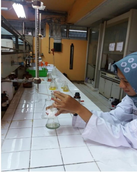
Titration sampel, penentuan nilai COD