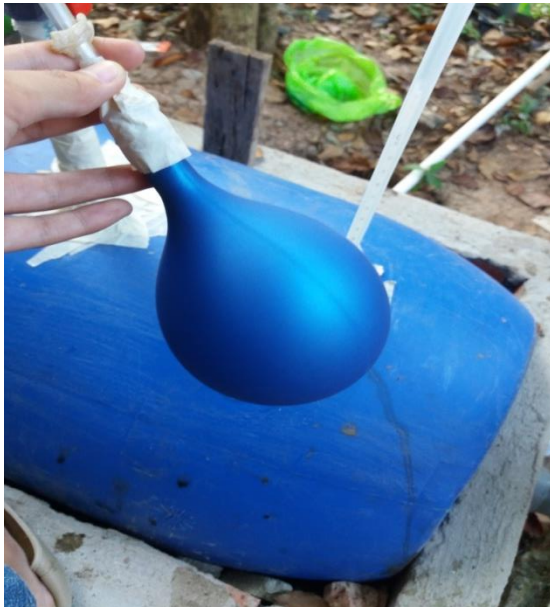
Proses penampungan gas