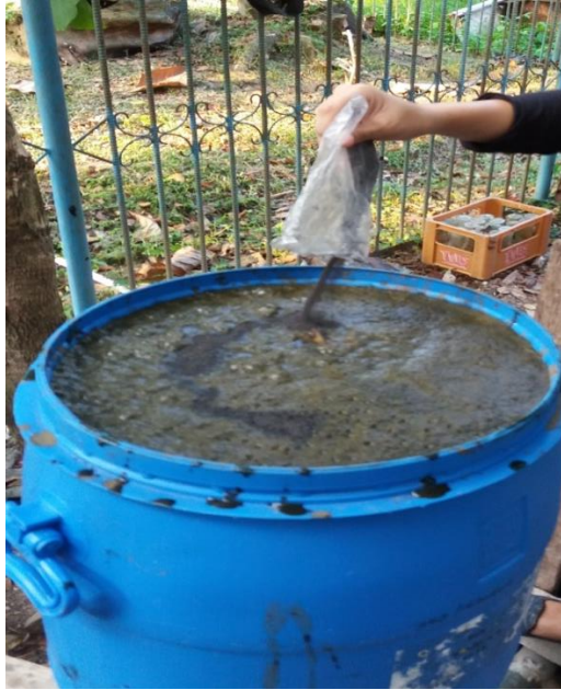
Penambahan Green Phoskko-7