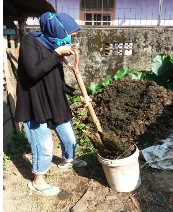
Pengambilan kotoran sapi