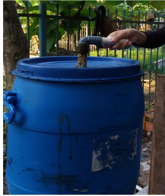
Proses pengadukan kotoran sapi, air rawa dan Green Phoskko-7