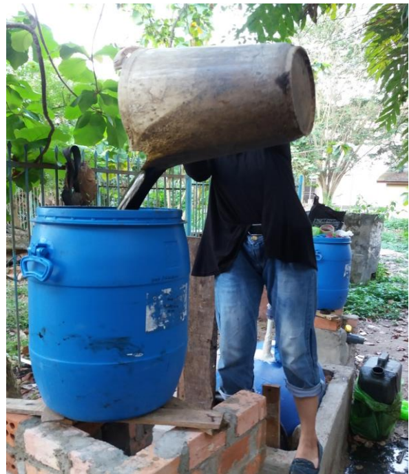
Memasukkan slurry ke dalam tangki pencampuran