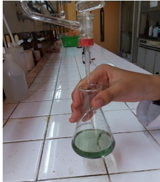
Analisa COD Standarisasi larutan FAS