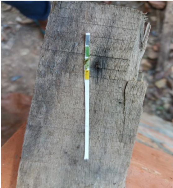
Pengukuran pH pada Slurry